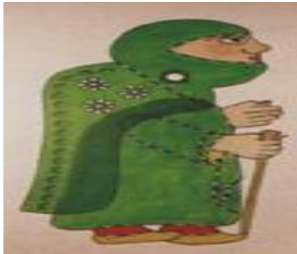
Resim 1.10. : Hımhım