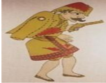
Resim 1.8. : Karagöz tiplerinden 'efe'