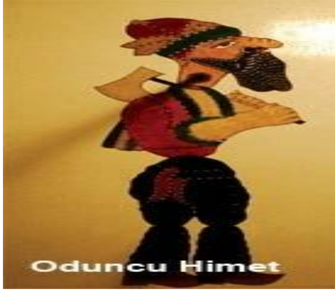
Resim 1.7. : Oduncu himet