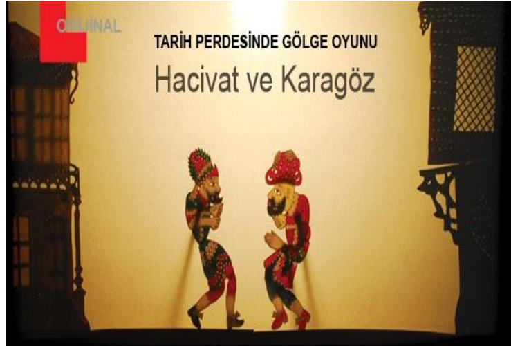
Resim 1.3. : Gölge oyunu

Gölge oyununun çıkış noktası Uzakdoğu Çin olarak bilinir. Ticaret ve geziler sonucu Endonezya, Java ve Hindistan’da yaygınlaşan gölge oyunu, mistik ve dinsel bir etkiye sahiptir. Türkler Çin ile yakın ilişkileri dolayısıyla bu sanatı öğrenmişler ve kendi kültürleri doğrultusunda geliştirmişlerdir.