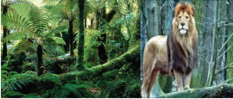
Resim 1.1. : Doğa ve vahşi hayvanlar