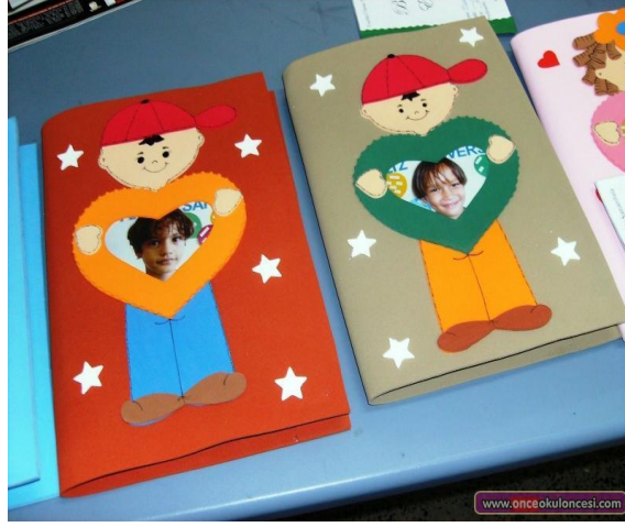
Resim 2.6.: Portfolyoya toplanacak ürünler için dosya