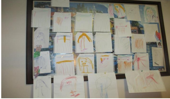
Resim.2.5: Portfolyo çalışması için duygu sergisi