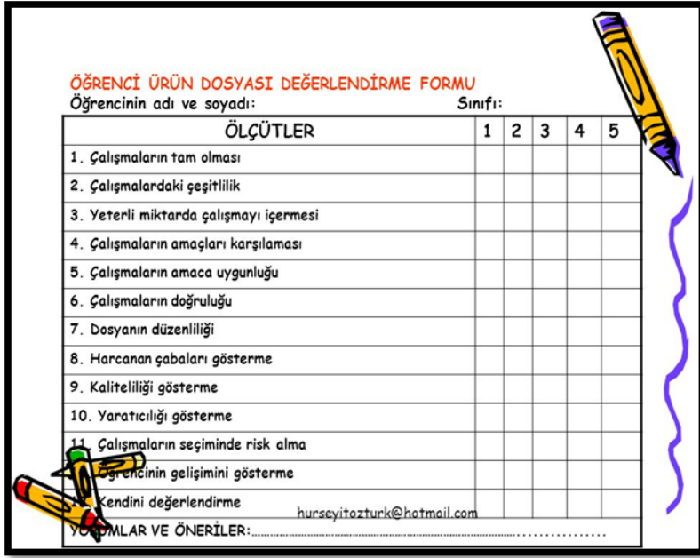
Resim 2.4. : Portfolyo değerlendirme formu