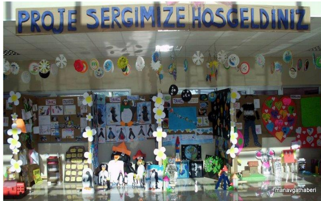
Resim 1.3: Proje sergileriyle çocukları değerlendirme

Eğitim döneminin başından itibaren her çocuk için bir “Gelişim Dosyası” (portfolyo) oluşturarak çocukların yaptığı bütün çalışmalar içinden çocuklarla birlikte seçtiklerini, ailelerden gelen mektup gibi belgeleri ve çocukların gelişim gözlem formları ile gelişim raporlarını bu dosyalarda biriktirmelidir. Eğitim dönemlerinin sonunda aileler okula davet edilerek “Gelişim Dosyası Paylaşım Günü” düzenlenmelidir. Çocukların bu güne katılan aile bireyleriyle kendi gelişim dosyalarındaki çalışmalarını paylaşmaları için rehberlik edilmelidir.