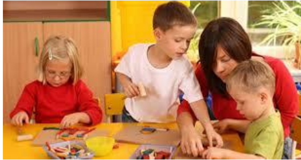
Resim 2.7: Portfolyo hazırlık sürecinde çocuklar