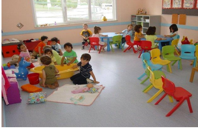
Resim 1.1: Okul öncesi eğitimde çocuklar

Okul öncesi eğitiminin önemi nedeniyle sürecin planlı ve programlı olması gereklidir. Eğitim etkinliklerinin, programda yer alan kazanımlara dayalı olarak hazırlanması, süreçte ve sonuçta çocuklarda oluşması beklenen öğrenme çıktılarına ne derece ulaşıldığının izlenmesi önemlidir. Bu nedenle okul öncesi eğitiminde değerlendirme, eğitim sürecinin temel öğelerinden biridir.