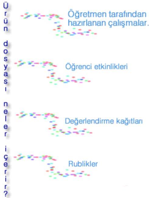
Resim 2.3: Ürün dosyası

Çalışma örnekleri, öğretmen tarafından, çocuğun performansı ve okul yılı boyunca gösterdiği ilerlemenin ürünleri olarak toplanır ve organize edilir. Gerçek öğrenci çalışmaları, sanat projeleri, ince motor aktivite örnekleri, teyp kaydı yapılmış dil örnekleri, resim ve karalamalar, çocuğun aktivite ve sosyal etkileşimini yansıtan fotoğraflar video ve teyp kayıtları çalışma örnekleri olarak belirtilen dökümanlardır (gibson, 1994; lankes, 1995; morrison, 1999). Çalışma örneklerinin, portfolyoda yer almasının anlamlı olabilmesi için toplama ve organize edilmelerinde bazı noktalara dikkat edilmesi gerekmektedir. çalışma örneklerine mutlaka tarih atılmalıdır. Toplanan çalışma örnekleri, kontrol listelerini destekleyecek şekilde gelişimsel alanlara uygun olarak ayrı bölümler halinde ve kronolojik sıra ile portfolyoda yer almalıdır. bu ürünlerin uygun şekilde portfolyoya yerleştirilmesi çocuğun sıralı gelişim başarısının gösterilmesi açısından önemlidir (Gibson, 1994; Morrison, 1999).