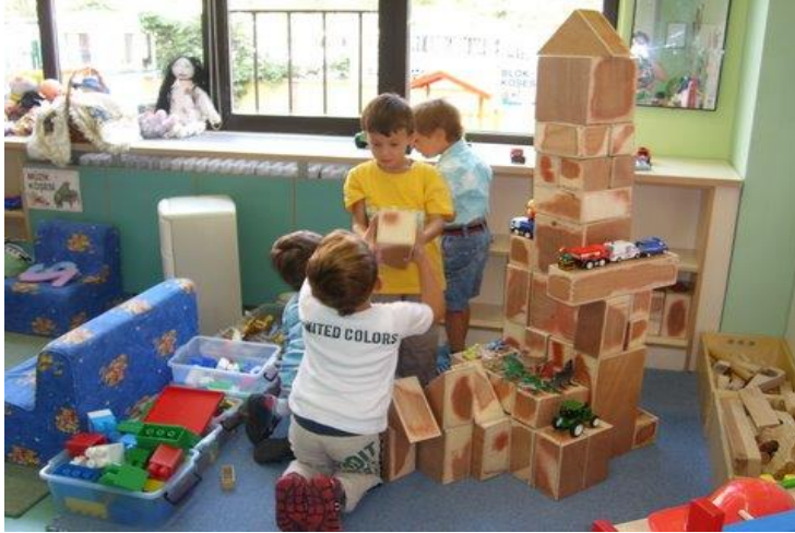
Resim 1.2: Çocuğu ve arkadaşlarını tanımak için yapılan gözlemden bir fotoğraf

Aktif öğrenme tekniklerinden biri olan, şiir yazma tekniğinde olduğu gibi size verilen sözcükleri, grup arkadaşlarınız arasında paylaşarak her biriniz bir dize yazmak suretiyle çocukların temel gereksinimleri ile ilgili bir şiir yazınız.(Dokunulma, güven, yapı/düzen, sosyalleşme, uyarlma, kendini değerli görme )