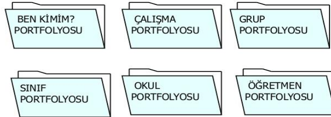
Resim2.2.: Portfolyo türleri