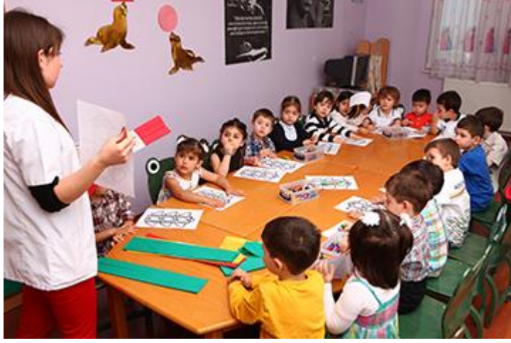
Resim 1.5: Çocukları tanıma ve değerlendirme sürecinde öğretmen

Çocukların yaşamını soru işaretleriyle karartmak yerine, yeni yaşantılara kapı aralayarak aydınlatınız.