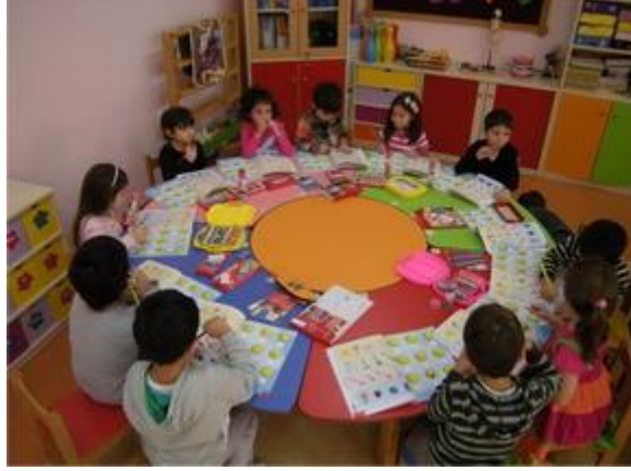
Resim 1.4: Çocukları tanımada grup etkileşimi

Çocukların çevresine ait potansiyeli kullanarak, anlamlı bulduğu değerler doğrultusunda kendisini değiştirebildiği ve geliştirebildiğini unutmayınız.