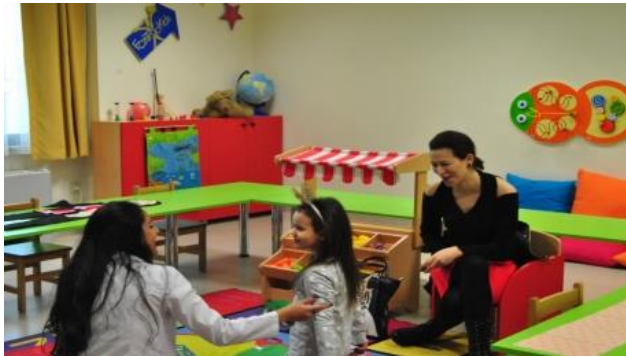
Resim 1.7: Sınıf ortamında gözlem