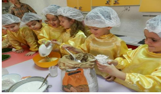
Resim 1.6: Çocuklarda ilgi ve yetenekler