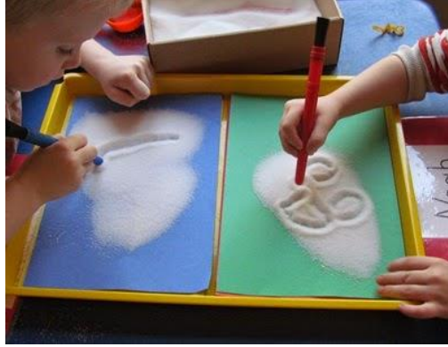
Resim 1.8: Okul öncesi çocuklarının yaptığı bir iş örneği

Çocuğun çeşitli alanlarda sınıf içi etkinliklerinde yaptığı örnekleri içerir. Öğretmen, eğitim yılı başında, değerlendirme amaçlı ne tür örneklerin toplanacağı konusunda hedef belirler. İş örneklerinden saklanamayacak, korunamayacak formatta olanlarının, fotoğrafı çekilir. Çocuğun yaratıcı çalışmalarından örnekler, resimleri her çocuğun kişisel özelliklerinin farkına varılması açısından önemlidir. Video kayıtları, büyük kas gelişimi alanındaki koordinasyon ilerlemesini ya da aynı şekilde ses kasetleri de, dil gelişimi alanındaki becerileri belgelemek amacıyla kullanılabilir.