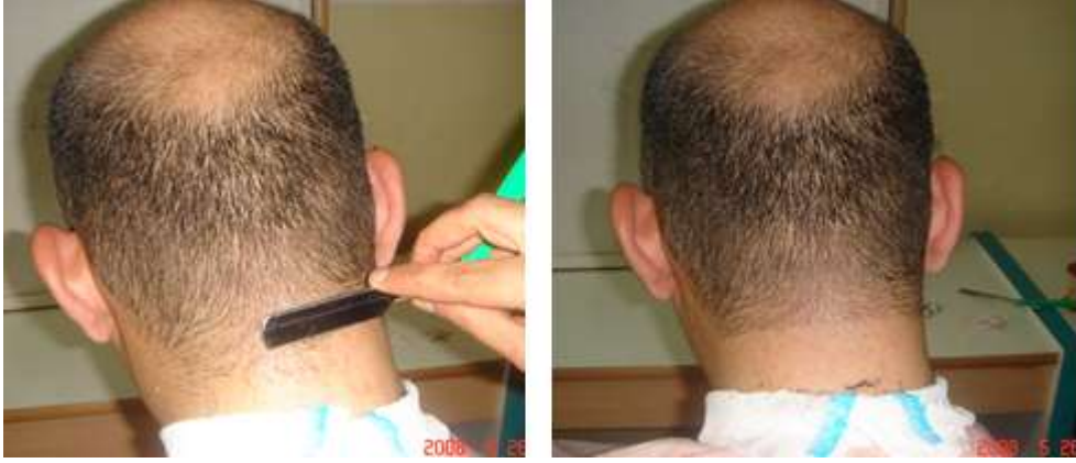
Resim 2.2: Ense çizgisinin usturayla kesilerek belirlenmesi

Hazırlanan kalıp baş üzerine yerleştirilir. Gerekirse kaymaması için saçlara hafif şekilde bantla yapıştırılır.