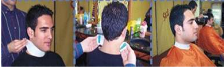
Resim 1.3: Boyun bandının takılması