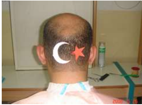
Resim 2.3: Hazırlanmış kalıbın, baş üzerine yerleştirilmiş hali

Hazırlanan kalıp baş üzerine yerleştirilir. Gerekirse kaymaması için saçlara hafif şekilde bantla yapıştırılır.