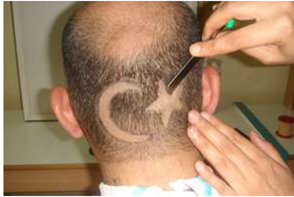
Resim 2.5: Usturayla kazınarak şeklin ortaya çıkarılması

Kesim işlemine ise şeklin çerçevesinin belirlenmesiyle başlanır. Çerçeve ortaya çıktıktan sonra kalan saçların kesilmesi daha kolaydır. Çerçeveyi keserken ense ya da kulak-burun makinesi kullanımı uygulamayı kolaylaştırır ve şeklin daha kolay ortaya çıkması sağlanır. Bu aşamadan sonra kalan saçların kesilmesinde ise ustura kullanılması daha doğrudur.