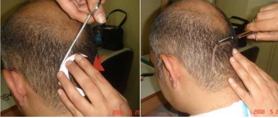
Resim 2.4: Kalıbın makas yardımıyla başta belirlenmesi

Şeklin çizilerek belirlenmesinin ardından kesim işlemine geçilir. Öncelikle şeklin içinin mi yoksa dışının mı kesileceğine müşterinin de fikri sorularak karar verilir. Ardından uygun kesme aracıyla kesime başlanır. Bu aşamada ustura, ense makinesi, kulak-burun makinesi kullanılabilir. Ustura kullanıldığı takdirde kesimi kolaylaştırmak için tıraş kozmetiği de kullanılabilir. Ense makinesi tercih edildiği takdirde kesim işlemi makinenin 0 ayarı ile yapılır.