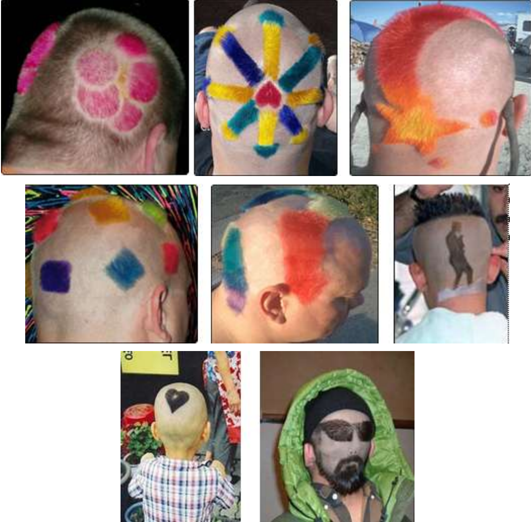
Resim 2.6: Saç Şekillendirmeye İlgili Değişik Örnekler