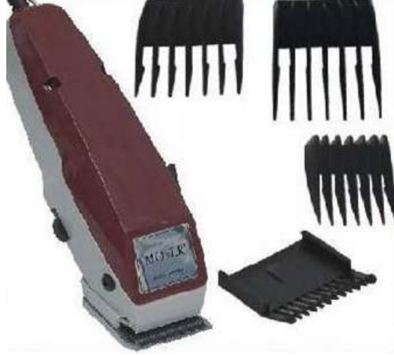
Resim 1.1: Elektrikli saç kesme makinesi ve farklı boylarda kesim taraqları

Tıraş sonrası kesme taraqları uygun sterilizasyon yöntemi ile sterilize yapılmalıdır. Makinenin iç bölümleri özel fırçaları ile temizlenmelidir. Sürten kısımları yağlanarak bakımı düzenli olarak yapılmalıdır.