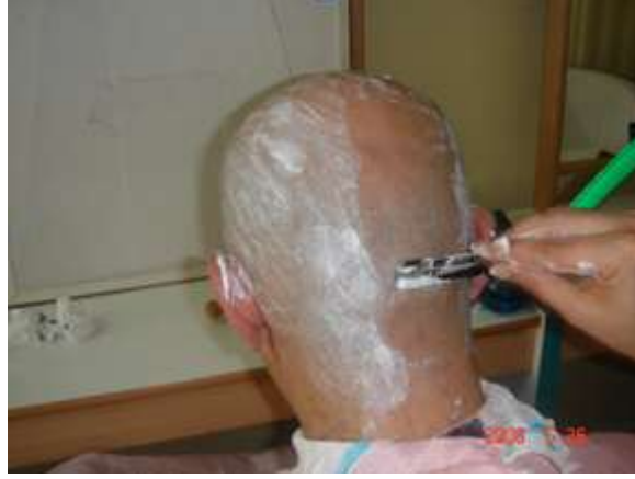
Resim 1.5: Saçların usturayla kazınması

Bütün saçlar kazandıktan sonra baş derisi kontrol edilir ve kesilmeyen ya da uzun kalan saçlar olup olmadığı kontrol edilir. Gerekirse başa tekrar az miktarda yumuşatıcı tıraş kozmetiği sürülerek işlem kabaca tekrarlanır. Bu aşamadaki uygulama, ilki kadar ayrıntılı değildir. Ustura daha geniş alanlara sürülerek kalan kılların toparlaması sağlanır.