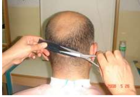
Resim 2.1: Şekil verilecek saçın kesilerek düzeltilmesi