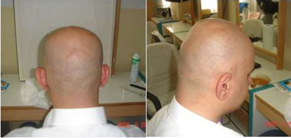
Resim 1.6: Uygulamanın bitmiş hali

Uygulama sonunda kafa derisi yıkanarak kalan kıllardan ve tıraş kozmetiğinin kalıntılarından arındırılır.