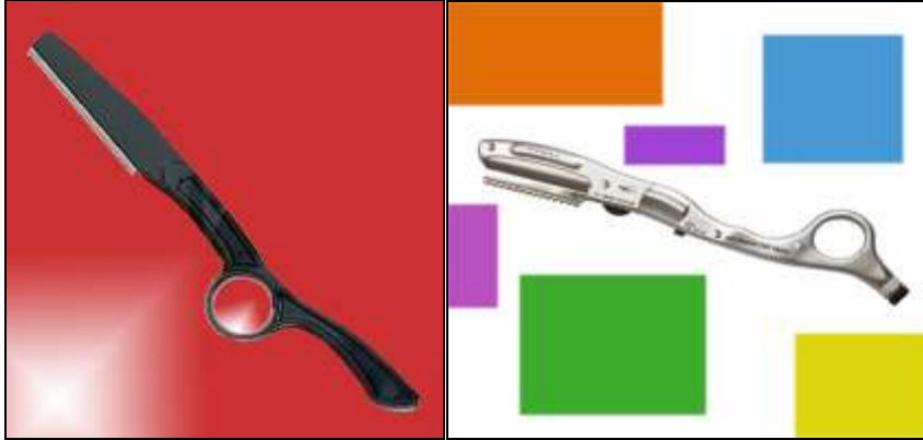
Resim 1.3: Farklı ustura modelleri

Tıraşta ense, kulak hizaları, favoriler ve kulak arkalarının düzeltilmesi için kullanılır. Bunun yanı sıra ustura ile tıraş tekniğinde saçları tamamen kazımak için kullanılır.