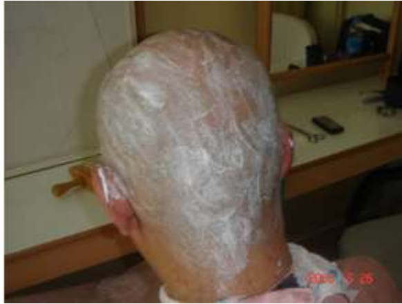
Resim 1.4: Saçların kazınmak üzere saç köpüğü ile yumuşatılması

Tıpkı sakal tıraşında olduğu gibi saçlar yumuşaması için tıraş sabunu ya da tıraş köpüğü ile iyice köpürtülür. Saç kılları çok sert ve gürse tıraş sabunu kullanmak daha etkilidir. Yeterince yumuşadıktan sonra saçlar usturayla dikkatli şekilde kazınır. Uygulama genellikle önden arkaya doğru yapılır.