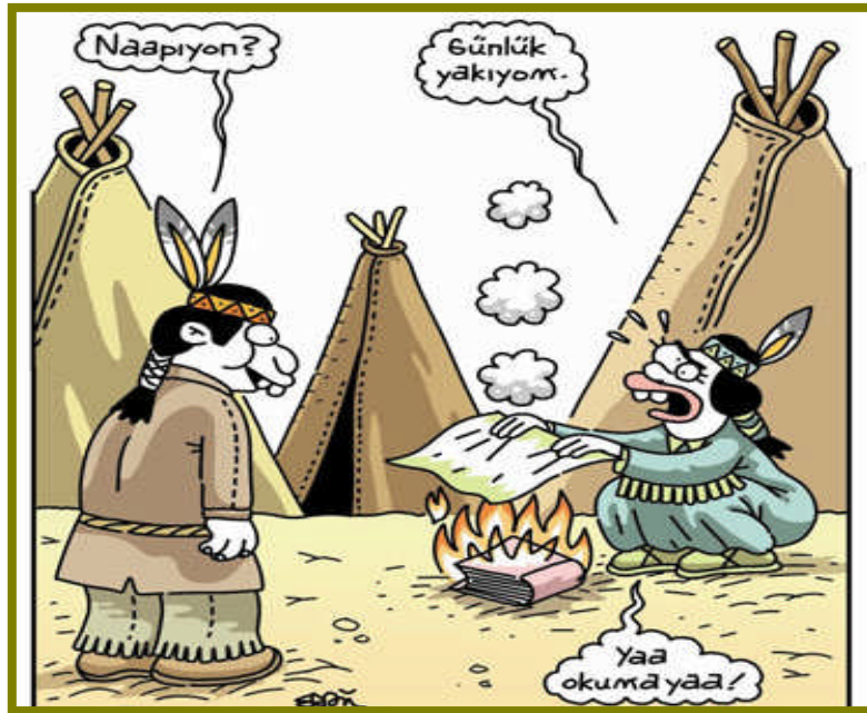
Resim 1.2: Haberleşme üzerine bir karikatür

Aşağıdaki çalışmaları önce süre tutmadan daha sonrada 5 dakika tutarak yazınız. Yazdığınız çalışmayı metinle karşılaştırınız. Hatalarınız varsa bir yere not alınız.