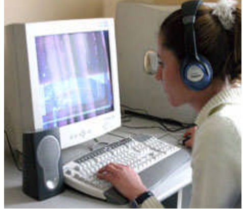
Resim 2.2: Kulaklı yapılan dinleme

Yabancı dil eğitim laboratuvarlarında olduğu gibi kulaklıkla dinlenen sesler yazıya aktararak çalışmalar yapılabilir.