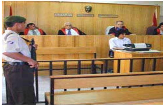
Resim 2.1: Mahkeme salonunda hâkimin söylediklerinin yazılışı

Konuşmacıya karşı ön yargılı olmak, dinleyeceğimiz kişinin tavır ve davranışları, beden dilini kullandığı şekli, aşırı yorgun ve isteksiz olmak psikolojik olarak dinlemeyi engeller.