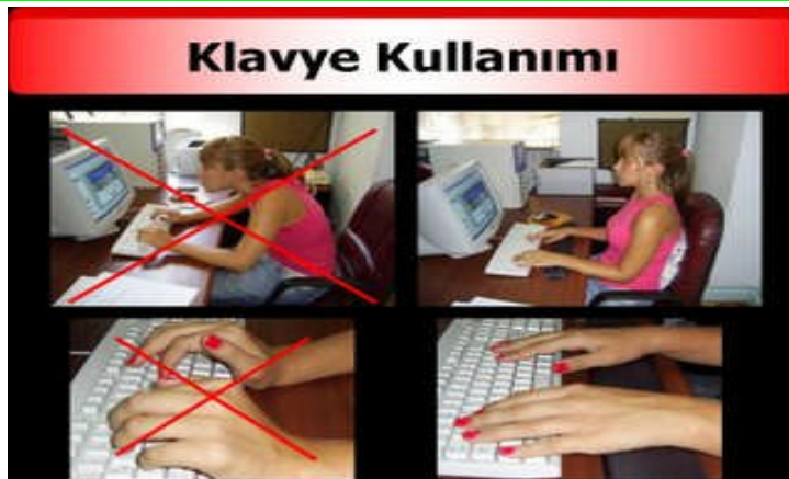
Resim 1.1: Klavye kullanımında oturuş ve parmakların durumu

Bilgisayarlar beş yıl içinde iyi bir araştırma görevlisi kadar iyi bilgi toplayabilecekler. Çalışanlarınızın eline güçlü bilgisayarlar verdiğinizde, firmayı güçlendirecek yeni yollar üretebilirler ve hiç beklemediğiniz bir sinerji yakalayabilirsiniz. Yazılım firmaları yazılımlarını daha kullanıcı dostu yapmaya çalışıyorlar. Kalemın yazıyı kontrol edemeyeceği gibi, bilgisayarlar da kararları kontrol edemez. Ama kalemsiz yazmaya çalışmanın da hiçbir avantajı yoktur.