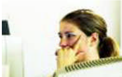
Resim 2.3: Söylenenleri dinlemede dikkat

Bu şemada hız yöneticisi olarak adlandırılan beyindir. Beynimiz işittiğimiz kelimeleri karakterlere dönüştürmemizi sağlayarak parmaklarımıza yaptığı uyarı ile (motor hareket dediğimiz) tuşlara vurmamızı ve günden güne yapılan çalışmalarla dinleyerek de hızlı bir şekilde yazı yazabilmemizi sağlar.