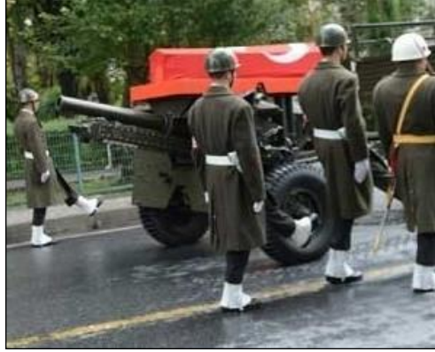
Resim 5.4: Katafalk olarak kullanılan top arabası