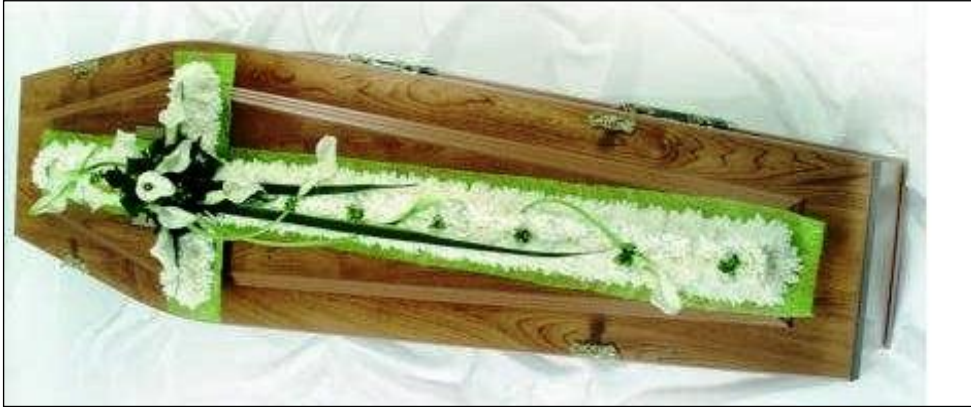
Resim 3.19: Tabut üzeri uygulama