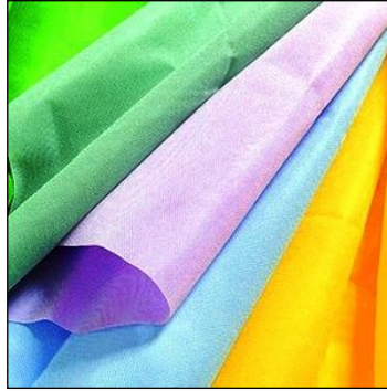
Resim 1.17: Süslemede kullanılan kumaşlar