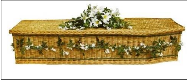
Resim 3.11: Süslemede kullanılan bitkiler