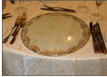
Resim 1.14: Supla