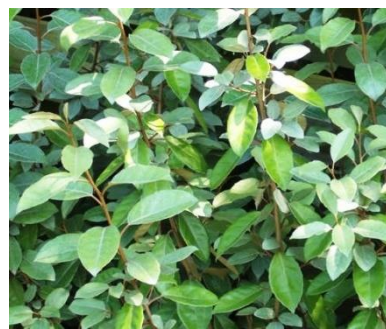
Resim 3.10: Oleaster