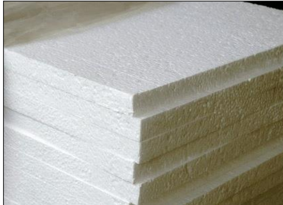
Resim 3.7: Strafor

Strafor, hafif ve taşınması kolay olan ve bu nedenle tabut süslemede tercih edilen bir malzemedir. Tabut üzerine konulacak strafora kalp, simit, haç gibi değişik modellerde şekil verilerek üzeri süslenecek bir iskelet oluşturulur. Strafor, ıslatılmadığı için oasis'e göre daha hafif kullanımlı bir malzemedir.