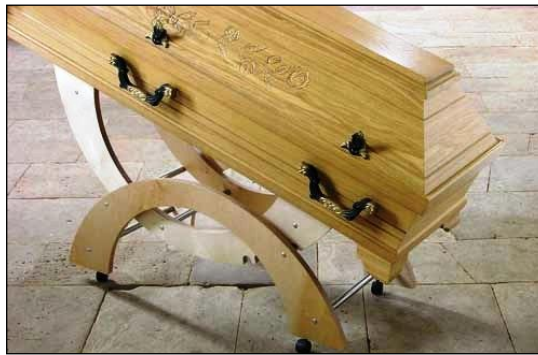
Resim 5.8: Müşteri isteğine göre tasarlanmış katafalk