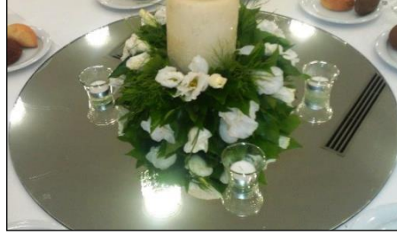
Resim 1.6: Masa üstü ayna