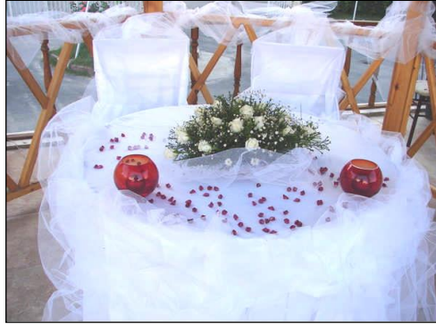
Resim 2.26: Çiçeklerin yerleştirilmesi

Çiçekler en sona bırakılır. Çiçekler en sona bırakılması gerektiği için şamdanlar masaya en son konmalıdır. Masa çiçeğinin altına sandalye dekorasyonunda kullanılan kumaş şeritler serilir. Sade veya renkli çiçeklerle masa ortası aranjman yapılır veya masa ortası gümüş, kristal şamdanlarla ışıklandırılır.