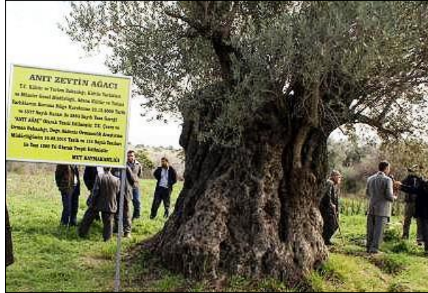
Resim 4.5: Anıt ağaç

Anıtlar farklı şekillerde dizayn edilmiş yapılar veya heykel şeklinde olabilir. Bunun yanında bazen ağaçlar da anıt olarak kabul edilmektedir. Zafer takları da tarihteki önemli anıt örnekleridir. Romadaki büyük zafer takları Romalı generallerin, Paristeki ünlü Zafer Takı, Napolyon ordularının savaşta kazandıkları zaferlerin anısına dikilmiştir.