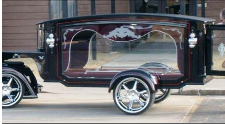
Resim 5.10: Katafalk olarak hazırlanmış araç

Katafalk süslemesi bir plan dâhilinde yapılmalıdır. Aksi takdirde düzenleme ve süslemeler zamanında bitmeyebilir.