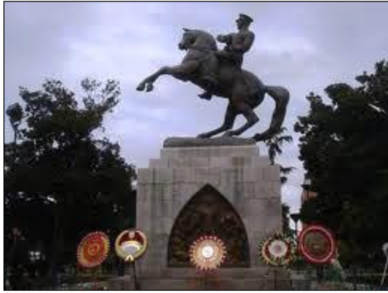
Resim 4.11: Atatürk anıtının çelenklerle süslenmesi

Anıt süslemenin ana materyali çelenklerdir. Çelenkler anıtta yapılacak törenin içeriğine göre seçilmelidir. Resmi bir tören ise kırmızı tonların hâkim olduğu çelenkler kullanılmalıdır. Çelenkerin hazırlanmasında siyah krapon kâğıdı kullanılmalıdır.