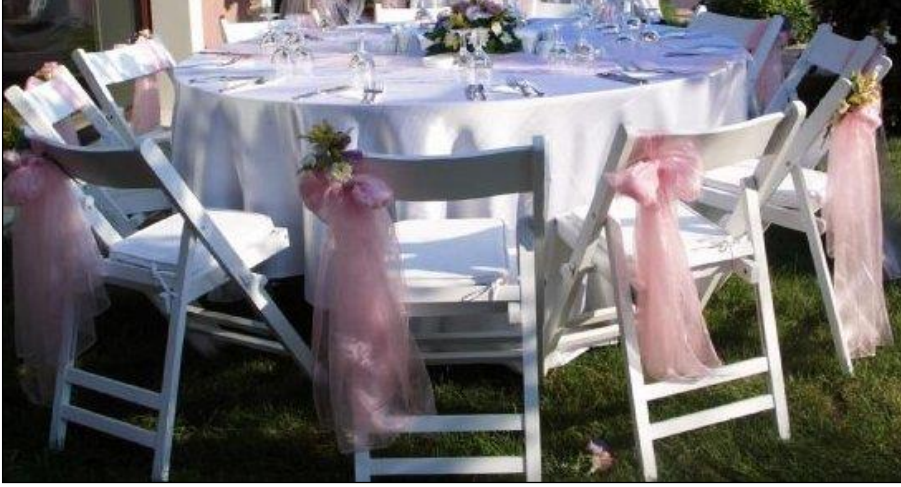
Resim 2.6: Fiyonklarla süslenmiş tiffany sandalyeler

Açık alanda kullanılacak sandalyeler, alanın kullanım amacına ve müşterinin tercihinine göre değişir. Açık alanlarda çoğunlukla fiyonklarla süslenen tiffany sandalyeler kullanılır, giydirme sandalyeler pek tercih edilmez. Resmi toplantılarda ise daha sade sandalyeler kullanılmalıdır. Sandalyeler tercih edilen renkte fiyonklarla bağlanıp, arka cephesi canlı çiçeklerle süslenebilir. Son yıllarda sadece fiyonk bağlanıp veya çiçeklerle, kurdelelerle basit süslemeler yapılan dekoratif sandalyeler tercih edilmektedir. Açık alanlarda, özellikle havuz başı süslemelerinde daha çok beyaz renkte sandalyeler tercih edilmektedir.