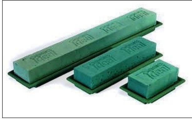
Resim 3.6: Oasis