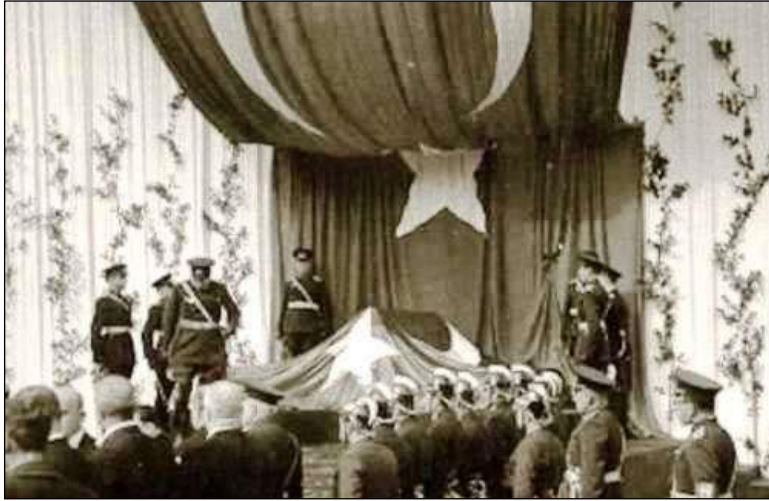
Resim 5.3: Atatürk'ün cenaze töreni

Katafalk, günümüzde hemen her ülkede toplumun her kesimi tarafından cenaze törenleri sırasında kullanılan bir araç haline gelmiştir. Katafalk hem devlet törenlerinde hem de bireysel cenaze törenlerinde dizayn edilerek kullanılmaktadır. Ülkemizde Atatürk'ün ölümü sonrası düzenlenen cenaze töreninde katafalk kullanılmıştır.