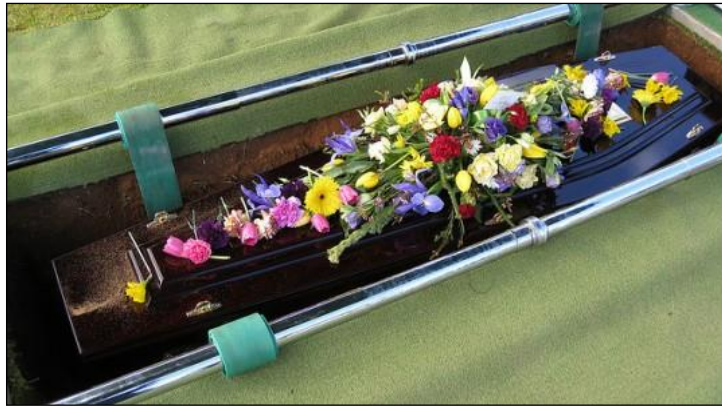
Resim 3.5: Çiçeklerle süslenmiş tabut

Bazı özel günlerde hazırlanan çiçek düzenlemeleri mutluluğumuzu anlatırken, cenaze gibi üzüntülerimizi ve vedalarımızı ölen kişiye olan sevgimizi ve bağlılığımızı da çiçeklerle ifade edebiliriz. Doğumda insanoğlu çiçeklerle karşılanırken ölümden de çiçeklerle uğurlamalar günümüzde normal karşılanmaktadır.