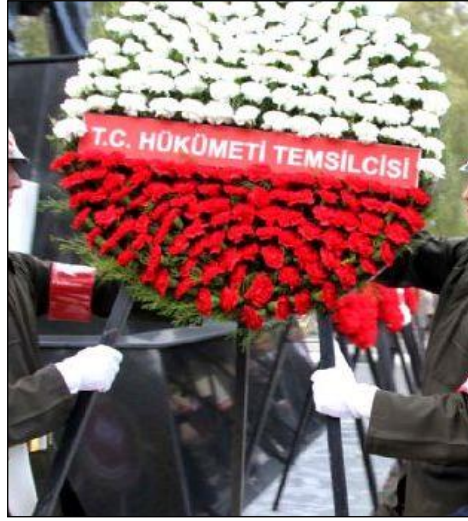
Resim 4.6: Çelenk

Anıt tasarımında çelenk haricinde canlı çiçek, yeşillik, anız veya kurutulmuş otlar, makas, bıçak, bant, kumaş (siyah ve beyaz renkte), kurdele (siyah renk), pirinç bariyerler ve kırmızı kuşaklar ile diğer aksesuarlar kullanılmaktadır.