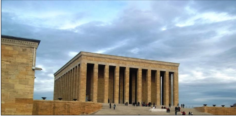
Resim 4.3: Anıtkabir

Ülkemizde bulunan ünlü anıtların başında Anıtkabir, Çanakkale Şehitler Abidesi ve Samsun Atatürk Onur Anıtı; dünyadaki ünlü anıtlar arasında ise A.B.D.’de bulunan Özgürlük Anıtı ve Brezilya’da bulunan Kurtarıcı İsa heykeli gelmektedir.