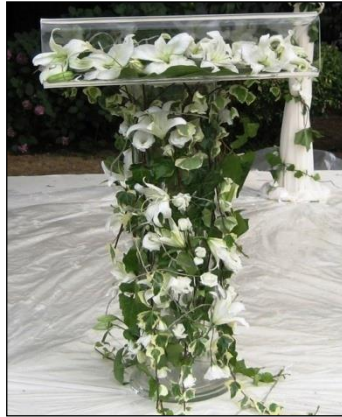
Resim 4.13: Konuşma kürsüsünün süslenmesi

Anıt süsleme yapılırken tören konuşmaları için hazırlanmış olan platform veya kürsünün de süslenmesi gereklidir. Bu amaçla çiçekle süsleme yapılmalıdır. Yapılacak aranjmanlar platform ebatlarına göre değişebilmektedir. Çiçek renkleri kişi tercihi göre değişmekle beraber, beyaz ve kırmızı tonların hâkim olduğu çiçekler kullanılmalıdır. Yine süslemede kullanılacak çiçekler mevsime göre değişmektedir.