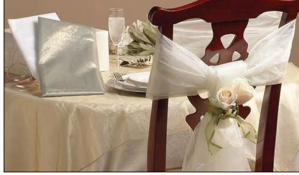
Resim 2.19: Çiçekle süslenmiş masalar

Fakat son yıllarda daha çok dekoratif sandalyeler tercih edilmektedir. Bu sandalyelere sadece fiyonk bağlanıp veya çiçeklerle, kurdelelerle basit süslemeler yapılmaktadır. Kapalı alanlarda Hilton tipi sandalyeler kullanılır ve daha şık durması için giydirme yapılır.