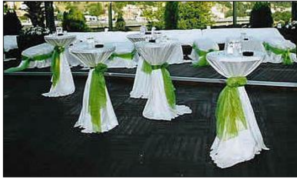
Resim 2.5: Kokteyl masaları

Açık alanlarda kokteyl masası olarak genellikle lake masalar, lake sehpalara ve küçük oturma grubunda şeklindeki konseptler kullanılır. Kokteyl masalarında kullanılacak örtü masanın lake, cam, ayna vb. olmasına göre değişir. Cam ve ayna masalarda masa örtüsü kullanılmayabilir. Kokteyl masası hazırlanırken genellikle canlı fanuslu çiçekler tercih edilir, fakat alan kaplayan ve büyük gösterişli çiçekler pek tercih edilmez.