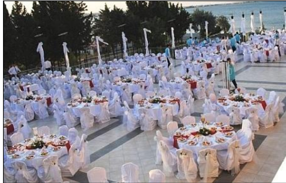
Resim 2.1: Açık alanda düğün organizasyonu

Açık alan süslemesi yapabilmek için, açık alanda kullanılacak alet ve malzemelerin bilinmesi gereklidir. Açık alan süslemesi ile ilgili bilgiler aşağıda anlatılmıştır.