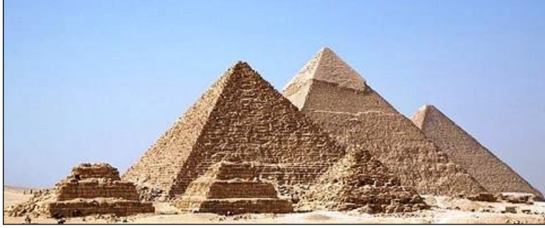
Resim 4.2: Mısır piramitleri

Büyük ve önemli bir olay veya kişinin gelecek kuşaklarca anılması için yapılan, göze çarpacak büyüklükte ve simge niteliğinde yapıya anıt adı verilir. Anıtların yapılış amacı, bir kişinin, olayın veya tarihsel bir dönemin anısını canlı tutmaktır. Örnek olarak Mısır piramitleri anıtmezar şeklinde yapılmış olup oraya gömülen kralların anılarını yaşatmak amacıyla yapılmışlardır. Yine dünyanın pek çok yerinde meydan ve caddelerde tek bir kişinin anısına dikilmiş anıtlara rastlanır.