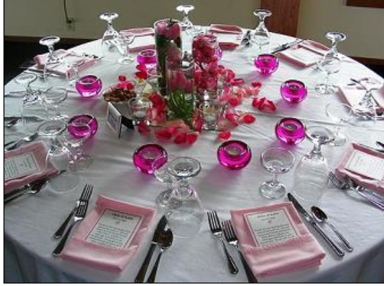
Resim 2.15: Yemek masası

Öncelikle masa örtüsü serilir ve tercihe göre ikinci bir örtü serilebilir. İkinci örtüler isteğe bağlı olarak dantel veya tül olabilir. Masa ortasına yerleşilecek materyaller ise ayna, şamdan, canlı ve yapay çiçek aranjmanlarından oluşur. Yemek masasında yemek düzeni için tabak, bardak, çatal, bıçak, peçete ve peçetelerin yüzükleri masa etrafına yerleştirilir. Masaların üzerine tercihe göre pul, taş, boncuk ve benzeri dekoratif süsler kullanılabilir.