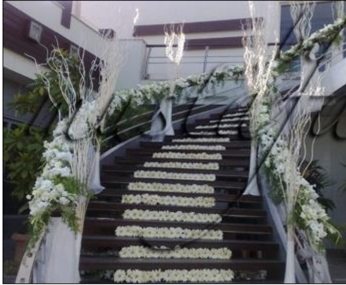
Resim 2.8: Merdiven süsleme

Merdiven süslemelerinde genellikle yeşil yapraklar, tül, canlı ve cansız çiçekler kullanılır. Düğün, nişan, kutlama gibi organizasyonlu açık alanlarda merdiven süslemelerde canlı çiçeklerle daha gösterişli objelerle süslenir. Çiçekle süsleme yapılan basamaklarda halı kullanımı tercih edilmez. Merdiven korkulukları çiçek aranjmanları, tül veya kumaşlarla süslenir. Aynı zamanda değişik vazolarla merdiven kenarlarına değişik estetik görünümler katılabilir. Merdivenlerde müşteri tercihinine göre ışıklandırma yapılabilir veya mumlar süslenir. Kumaşlarla süsleme daha çok iş yemekleri gibi sade törenlerde tercih edilirken, balonlarla süslemeler ise sünnet düğünlerinde kullanılır.