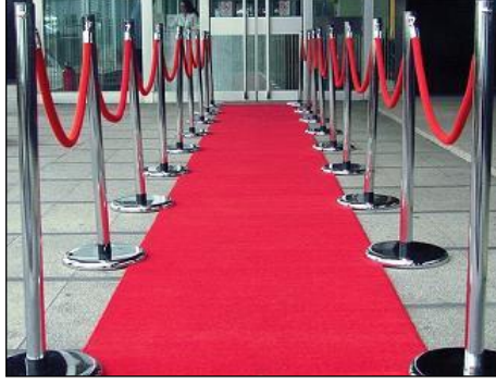
Resim 1.19: Kordon bariyerler

➤ Kokteyl alanı düzenlemesinde kullanılan malzemeler