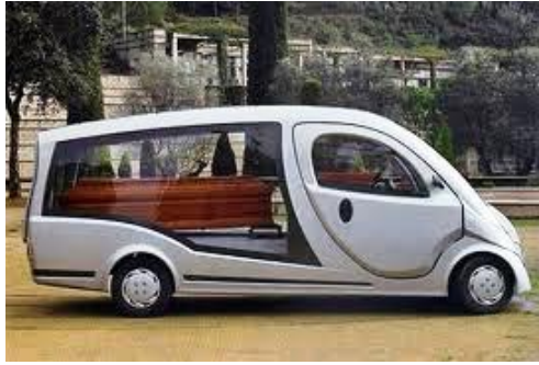
Resim 5.5: Özel olarak dizayn edilmiş araç

Katafalklar cam, ağaç ve metal gibi malzemelerden imal edilmektedir. Müşteri isteğine özel olarak imal edilen bazı katafalk tasarımları da bulunmaktadır.