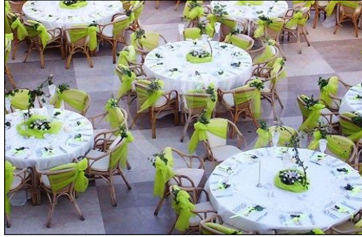
Resim 2.2: Yuvarlak masalar

Masalar açık alandaki kullanım amaçlarına göre değişiklik gösterir. Açık alanda kullanılan yemek masası, kokteyl masası, nikâh masası gibi konseptteki masaların farklı farklı dizaynı yapılır. Daha çok kare, yuvarlak, piknik masalar tercih edilir.