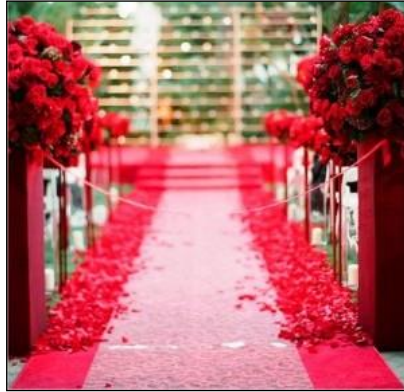
Resim 1.9: Kırmızı halı