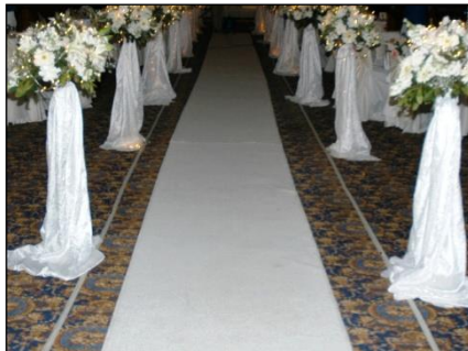
Resim 1.18: Beyaz halı