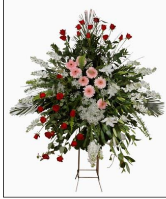
Resim 1.11: Ferforje