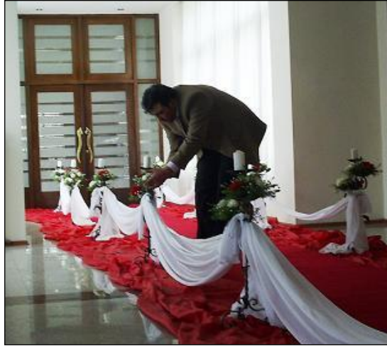
Resim 2.20: Kapalı alanda yol düzenlemesi

Kapalı alanda yol süslemesi, kullanım amacına göre değişir. Resmi davetler ve gala gecelerinde yollar kırmızı şeritlerle ve altın yıldızlı objelerle süslenir. Kullanılacak yolun uzunluğuna göre kırmızı halı serilir. Düğün davetlerinde ise yol kenarları daha gösterişli olması için canlı çiçekler ve mum dekorlarıyla süslenir. Özellikle düzenleme yapılan alan gelin yolu ise sütunlar ve canlı çiçeklerle donatılır.