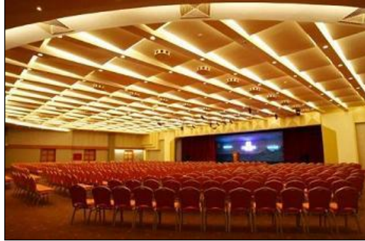
Resim 2.13: Kapalı alan

Kapalı alan süslemesi yapılırken, alanda bulunması gereken başlıca unsurlar masa, sandalye, yol, merdiven, kapı ve taktır.