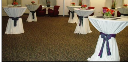
Resim 1.20: Bistro masalar