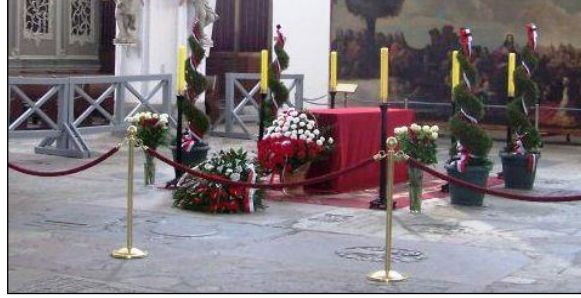
Resim 5.11: Süslemesi tamamlanmış katafalk

Katafalk süslemede çiçekler sprej olarak kullanılabilirdiği gibi, aranjman şeklinde de kullanılabilir.