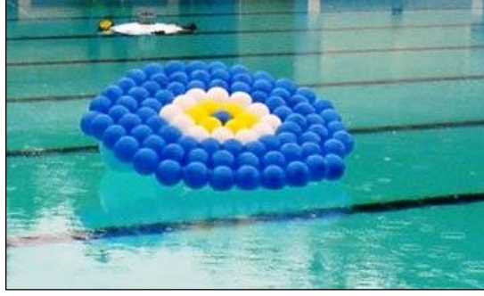
Resim 1.12: Havuz içinde balonlar