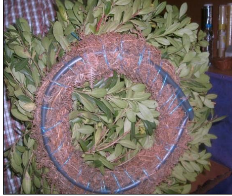
Resim 3.8: Anız ve kurutulmuş otlar

Anız veya kurutulmuş otlar iskelet malzemelerini süslemede kullanılmaktadır. Anız veya bazı kuru ot kalıntıları bir arada tellerle bağlanarak değişik şekiller oluşturulur. Bu amaçla daha çok eğrelti otları bir araya getirilip plastik boru etrafında telle veya iplerle sarılarak çiçek ve yeşilliklerin işlenebileceği zemin oluşturulur.