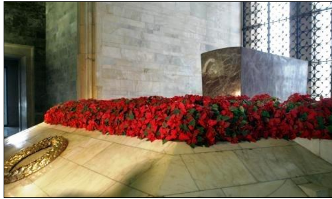
Resim 4.7: Anıtkabirde canlı çiçeklerle yapılmış süsleme

Anıt tasarımı yapılırken kullanılacak çiçekler özenle seçilmelidir. Çünkü çiçeklerin farklı anlamları bulunmaktadır. Anıtta yapılacak anma töreninin özelliğine göre çiçek seçimi yapılmalıdır. Örnek olarak beyaz karanfil temizlik ve saflığı, kırmızı karanfil sevgiyi, sarı karanfil hüznü, krizantem ölümü, liliüm masumiyeti, iris sadakat ve umudu, glayöl ilahi gücü ifade eden çiçekler olarak bilinir.