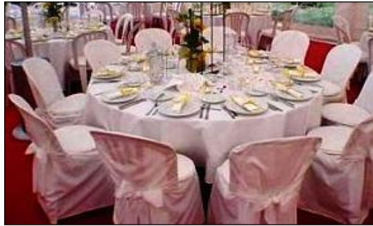
Resim 2.14: Masa düzenlemesi

Kapalı alanlarda masa süslemeleri kullanılan masanın konseptine göre değişir. Yemek masası, nikah masası, kokteyl masası vb. konseptteki masaların farklı farklı dizaynı yapılır.