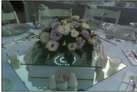
Resim 1.21: Masa üzeri dekoratif objeler