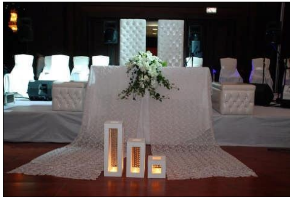
Resim 2.16: Nikah masası

Kapalı alanda nikah masası süslenirken dantel ve özel örtüler tercih edilmelidir. Lake nikah masalarında örtü kullanılmaz. Örtü yerine taşlar veya çiçeklerle süsleme yapılmalıdır. Mutlaka örtü kullanılmak isteniyorsa, masanın ayaklarını örtecek şekilde ve biraz da zemine dökümlü duracak şekilde düzenlenmelidir. Nikah masası üzerine canlı çiçek aranjmanı kullanılır. Bu aranjmanda düğün rengi olan beyaz renk tercih edilmelidir. Uzun nikah masalarında çiçek aranjmanı her iki uç ve cepheye gelecek şekilde yerleştirilir. Masaya tek aranjman konulacağı zaman masanın ön cephesinin ortasında veya uç kısmında dizayn edilir.