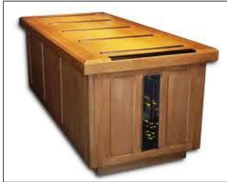
Resim 5.6: Ağaçtan yapılmış katafalk

Katafalklar cam, ağaç ve metal gibi malzemelerden imal edilmektedir. Müşteri isteğine özel olarak imal edilen bazı katafalk tasarımları da bulunmaktadır.