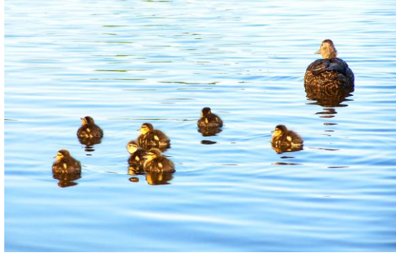
Resim 2.4: Okul öncesi dönemde üreme olayını hayvanlarla anlatmak kolaylık sağlar.

Küçük çocuklar geleceğe oyun yoluyla hazırlanırlar. Çocuğun ilk hayat deneylerini geliştirici, öğretici ve düşündürücü niteliği olan oyun araçları ile zenginleştirmek onların gelişimlerinde önemli rol oynar. Kavrama hızının en yüksek olduğu okul öncesi yıllarında çocukları düşündüren ve toplumsal olgunluğa erdiren cinsel gelişim alanını destekleyen uygun araç gereçlere önem vermek gerekir. Cinsiyet özelliklerini vurgulayan yap-bozlar, yine cinsiyet özelliklerini ayırt etme amacıyla kız ve erkek kıyafetlerinin yer aldığı araç gereçler ya da hayvanların yer aldığı üreme olayının anlatıldığı kitaplar vb. çocuğun cinsel gelişimi ve cinsel kimliğinin kazanımı açısından son derece önemlidir. Bu tür araç gereçler çocukların soru sormasına zemin hazırlayacak ve çocuk öğretmenin açıklamalarını dikkatle dinleyebilecektir.