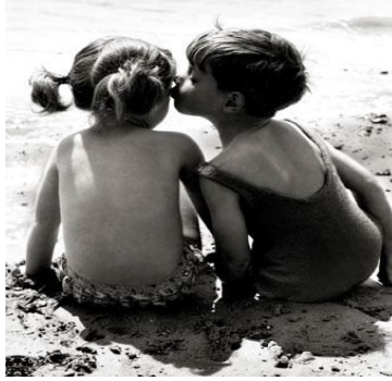
Resim 2.1: Cinsel gelişim, her dönemde farklılıklar gösterir.

Cinsel eğitim, çocuğun sorduğu soruların cevaplanmasından çok daha geniş bir kavram olduğu için doğumdan başlayarak ergenlik dönemine kadar, hatta yaşam boyu yapılan sürekli bir eğitim olarak kabul edilir. Cinsel eğitime başlamak için belli bir yaş bulunmamasına rağmen, genellikle cinsellikle ilgili soruların sorulmaya başladığı üç-dört yaşlarının cinsel eğitime başlamak için uygun olacağı düşünülmektedir.