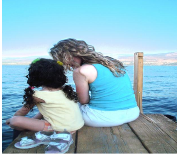
Resim 1.13: Her çocuk kendi cinsindeki ebeveynle özdeşim kurar.

Freud, daha çok oedipus kompleksi ile ilgilenmiştir. Gerek kız çocuğun gerekse erkek çocuğun ilk olarak anne ve babasıyla başlayan cinsel tercihleri süreç içinde kız çocuğun annesine benzeme, erkek çocuğun ise babasına benzeme çabalarıyla yön değiştirir. Çocuklar artık kendileri için rakip olan anne ve baba modelleriyle kurdukları özdeşimle onlar gibi olmayı deneyerek bu çatışmayı çözümlenmeye çalışırlar. Kız çocuk annesine benzeyerek babasının beğenisini kazanmaya, erkek çocuk da babasına benzeyerek annesinin beğenisini kazanmaya çalışır. Bu mücadele Freud'un kuramının temelini oluşturur.