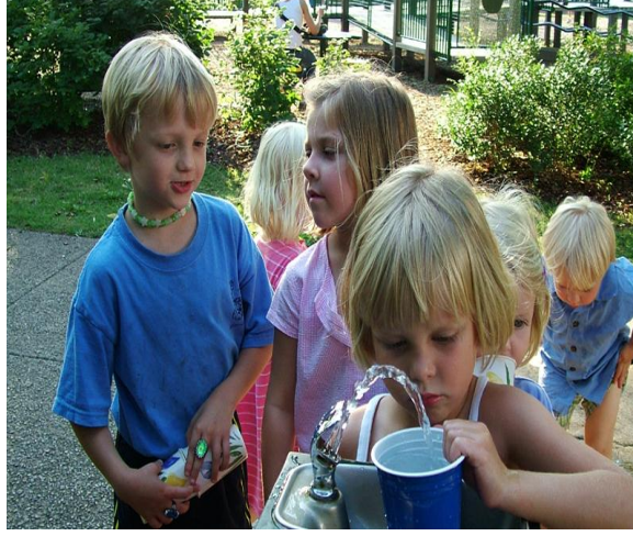
Resim 1.7: Evde kazanılan cinsel kimlikler çevrede pekişerek olgunlaşır.

Cinsel kimlik gelişiminde çocuk çevresindeki ağabey, abla, teyze, amca gibi örneklerden de etkilenmektedir. Oyunlarında aynı cinsten arkadaşlarının olumlu ya da olumsuz özelliklerini de benimserler. Kendi cinsel kişiliklerini onlarla karşılaştırır, erkek ve kız olarak yarışır.