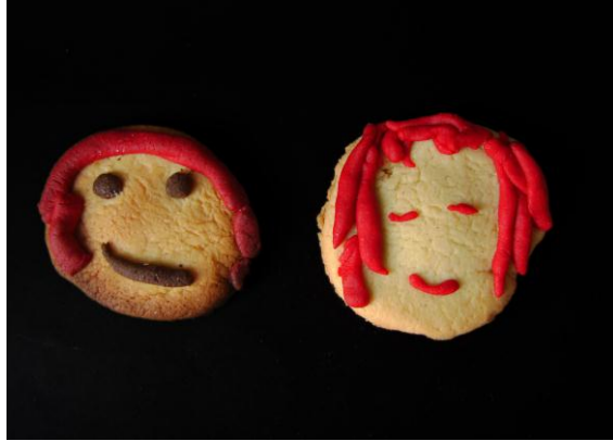
Resim 1.2: Her insanın doğuştan getirdiği erkek veya dişi bir cinsiyeti vardır.

Cinsellik: Eşeyli üremeye ilgili bedensel, ruhsal ve toplumsal deneyim, yaşantı ve ilişkiler bütünüdür. Cinsellik, kalıtsal olarak var olmakla birlikte toplumdan etkilenir. Cinselliğin kalıtsal yönü, insanın erkek ya da kız olarak doğmasına ve cinsel salgı bezlerine dayanır. Cinselliğin toplumsal etki boyutu ise insanın yaşadığı ortama, taklit etme yeteneğine bağlıdır. Kısaca cinsellik doğumla başlar, yaşam boyu devam eder ve bu yaşam sürecinde insanların cinsellik ile ilgili tutum ve düşünceleri aile, din, okul medya, arkadaşlar, sosyo-kültürel ve ekonomik düzeyden etkilenir.