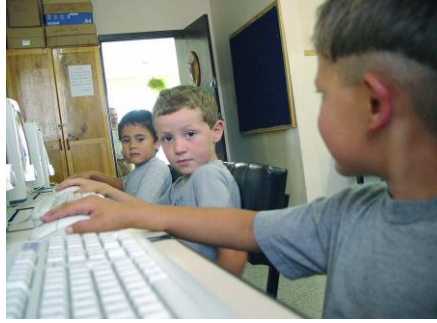
Resim 1.15: Latent dönemde çocuk toplumun geniş öğrenme olanaklarından yararlanır.

İlkokul dönemini kapsayan yedi-on bir yaş dönemi Freud'a göre latent dönem olarak adlandırılır. Bu dönemde çocuk önceki cinsel meraklarını ansızın unuttur. Ruhsal ve cinsel alanda daha önceki yıllarda yaşanmış olan çalkantılar ve çatışmalar yatıştır. Okula başlamayla, cinsel aktivitelerin azalması ve toplumsallaşma görülür. Toplumsal kurallar benimsenir. Bu dönemde anne-baba ve aile bireylerine, öğretmen ve akranlar eklenmiştir. Çocuk artık anne-babasının yanında başka kişilerle de özdeşim kurar.