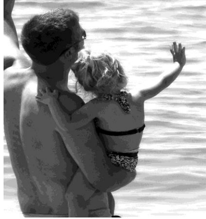
Resim 1.9: Oedipus kompleksi, farklı cinsteki ebeveyne karşı cinsel duyguların oluşmasıyla belirlenir.

Psikoanalitik teori: Freud, psikoanalitik (psikoseksüel) kuramın temsilcisi olarak çocuğun bazı gelişimsel aşamalardan geçerek kişiliğini şekillendirdiğini ve cinsel gelişimin de bu sürecin temelini oluşturduğunu savunmaktadır. Freud, insanlarda libido (cinsel dürtü) olarak tanımlanan içsel bir enerjinin olduğunu ve bu enerjinin vücutta dönemlere göre farklı yerlerde bulunduğunu belirtir. Freud, fallik dönemdeki anne-erkek çocuk ve baba-kız çocuk ilişkisinin oedipal ve eletra kompleksiyle çözümlenerek, kişilik gelişiminin şekillendiğini ve bu sürecin cinsel gelişime ait bir süreç olduğunu belirtmektedir.