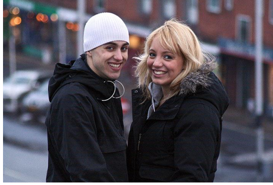
Resim 1.3: İnsan, cinsel olgunluğunun büyük bir kısmını gelişiminin ergenlik evresinde tamamlar.

Ergenlikte, büyüme olayı, tiroid hormonu, androjen ve östrojenin etkisi altındadır ve bu hormonların miktarlarında da artma olmaktadır. Temel değişiklik üremeyi sağlayan bezlerin çalışmaya başlaması ile sağlanır. Üreme organlarındaki büyüme ve gelişme yönünden iki cins arasında farklılık görülür. Kızlar, erkeklerden yaklaşık iki yıl önce bülüğ çağına girmeleri nedeniyle cinsel organların gelişmesi kızlarda daha erken tamamlanır.