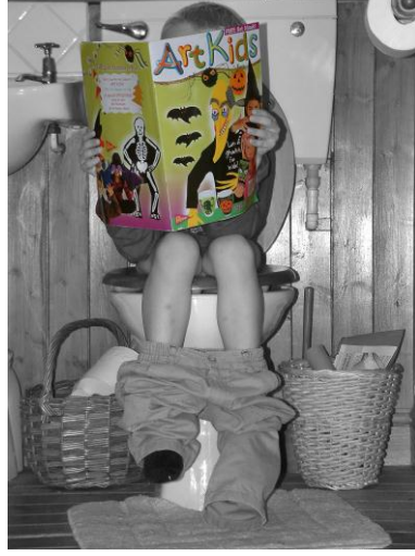
Resim 1.12: Çocuğa uygulanan tuvalet eğitimi, kişilik özelliklerinin kazanılması üzerinde etkili olabilmektedir.

tutum, çocuğun dışkısını tutmasına ve ileriki yaşamında inatçı, cimri ve yıkıcı kişilik özellikleri göstermesine neden olabilir.