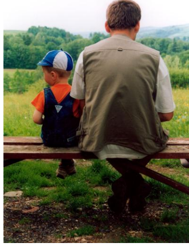
Resim 1.5: Bilişsel yaklaşıma göre çocuk cinsiyet rolünü cinsiyet gruplarının özelliklerini kavrayarak benimser.

Çocuk, üç-dört yaşında kişiliğini fark etmeye başlar. Meslekleri, kız ve erkek çocukları arasındaki farkı, çocukla yetişkin arasındaki ayrılıkları algılar. Üç yaşındaki bir çocuk hangi tür eşyaların hangi cinsiyet grubuna ait olduğunu bilir. Üç yaşındaki bir çocuk kız veya erkek olduğuna karar verebilir. Çocuk, çevresinde aynı cins birçok kişinin sergilediği pek çok özelliklerle karşılaşır. Cinsiyet rolünü benimseyebilmek için önce kendi kimliğinin farkına varır. Kız mı yoksa erkek mi olduğunu anlar. Erkek çocuğu diğer erkeklere benzeyen kendi fiziksel ve davranışsal yönlerini, kız çocuğu da diğer kızlara ve kadınlara benzeyen kendi fiziksel ve davranışsal yönleri algılar. Kız çocukları anneleri, erkek çocukları da babaları gibi davranmaya başlarlar. Taklit etme birinci derecede önemli değildir. Kız çocuğu annesini, erkek çocuğu babasını yeterli bulmadığı ya da beklentilerine cevap alamadığı zaman özdeşleşme durur.