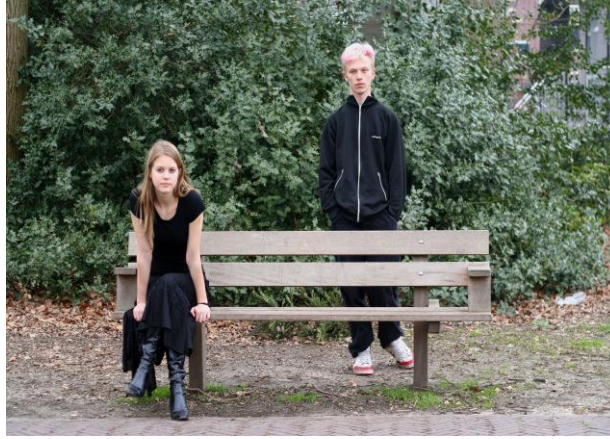
Resim 1.4: Erkeklerde ergenlik kız çocuklarına göre daha geç başlar, daha uzun sürer.