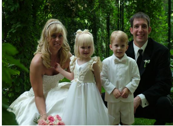
Resim 1.14:Freud'un kuramına göre ideal eş olarak kız çocuk babasını erkek çocuk ise annesini tercih eder.

Freud, daha çok oedipus kompleksi ile ilgilenmiştir. Gerek kız çocuğun gerekse erkek çocuğun ilk olarak anne ve babasıyla başlayan cinsel tercihleri süreç içinde kız çocuğun annesine benzeme, erkek çocuğun ise babasına benzeme çabalarıyla yön değiştirir. Çocuklar artık kendileri için rakip olan anne ve baba modelleriyle kurdukları özdeşimle onlar gibi olmayı deneyerek bu çatışmayı çözümlenmeye çalışırlar. Kız çocuk annesine benzeyerek babasının beğenisini kazanmaya, erkek çocuk da babasına benzeyerek annesinin beğenisini kazanmaya çalışır. Bu mücadele Freud'un kuramının temelini oluşturur.