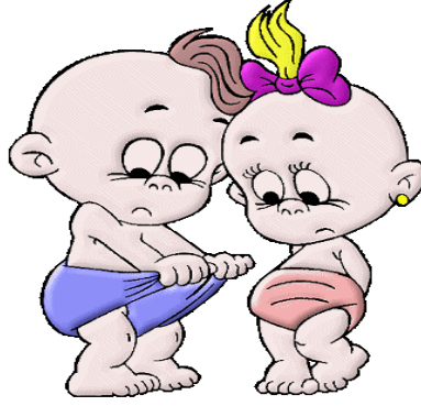
Resim 2.2:Çocuklar bedenleriyle çok ilgilidir.

ile ilgili soruların sorulduğu dikkati çeker. Kısaca çocuğun cinsel konulara karşı ilgisi, üç yaşlarında başlayarak beş-altı yaşlarına kadar oldukça güçlü bir meraka dönüşür. Özellikle de evde, komşuda bir çocuğun doğması, hayvanların yavrulaması, filmler, resimler, bu konuda yetişkinlerin ve arkadaşlarının konuşmaları, çocuğun genital organlarına karşı ilgisi ve bunlarla oynaması, karşıt cinsin kendinden ayrı olduğunu görmesi ve buna benzer durumlar çocuğun cinsel konulara karşı merakını yükselten kaynaklardır. Bunun yanında sorulara inandırıcı cevaplar verilmemesi, susturulmak istenmesi, çocuğun bu merakının artmasına neden olur.