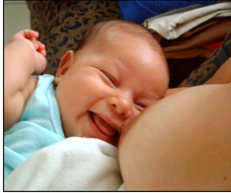
Resim 1.11: Bebek ile anne arasındaki sıcak ilişki, güven duygusunun gelişimini olumlu yönde etkiler.

Bu dönemde haz bölgesi ağızdır. Belli başlı davranış biçimi olarak emme, ya da içine alma gösterilebilir. Bebek bu dönemde etrafındaki uyarıcıları almaya çalışır. Bunu hem emme biçiminde hem de diğer duyu organlarıyla yapmaya çalışır. Örneğin, gözleriyle etrafında gördüklerini, kulaklarıyla duyduklarını içine almaya çalışır. Bu dönemin ikinci kısmında diş çıkarma ile birlikte ısırma davranışı görülmeye başlar. Bu dönem uygun geçirilmediği takdirde, ağızla ve içe almayla ilgili birtakım davranışlar sıklıkla görülebilir. Sigara içme bu davranışlara örnek olarak gösterilmektedir.