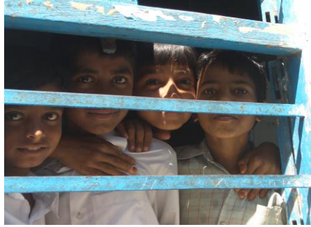
Resim 1.10: Süpereo, bireyi yanlış davranışlara girişmekten koruma işlevini görür.

Freud'a göre kişilik id, ego ve süpereo olmak üzere üç kısımdan oluşur. İd kişiliğin temel taşıdır. Doğuştan getirilir ve ruhsal enerjinin kaynağıdır. Aynı zamanda id, içgüdülerin de (libido ve saldırganlık) kaynağıdır. Ruhsal enerji içgüdüler şeklinde ortaya çıkar ve bir an önce doyurulmak ister. Ruhsal enerji doyurulma istemiyle içgüdü şeklinde ortaya çıkınca, ego devreye girer. Ego kişiliğin yürütme organıdır. İd'in istekleriyle dış dünyanın (süperegonun) eşleştirilmesi ile uğraşır. Ego gerektiğinde idin isteklerini ertelemeye, hoş yaşantıları seçmeye, hoş olmayanlardan uzak durmaya çalışır. Ego akılcıdır, mantıklıdır bir anlamda kişiliğin karar organıdır. Süpereo ise toplumsal ahlak kurallarını içerir. Süpereo bu anlamda vicdan demektir. Kişinin değer yargıları ve ahlak kuralları süperegonunda bulunur. Her zaman kafasına estiği gibi davranan ve toplumsal kuralları hiçe sayan kişilerde id baskındır, sürekli olarak ahlak kurallarını ve başkalarının ne diyeceğini dikkate alan, kurallara sıkı sıkıya bağlı kalan kişide süpereo baskındır; sürekli olarak akılcı davranmaya çalışan kişide ego baskındır.