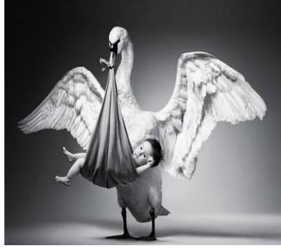
Resim 1.6: Ebeveynin çocuk yetiştirme tutumları çocukların cinsiyete özgü davranışlarını etkileyebilmektedir.

Annenin olmayışı ya da annenin kadınsı özellikler göstermeyişi de kız çocuk için benzer bir güçlük yaratmaktadır. Sevecen, yumuşak ve duygusal özellikler yerine sert tavırlı, erkeksi davranışları belirgin olan bir anne, kız çocuğuna uygun örnek olmayacaktır. Erkeksi özellikleri baskın olan bir anneyle özdeşim yapan bir kız çocuğu, halk arasında erkeksi davranışlar ve özellikler gösteren kadınlar için söylenen, “Erkek Fatma” gibi davranabilir.