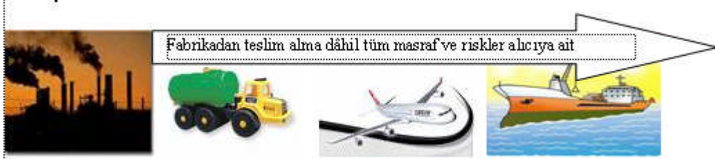
Resim 1.1: Satıcının yükümlülüğünün en az olduğu teslim şekli EXW' dir.

Bu teslim şeklinde satıcı malları, sözleşmede belirtilen tarihte alıcıya veya onun emrine teslim etmek üzere işletmesinde hazır bulundurur. Alıcı malları işletmeden teslim alarak ihracı için gerekli belgeleri hazırlar gümrük işlemlerini tamamlayarak malları kendi ülkesine ithal eder. Malların işletmede teslim edilmesinden itibaren malla ilgili bütün masraf ve risk ile diğer yükümlülükler alıcı tarafından karşılanır. Örneğin, sözleşmede "EXW, Nisa Tekstil AŞ, Ankara, TURKEY" şeklinde yer alan ibare; satıcının Ankara'daki fabrikasında malları, satıcıya teslim etmesiyle sorumluluğunun biteceği anlamına gelir.