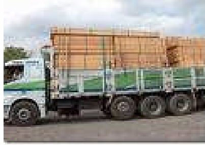
Resim 2.4: Kara yolu taşımacılığı

Bir kamyonun bir günde katedebileceği ortalama yol CMR Konvansiyonunda 450 km olarak belirlenmiştir.