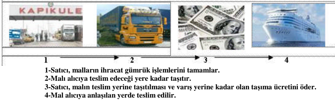
Resim 1.7: CPT (taşıma....'e kadar ödenmiş olarak) teslim şekli

Bu terimi izleyen yer ismi, teslim işleminin yapılacağı yeri ifade etmez. Ama hangi noktaya kadar navlun ve taşıma masrafların satıcı tarafından ödendiğini ortaya koyar. Örneğin, “CPT, Hamburg, Germany” şeklindeki ibare, malların Almanya'nın Hamburg şehrine kadar olan taşıma giderlerinin satıcı tarafından ödendiği anlamına gelir.