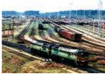
Resim 2.5: Demiryolu taşımacılığı

Avrupa’da demir yolu taşımacılığı gerilerken, ABD’de sanayinin ihtiyaçlarına cevap verebilen demir yollarının taşımacılıktaki payı artmıştır. ABD’deki demir yolları ile yük taşıma oranının yüzde 40 olması demiryollarının öneminin azalmasının kaçınılmaz bir son olmadığını göstermektedir.