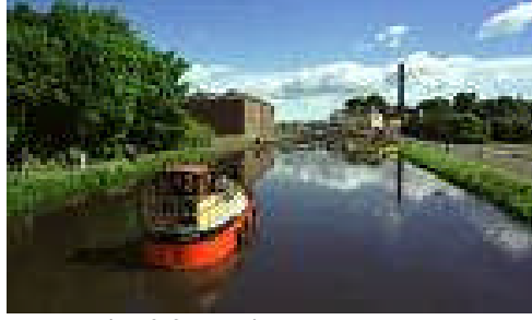
Resim 2.3: Nehir yolu taşımacılığı