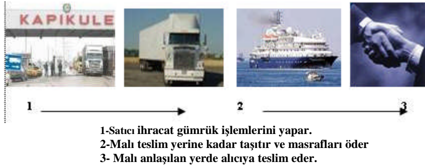
Resim 1.2: FCA (belirlenen yerde teslim) teslim şekli

Örneğin, sözleşmede “FCA, Türk Hava Yolları, Atatürk Hava Limanı” şeklinde yer alan ibare; satıcının malları Atatürk Hava Limanında, Türk Hava Yolları uçağına ihraç gümrük vergileri ödenmiş olarak teslim etmesi gerektiği anlamına gelir.