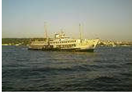
Resim 2.2: Deniz yolu taşımacılığı

Deniz yoluyla bir defada en çok yük, en güvenli şekilde, en ucuza taşınmaktadır. Ülkeler arası sınır aşımı problemi yoktur. Amerika'dan alınan bir mal sınır aşmadan doğrudan ülkemize gelir, ülkemizden ihraç edilen mal sınır aşmadan doğrudan Hollanda'ya gider.