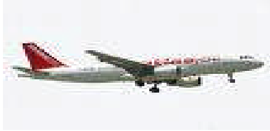
Resim 2.1: Hava yolu taşımacılığı

Alternatif nakliye şekilleri arasında en pahalı olanı hava yolu taşımacılığıdır. Hava yolu ile gönderilecek bir malın ne zaman gönderilen yere ulaşacağı, uluslararası Hava Taşımacılığı Birliğinin yayımladığı tarifelere bakılarak belirlenir.