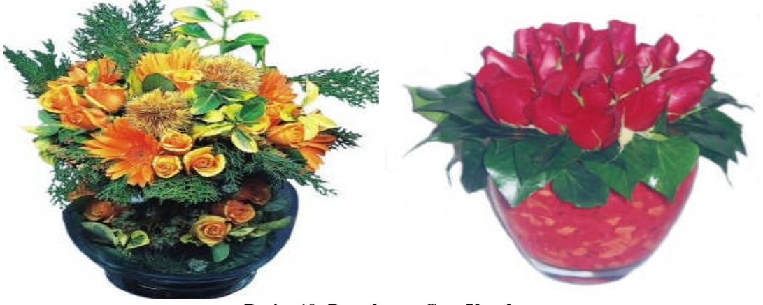
Resim 19: Porselen ve Cam Vazolar

Canlı veya cansız çiçekleri bir araya koymak için kullanılan farklı farklı büyüklükte, renkte, ölçüde, şekilde, desende olan cam, porselen, metal, toprak, pirinç gibi malzemelerden yapılan kaplardır (Resim 19).