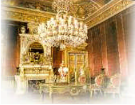
Resim 1: Osmanlı dönemi saray dekorasyonu