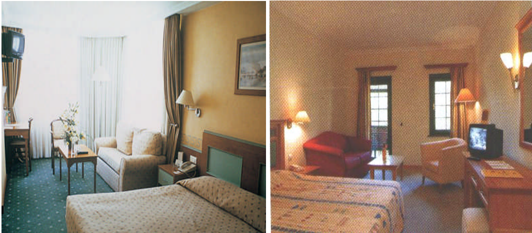
Resim 7: Güneş gören ve görmeyen odalarda renk seçim örnekleri