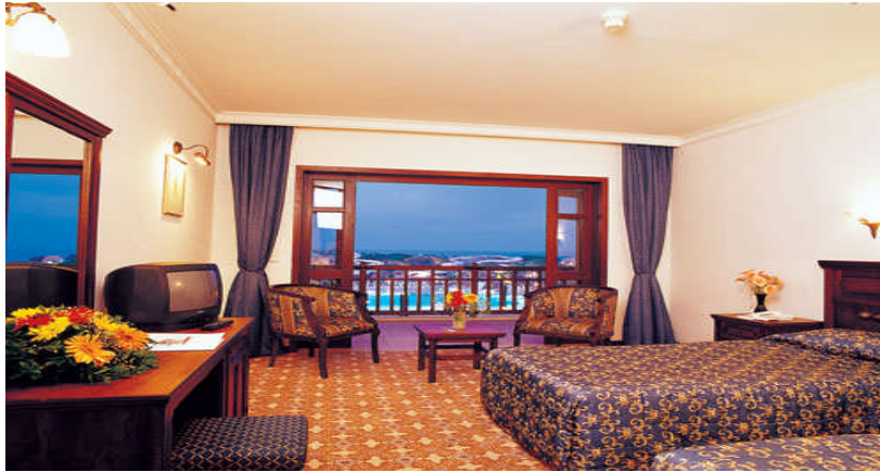
Resim 15: Halıların alandaki eşyalara göre kullanımı.

Desenli halılar genelde sabit değildir. Desensiz düz halılar ise daha çok duvardan duvara olan halılardır. Bu durum her zaman geçerli değildir. Tercihe bağlıdır (Resim 15).