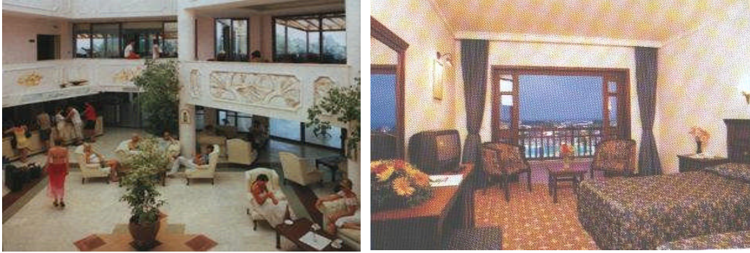
Resim 17: Yapay çiçeklerin oturma salonları ve yatak odalarında kullanımı

Yapay çiçekler, özel olarak hazırlanmış saksılara dizayn edilebileceği gibi dekoratif sepet veya otelin sabit hazırlanmış yerlerine de konulabilir. Büyük boyuttaki ağaç halinde olanların yaprakları, özel kumaştan yapay olarak, gövdeleri ise doğal ağaçtan yapılabilir. Büyük boydakiler geniş salon ve lobilerde saksılara yerleştirilmiş; kısa boylu olanlar, katlarda merdiven başlarında vb. yerlerde; vazoya yerleştirilmiş olanlarda, otel odalarında ve salonlarda kullanılabilir. Çiçeğin seçimi kullanılacak yer göz önünde bulundurularak yapılmalıdır (Resim 17).