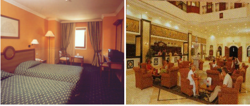
Resim 6: Alanların kullanım özelliğine göre renk düzenleme örnekleri