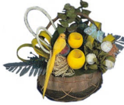
Resim 21: Değişik fon malzemelerinin kullanılışı