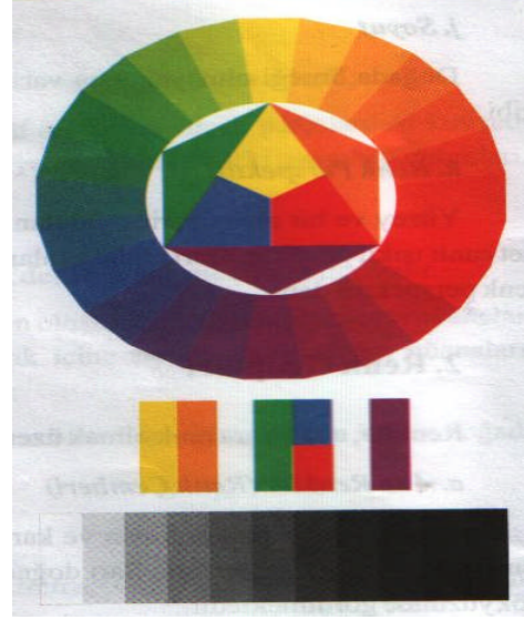
Resim 4: Renk Cetveli (Çemberi)