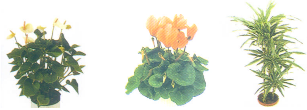
Resim 16: Çeşitli saksı bitkileri

Otelin iç mekânlarında kullanılan yapay çiçekler, doğal çiçeklere göre daha uzun ömürlü ve bakımı kolaydır. Yapay çiçekler, daha uzun ömürlü ve bakımı kolay olsa da canlı olan saksı bitkilerinin yerini tutmaz. Saksı bitkilerinin kendine has doğal bir kokusunun ve renginin olduğu unutulmamalıdır (Resim 16).