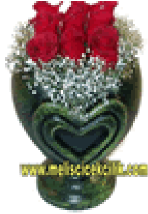
Şekil 22: Çiçeklerde denge düzenlemesi