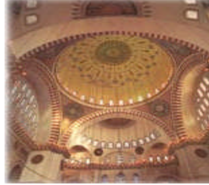
Resim 2: Osmanlı dönemi cami süslemesi