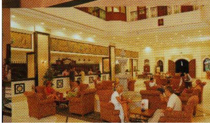
Resim 14: Perdelerin lobi ve salonlarda kullanımı.

Halılar, otelin en değerli ve pahalı eşyalarından biridir. Rengi ve kalitesi iyi seçilmiş halılarla döşenmiş alanlar göz alıcı, ilgi çekici hale geldiği gibi insanlara rahatlık ve ferahlık da verir. Otellerde halılar, gürültüyü önlemek ve süslemek amacıyla kullanılır. Yatak odalarında sıcak renklerdeki desenli ve desensiz yumuşak halılar; yemek odası, oturma odası ve bunun gibi salonlarda temizlik ve ferahlık hissi veren halılar; lobilerde, koridorlarda, merdivenlerde ve bunun gibi yerlerde gürültüyü azaltmak için kırmızı, turuncu gibi canlılık hissi veren sıcak renkteki halılar, kullanılabilir.