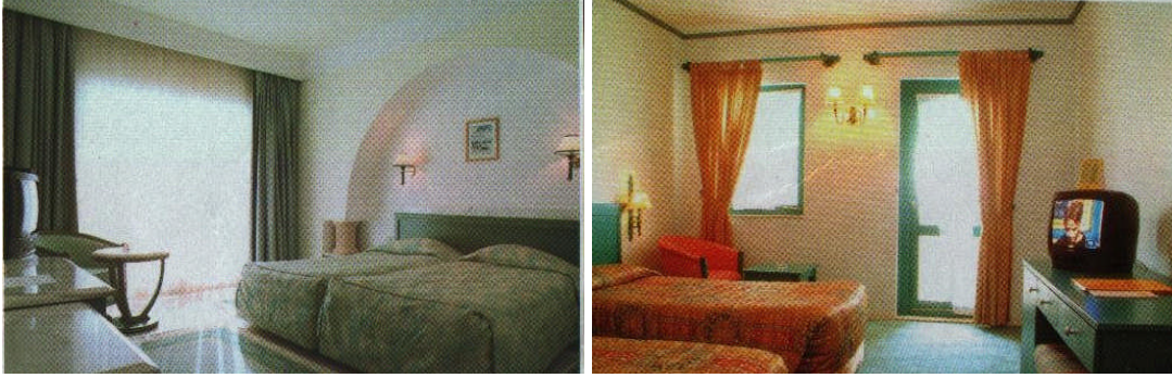
Resim 5: Yeşil ve turuncu renklerle döşenmiş odalar

Kırmızı, sarı, turuncu olan sıcak renkler kullanıldığı alanı, büyük ve yakın gösterir. Mavi, yeşil, mor olan soğuk renkler buldukları alanı ve cisimleri daha küçük ve daha uzak bir etki bırakır (Resim 5).