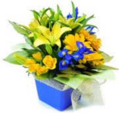
Resim 24: Renk uyumu