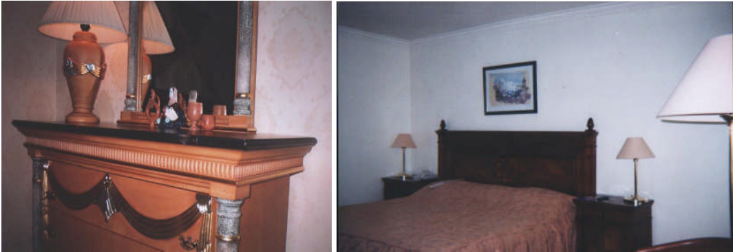
Resim 11: Alandaki eşyaların birbirini tamamlamasına örnekler

Bazen var olan temel eşyalar kullanılarak, yeni bir düzenleme yapılması gerekebilir. Bu durumda alınacak yeni materyaller diğerleri ile renk, ölçü ve stil bakımından uyum içerisinde olmalıdır.