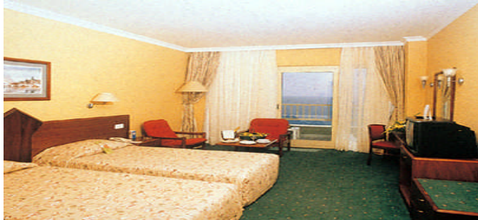
Resim 9: Zıt renklerin kullanımı

Zıt renkli eşyalar, odanın içine dikkatle dağıtılmalıdır. Bütün zıt renkli eşyaların bir tarafa yerleştirilmesi durumunda, odanın bir tarafı ağır çekiliyormuş gibi görünüm kazanmasına neden olur. Zıt renkler, odaya ahenkli şekilde dağıtılsa, gözün birinden diğerine geçişte takılmalar önlenir. Hiçbir zaman zıt renkler aşırı şekilde kullanılmamalıdır. Çok güzel olan bir şeyin bile fazlası insanı yorar. Bazı renkler fazla çekici olabilir. Bu da renge hassas olan insanları asabileştirir. Bazı kimselerin nasıl kapalı yerde durma fobisi varsa, bazılarının da renk kompleksi vardır. Renklerin insan psikolojisi üzerinde olumlu ve olumsuz etkileri olacağından dolayı aşırılıktan daima kaçınılmalıdır (Resim 9).