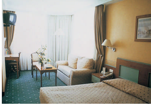
Resim 10: Dar ve geniş odada mobilya düzenlemesi örnekleri