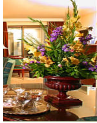
Resim 25: Zıt renkler.