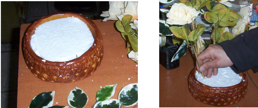
Resim 20: Strafor köpük

Strafor Köpük: Çiçek kaplarının içine konulan yapay çiçekleri ve yapraklarını sabit olarak tutan bir malzemedir (Resim 20).