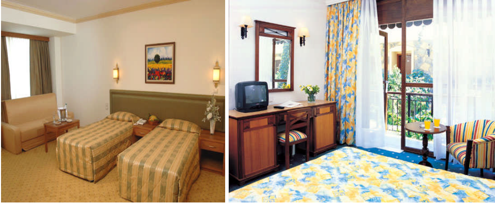
Resim 8: Büyük ve küçük odaların renklerle düzenlenmesi

Odaların tavan yükseklikleri de unutulmamalıdır. Tavanlar genellikle duvardan üç ton daha açık boyanmış olarak gözümüze çarpar. Bu genelde çok uygulanır. Tavan, duvarlarla aynı renkte boyanabileceği gibi zıt bir renkle de boyanabilir. Örneğin; yeşil veya soluk yeşil, bej ve kahverengi gibi doğa renkleri arasında düzenlenen bir odada açık mavi bir tavan insanlara gök hissini verecektir.