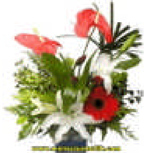
Şekil 23: Asimetrik ve simetrik çiçek düzenlemesi