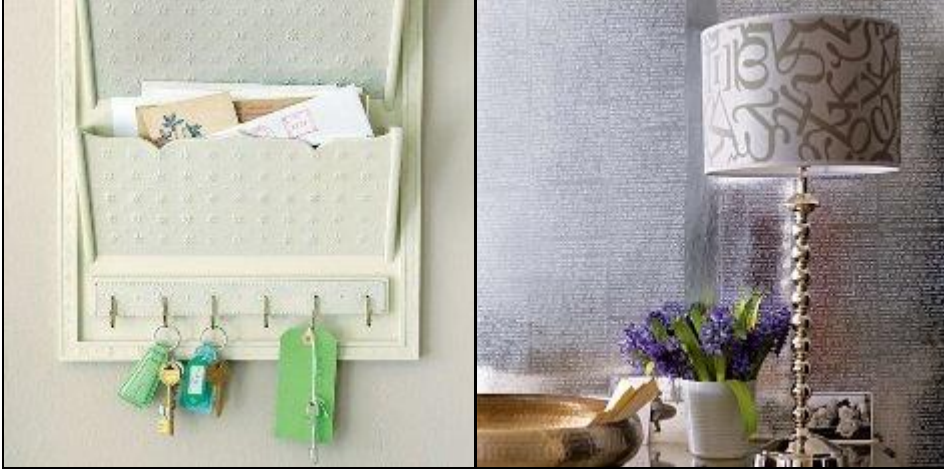
Resim 2.17: Antre için dekoratif ve fonksiyonel aksesuarlar

Askılıklarda ayaklı askılıklar dekoratif ve fonksiyonel görünecektir. Aksesuar olarak duvara monte edilebilen askılıklar da kullanılabilir. Askılara her yerde ihtiyaç duyulabilir. Mutfak, banyo, yatak odası, teras, balkon, giriş, dolap içlerinde ve hatta iş yerlerinde bile askılar günlük hayata oldukça faydalı olabilir. Askıların küçük fakat çok gerekli eşyalar olduklarını söylemek yanlış olmaz. Bu özelliklerinden dolayı dekorasyona uyum sağlamalı ve şık görünmelidir.