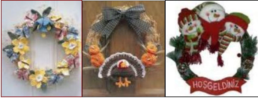
Resim 1.13: Çeşitli kapı süsleri

Giriş kapısı önemlidir. Eve gelen misafirlerin karşılandığı ilk yer kapılardır. Kapının çarpıcı bir renge boyanarak ya da farklı bir kapı kolu kullanarak ya da güzel bir kapı süsü ile çekici bir hâle getirilmesi mümkündür. İlk izlenim çok önemlidir. Kapı dekorasyonundaki ayrıntı bireylerin evlerinin karakterlerini yansıtır.