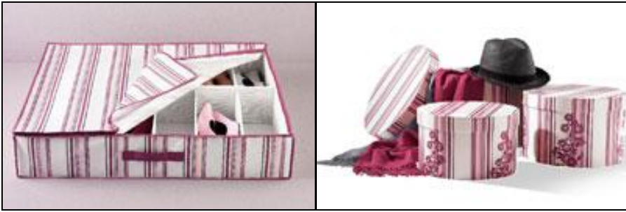
Resim 1.10: Fonksiyonel aynı zamanda dekoratif kutular

Birkaç çiftten fazla ayakkabı alabilen bu pratik düzenleyiciler ayakkabıların yıpranmadan saklanmasına olanak sağlarlar. Çıkabilen ayraç duvarlar cırt bantlarla sabitlenir. Fermuarlı ve saplı tipleri vardır. Yıkabilir özelliklere sahip ve çeşitli renklerde üretilmektedir.