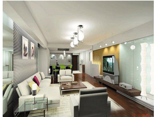
Resim1.12: Aksesuarların kullanıldığı bölümler