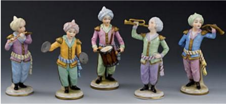
Resim 2.5: Biblolar