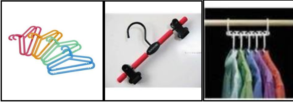
Resim 1.8: Gömlek, pantolon ve etek askıları

Dört etek birden aynı askıya asılabilir. Bu sayede hem dolaplar ferahlar, hem de aranılan etek anında bulunur. Masif kayın ağacı ve kromlu metalden askıya sahip. Lastik ile kaplı mandallar kaydırmaz ve kumaşı yıpratmama özellikleri vardır.