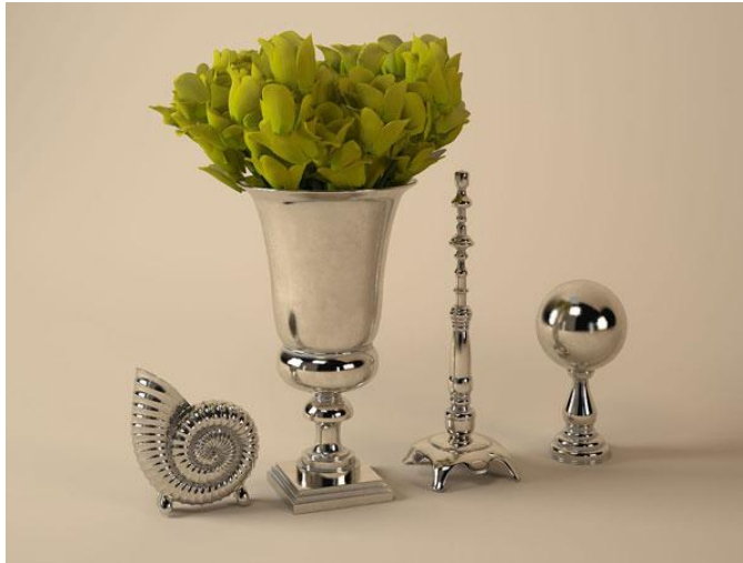
Resim 1.5: Gümüş aksesuarlar

Porselenler kadar gümüş eşyaların da kullanılma eğilimi vardır. Gümüş yalnızca çatal, kaşık ve bıçakların yapımında kullanılmaz. Ancak son yıllarda bunların yerini paslanmaz çelikten yapılmış olanlar almıştır. Gümüş eşyaların maliyetinin yüksek ve bakımının zor olması sahip olmayı engelleyen faktörlerdir. Ancak maliyetin doğası gereği evde farklı güzellikler ortaya çıkarır. Çoğunlukla yemek masasında kullanılır. Gümüş eşyalara dikkatle yerleştirilen çizgiler, sofraya zarif bir hava verir.