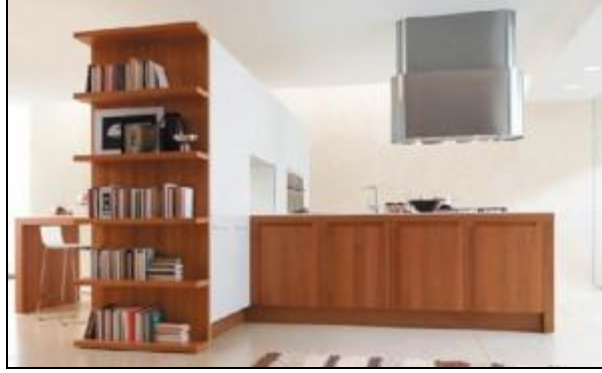
Resim 2.15: Kitapla ruh kazanan mutfak örneđi