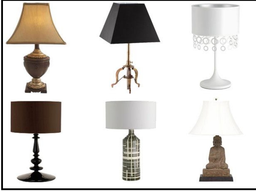
Resim 1.1: Abajur örnekleri