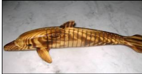
Resim 1.23: El yapımı hayvan figürü