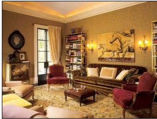
Resim 1.20: Viktoryen tarzı tasarım

Bu sebepten dolayı bireyler öncelikle ne tür bir dekorasyon tarzından hoşlandıklarına karar vermelidirler. Örneğin modern bir dekorasyondan hoşlanıyorlarsa mümkün olduğunca sade ve yalın aksesuarlar seçip bunları düzenli yerleştirebilirler; fakat Viktoryen tarzı, göz dolduran, çoğunluğu antikalardan ve görkemli objelerden oluşan aksesuarları gruplayarak ya da oraya buraya serpiştirerek kullanmalıdırlar. Dekorasyon etnik, otantik ya da egzotik gibi herhangi bir tarzla sınırlandırmak istenmiyorsa, aksesuar seçerken yalnızca birey için değerli ve bir anlamı olan objeler seçilmelidir. Buna, bireyde güzel duygular uyandıracak, çocukluk ya da tatil anılarını anımsatacak objeler de dahil edilebilir.