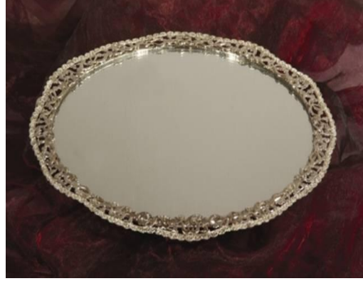
Resim 2.13: Dekoratif ve fonksiyonel tepsiler