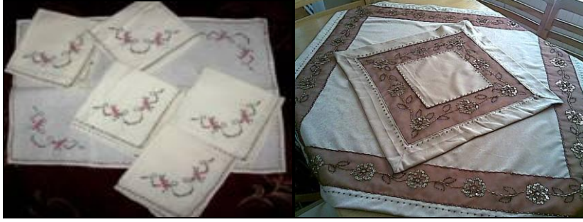
Resim 2.10: İşlemeli örtü çeşitleri