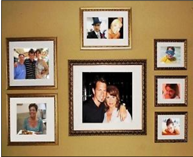
Resim 2.2: Benzer renklerden seçilmiş fotoğraf çerçeveleri

Fotoğraflar grup hâlinde sergilenirken çerçeve renklerini aynı renkten seçmek aksesuar görünümünde bütünlük sağlar.