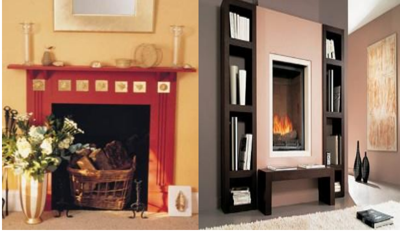
Resim 1.24: Değişik aksesuar yerleşimlerinin yapıldığı şömineler ve rafları