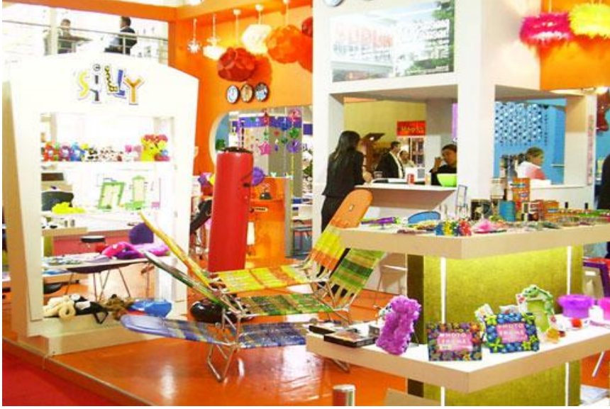
Resim 2.4: Hediyelik aksesuarlar