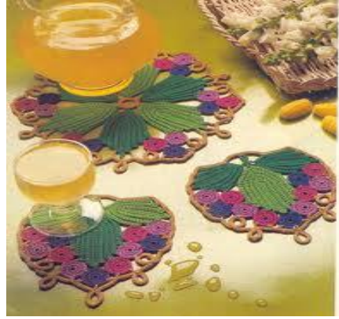
Resim 2.12: Mutfak Aksesuarları

Her mutfağın 'olmazsa olmaz' aksesuarlarının başında tepsiler gelir. Servise ve sunuma özen gösterenler için ise ayrı bir anlam taşır. Sade ve klasik modellerinin yanı sıra, sıra dışı özel tasarımlarıyla da dikkat çeken tepsiler, malzemeleriyle de çok farklılıklar gösterir. Ahşap, hasır, çelik ve gümüşten yapılan tepsiler, fonksiyonel modelleriyle sıkça kullanılmaktadır. Koltuk kenarına monte edilenler veya masa üzerine konulup tekerlekleri sayesinde servis kolaylığı sağlayan tipleri de bulunmaktadır.