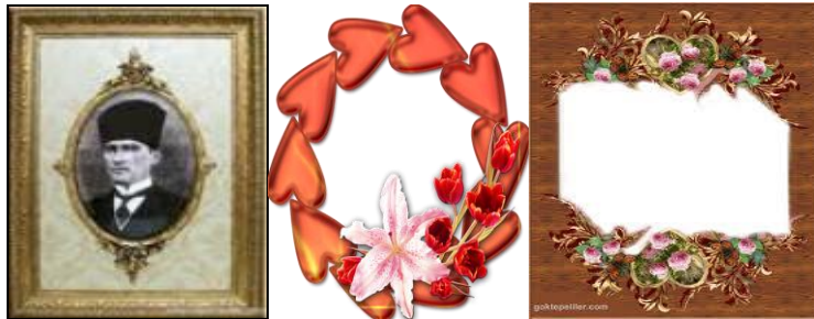
Resim 2.8: Resim çerçeveleri

Bireylerin sevdikleri şeylerin resimleri sergileyebilecekleri aksesuarlardandır. Çok çeşitli şekillerde ve renklerde olanları mevcuttur. Renk ve çerçeve şeklini belirlerken evdeki dekorasyon göz önünde bulundurulmalıdır.