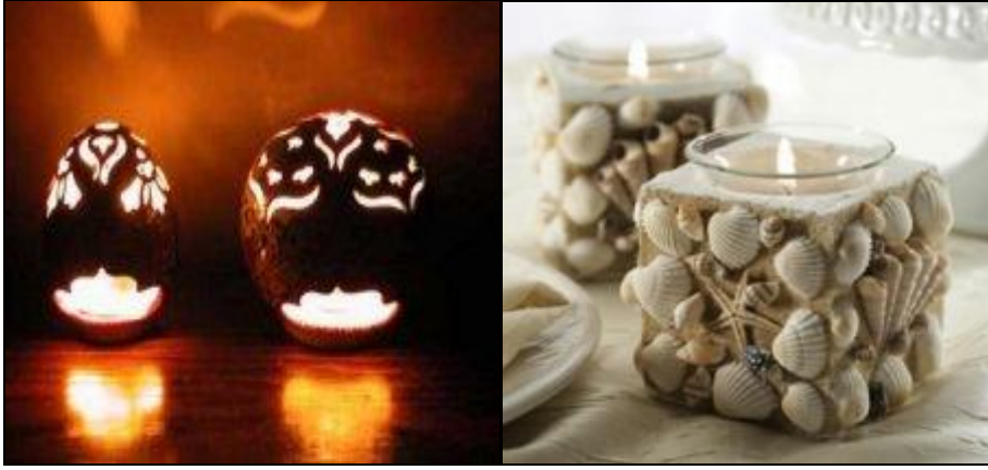
Resim 2.19: Dekoratif şamdanlar ve mumlar

Son yıllarda şamdanlar ve mumlar da banyolarda kullanılan aksesuarlar arasında yerini almıştır.