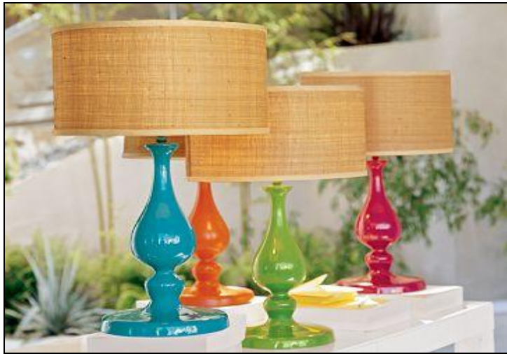
Resim 1.16: Huzurlu bir aydınlatma için abajurlar