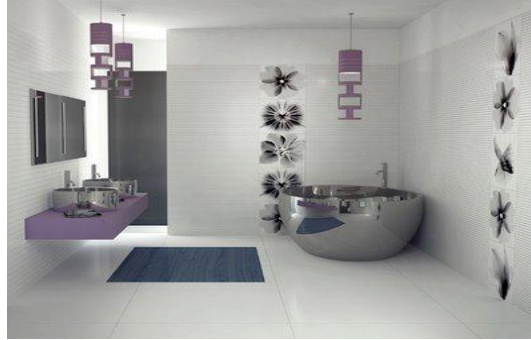
Resim 1.7: Banyo aksesuarlar

Fonksiyonel banyo aksesuarları, havlular, duş perdeleri, sepetler ve banyo paspaslarıdır. Bu objeler ortama sıcak bir görünüm verirler. Ancak, banyoda kullanılan aksesuarların buhar ve suya çok fazla maruz kalmaları nedeni ile dokumaların solmayan cinsten olması göz önünde bulundurulmalıdır.