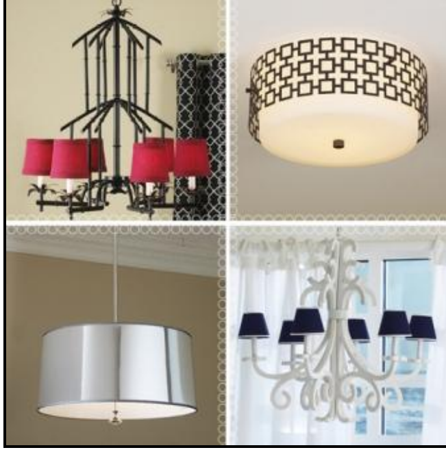
Resim 1.15: Tavan aydınlatma aksesuarları

Mekânların özelliklerine göre aydınlatma ölçütleri (kriterleri) değişmektedir. Ev için düzenlenen bir aydınlatma sisteminde her odanın farklı ihtiyaçları göz önüne alınmalıdır. Bu konuda uzman kişilerden ve markalardan yararlanmak doğru olur.