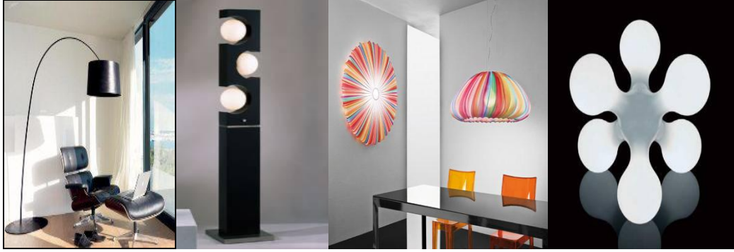
Resim 2.7: Çeşitli aydınlatma aksesuarları

Aydınlatma, dekorasyonun tamamlanması ya da odanın dekorasyonun dışarı yansımaları bakımından oldukça önemlidir. Şık bir aydınlatma aksesuarı ile odanın, salonun dekorasyonunu tavandan, duvardan ya da ayaklı abajurlar ile tamamlamak mümkündür. Aksesuarların rengini salonun duvar renklerine göre ve mobilyaların tarzına uygun seçmek önemlidir.