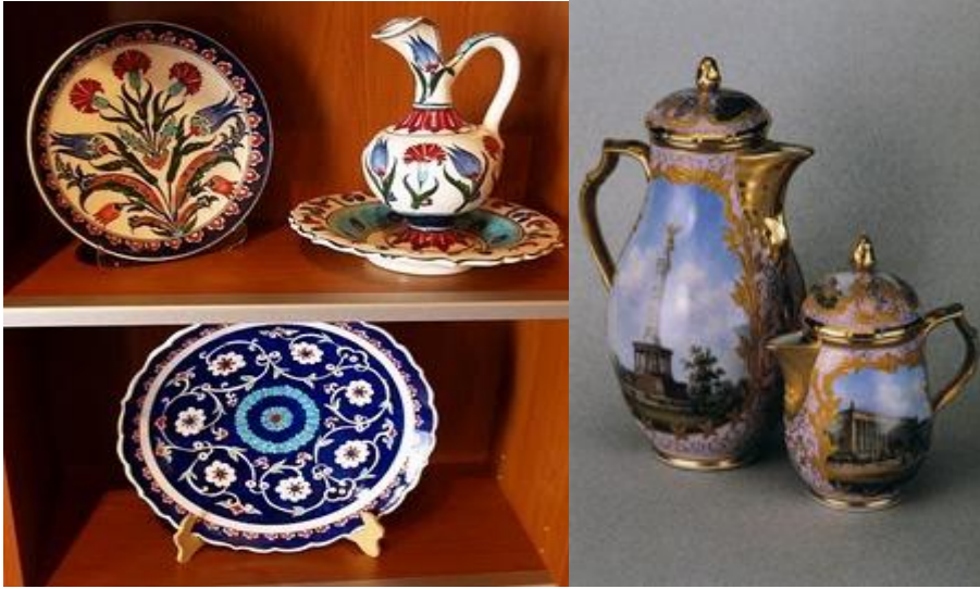
Resim 1.26: Nişlerde sergilenebilen değerli porselenler