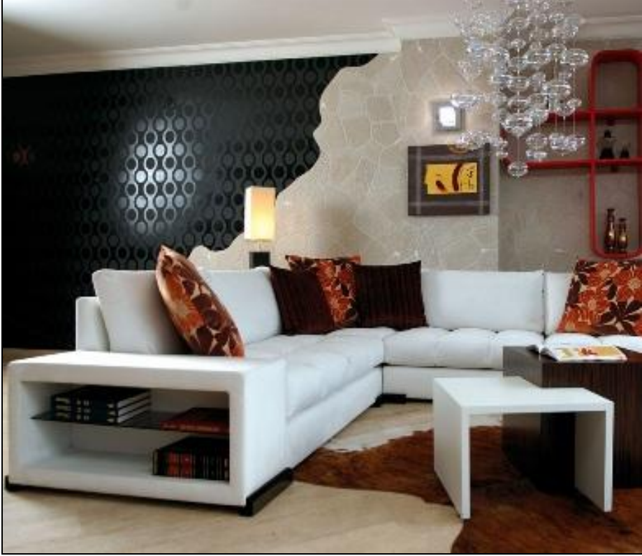
Resim 2.3: Çeşitli aksesuarların kullanıldığı bir yaşam alanı

Boş kalan köşeler, tercihen içinde canlı bitkilerin olduğu bir saksıyla, çeşitli boyutlardaki çerçevelerle ya da bir sandalye ile doldurulabilir. Bu durumda seçilecek aksesuarların ebatlarının mekânla uyumlu olmasına dikkat etmek gerekir.