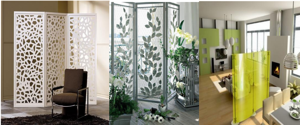
Resim 1.2: Paravan örnekleri

Bunlar özellikle çok amaçlı ve açık planlanmış mekânlarda alanları bölmek için kullanılırlar. Rahat hareket edebilir olması istenen bir özelliktir. İpek, cam, goblen, plastik gibi materyallerden yapılabilirler.