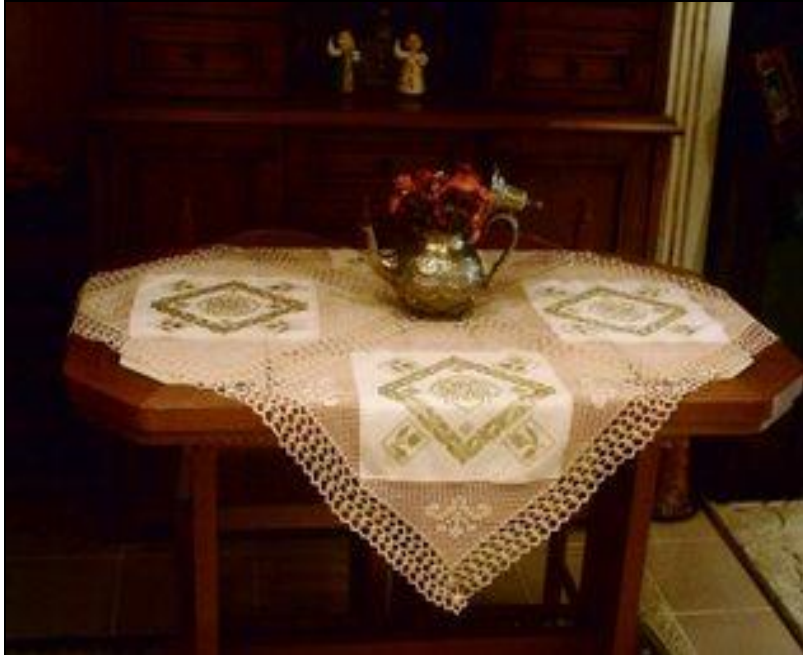
Resim 2.9: Geçmişten günümüze işlemeli masa örtüleri

Yemek odasında güzel, zevkli ve düzenli bir yemek ortamı insana huzur verdiği gibi yaşama düzeni ve görgüyü ortaya koyar. Bu nedenle el dokumaları pamuk, keten ve çeşitli dokumalardan basit nakış iğneleri, kanaviçe, goblen, Çin iğnesi, beyaz iş ve ajur teknikleri ve çiçek motifleri ile işlenen sofrta takımları hazırlanmaktadır. Bu örtüler günlük ve özel günlerde kullanılmak üzere değişik kumaş ve işleme teknikleriyle farklı ihtiyaçları karşılamaktadır.