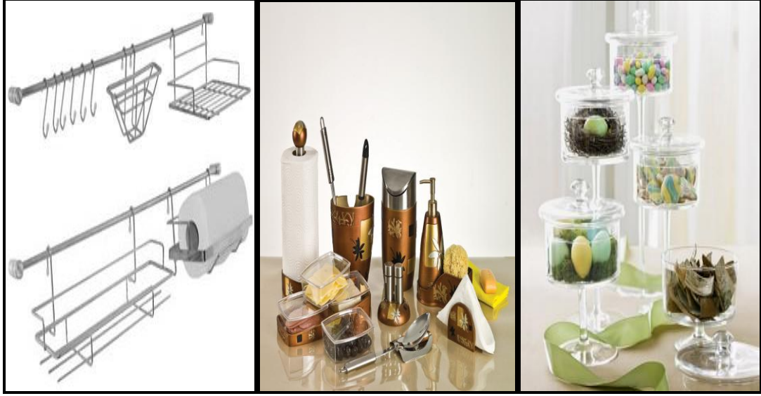
Resim 1.18: Mutfak aksesuarlarından bazıları