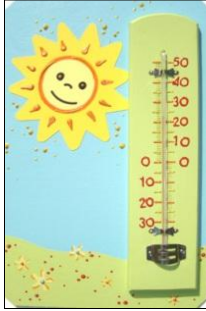
Resim 2.21: Bebek odalarının en önemli aksesuarı