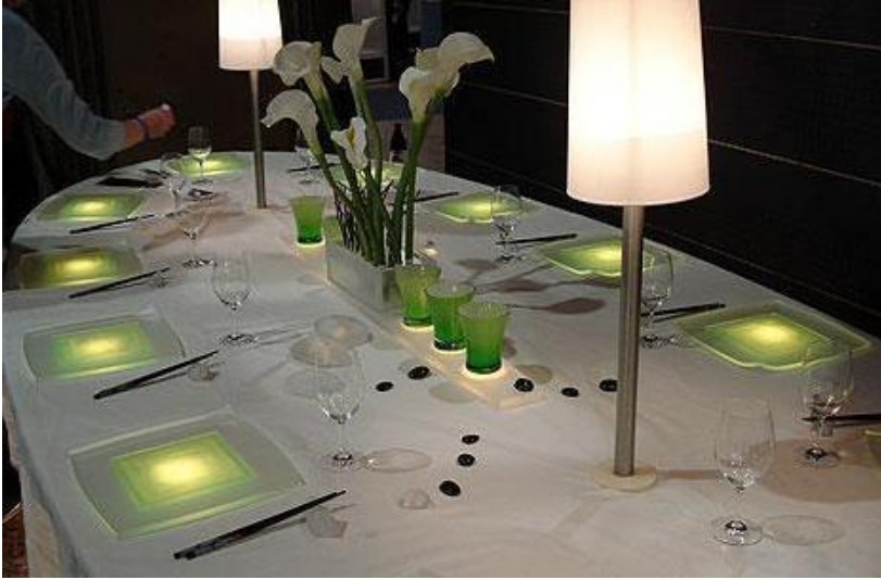
Resim 1.3: Sofra takım

Yemek yeme faaliyeti insan mutluluğu ve sağlığını etkiler. Aile ve arkadaşlarla yemek yeme zevkli bir olaydır. Birçok faktör bu zevki zenginleştirir. Hane halkının tercih ettiği servis yöntemi ve yiyeceklerin çeşidi sofrta takımlarının seçiminde etkilidir. Masa örtüleri gibi, hane halkının beslenme biçimi, servis yöntemleri, hazır ve planlanmış yemek ve depolama alanları, mobilyalar ve yaşam biçimi sofrta takımının seçiminde etkilidir. Çeşitli yemekler için aynı yemek takımının kullanılıp kullanılmayacağı, yemek takımının seçiminde dikkate alınmalıdır. Piyasada mevcut yeni lifler ve dokumalar, kolaylıkla temizlenebilen plastikler, güçlü veya az algılanan renklere sahip masa örtüleri bu amaçla kullanılabilir. Buna ek olarak, masa takımlarını oluşturan, serviste kullanılan küçük aksesuarlar da mevcuttur. Bunlar masanın merkezine yerleştirilen tuzluk ve biberlik, şamdanlar, peçetelikler gibi aksesuarlardır. Bunların hepsi bütünlük sağlamak açısından aynı materyalden yapılmış olmalıdır. Çiçekler veya yapraklar, canlı veya kuru bitkiler, meyve ve sebzeler, taş ve kabuklar, bir veya iki parça heykel veya bir mum grubu da masayı geçici olarak canlandırabilir. Dizayn ve ölçü düzenlemenin dinlendirici olması ile ilintili olduğu gibi odanın ve masanın büyüklüğü de düzenlemede oldukça önemlidir.