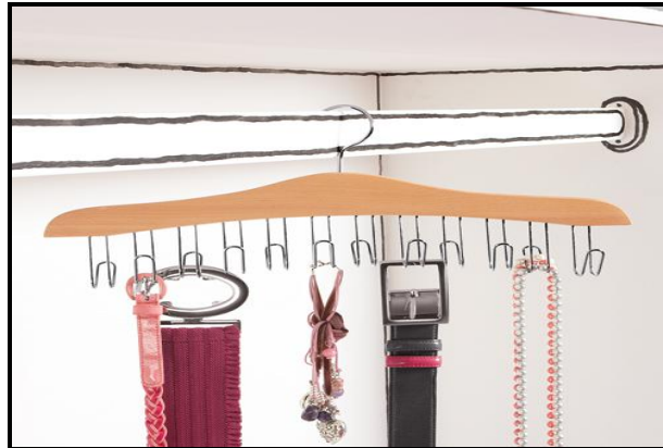
Resim 1.9: Kemer ve aksesuar askıları

Kemerlere düzen sağlarlar. Birden fazla kancalı kemer askısı vardır. Ayrıca kolye gibi aksesuarlarında düzenli muhafazası için idealdir. Masif kayın ağacı ve kromlu metalden tipleri vardır.