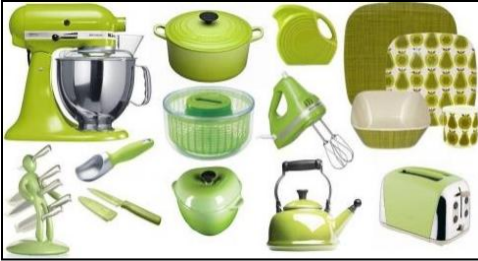
Resim 2.14: Çeşitli işleve sahip mutfak aksesuarları

Yemek kitapları evin farklı bölümlerinde saklanabileceği gibi asıl saklanma yeri mutfaklar olmalıdır. Ufak bir masa, mutfak raflarından biri ya da geniş bir çekmece kitapları koymak için yeterlidir. Tabii ideal olanı, özel kitap rafları ki böylelikle sadece pratiklik değil, estetik açıdan da mutfaklar zenginleşmiş olur.