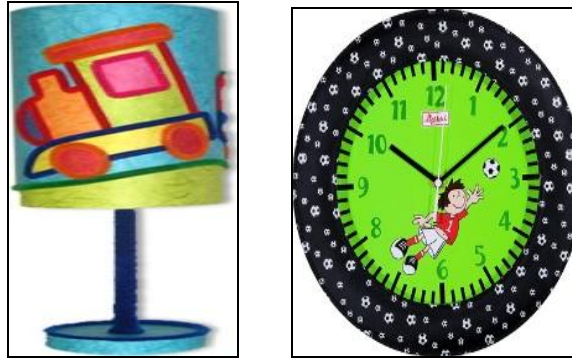
Resim 2.22: Bebekler için saat ve renkli bir abajur

Bir bebek ya da çocuk odasında gerekenler bellidir; Derece, çerçeve, saat, puf, lamba, yastık ve benzeri eşyalar olmalıdır. Her şeyin sadece pembesine ya da mavisine takılmamak gerekir. Ya da çocuk odasını oturma odası gibi her şeyin bir örnek olduğu bir yetişkin mantığıyla döşemeye çalışmak uygun olmaz.