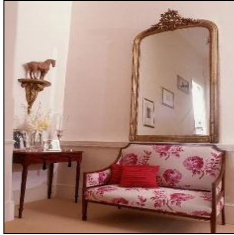
Resim 2.16: Aksesuarlarla zenginleřtirilmiř bir antre

Antreler eve giriřte ilk görölen yerlerdir. Antrelerde kullanılan aksesuarlar dekoratif aynı zamanda fonksiyonel aksesuarlar olmalıdır. Dikkat çekici yerler olması isteniyorsa farklı renkler ve duvar kâğıtları kullanılmalıdır.