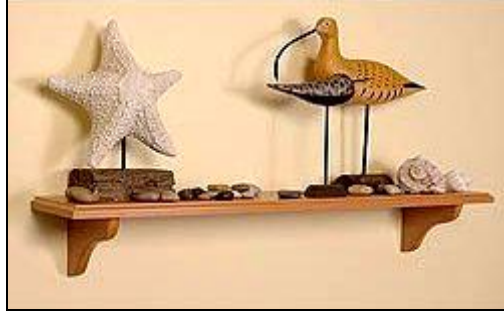
Resim 2.1: Raflardaki minik objeler sık kullanılan aksesuarlardandır

Fotoğraflar grup hâlinde sergilenirken çerçeve renklerini aynı renkten seçmek aksesuar görünümünde bütünlük sağlar.