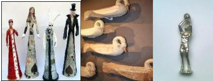
Resim 2.6: Heykeller