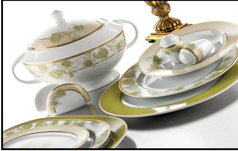
Resim 1.4: Porselen yemek takımı