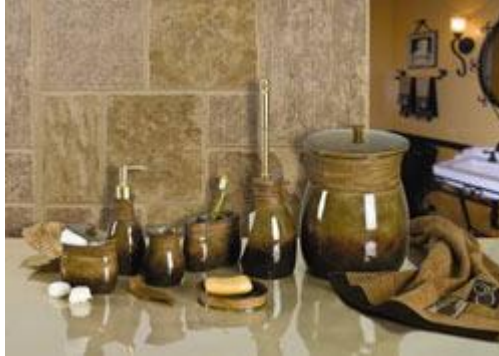
Resim 1.19: Banyo aksesuarları

Banyo aksesuarları; banyo perdeleri, lavabo üstü aksesuarları, ayna, banyo (klozet takımı) takımları, kirli sepeti, havlular, bornozlar, sabunlar ve sabun sepeti gibi banyoda ihtiyaç olan ve hayatı kolaylaştıran aksesuarlardır.