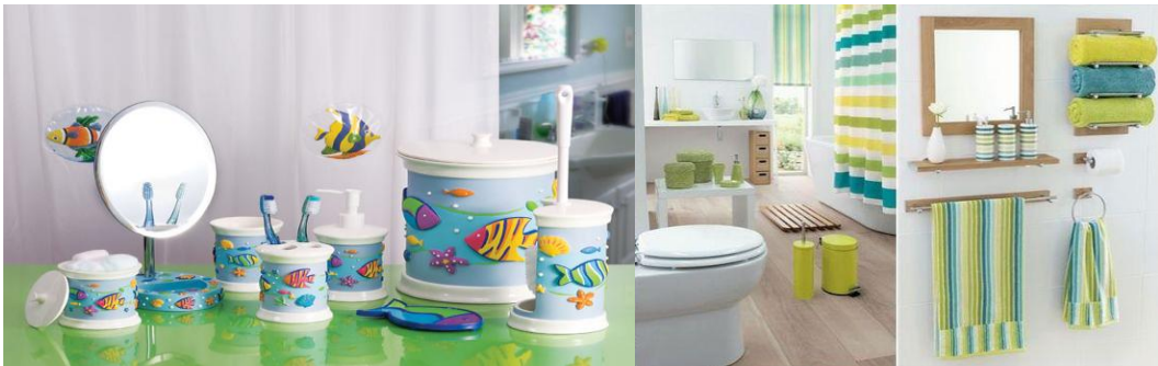
Resim 2.18: Banyo aksesuarlarından bazıları

Banyo aksesuarları; havluluk, küvet tutamakları, tel süngerlik ve şampuanlıklar, diş fırçalığı, klozet fırçalıkları, çöp kovaları, askılıklar, tuvalet kâğıtlıkları, sabunluklar, aplikler, etajerler, aynalar vb. aksesuarlardır.