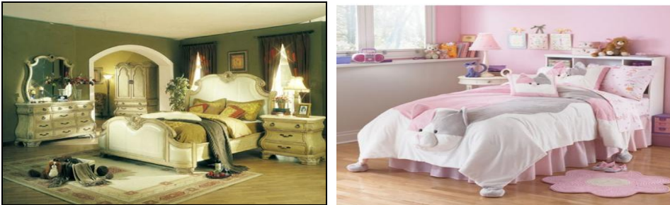
Resim 2.11: Aksesuarları ile dekore edilmiş yatak odaları

Yatak odasında güzel görünümlü, insana rahatlık veren işlemeli yatak örtüleri, yatak takımları, şifonyer, abajur, tablolar, mumlar ve dolap örtüleri odayı süslemekte ve odanın dekorasyonunda önemli ölçüde etkilemektedir. Günlük kullanım dışında özel günlerde kullanılmak üzere (Doğum, sünnet, evlilik) fantezi kumaş ve işleme tekniklerinden hazırlanan gösterişli yatak örtüleri bulunmaktadır. Örtülerde özenle seçilen renk, biçim ve doku ile mobilyanın uyumu, dekorasyonun bütünlüğünü ortaya çıkarmaktadır. Ayrıca çocuk odalarında çocukların ilgisini çekecek, çizgi roman kahramanları ve hayvan figürlerinin yer aldığı işlemeli örtüler yatakları süslemektedir.