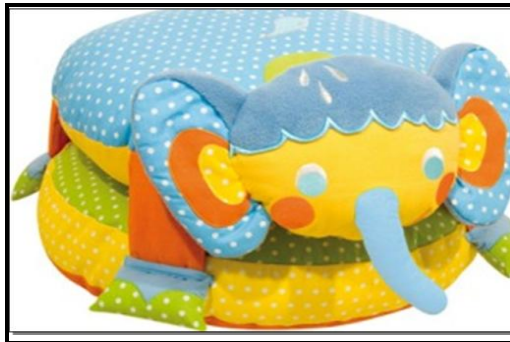
Resim 2.20:Sevimli pufardan biri

Bebek odalarının neşeli, renkli ve masalsı bir izlenim bırakması beklenir. Mobilya mağazasından alınan minik eşyaların birkaç oyuncakla süslenmesi bile, buranın evin diğer odalarından daha farklı olduğunu anlatır. Yine de bazı ayrıntılar ekleyerek, çok daha renkli ve cıvıl cıvıl bir ortam yaratılması mümkündür. İşe yaramaz, dekoratif bir dolu süs eşyası yerine, kullanılacak her eşya ya da nesneyi oyuncaklı, renkli ya da esprili olanlar arasından seçmek daha uygun olur.