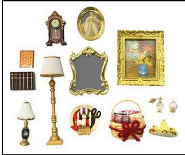
Resim 1.17: Odalarda kullanılabilecek aksesuarlardan örnekler

Daha sonra oda bir kez daha incelenir ve gerekli görülen yerlere küçük aksesuarlar yerleştirilir. Yıldızlar, hayvan figürleri, meyve ve sebzeler, çiçekler, süslemek için kolaylıkla bulunabilecek küçük aksesuarların yalnızca birkaçıdır.