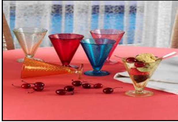
Resim 1.6: Cam eşyalar

Porselen ve gümüş için söylenenlerin tümü cam için de geçerli olabilir. Su içmede kullanılan çeşitli kaplar alüminyum, paslanmaz çelik, şeffaf ve mat plastik, gümüş veya toprak kaplardan yapılabilir. Ancak cam doğası gereği sıvılar için özel bir çekiciliğe sahiptir.