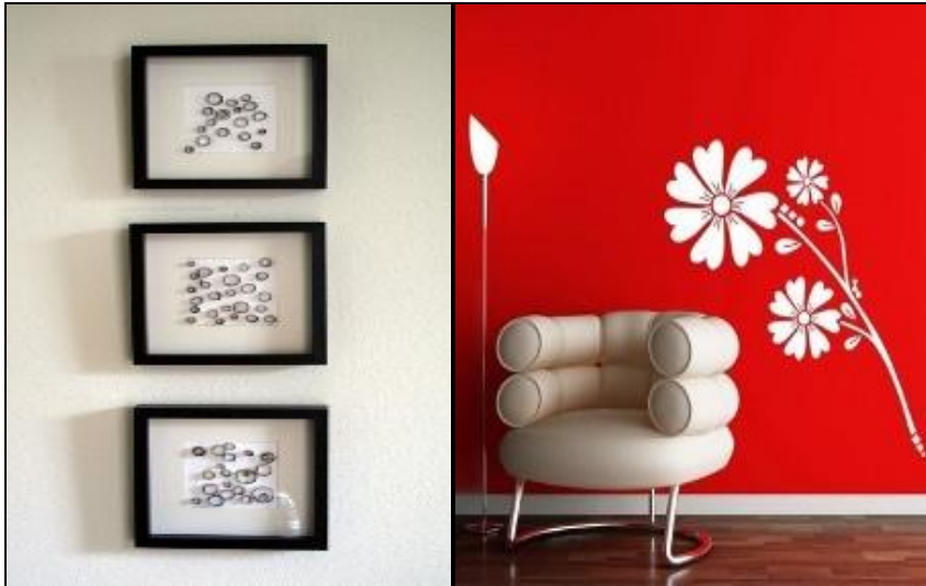
Resim 1.14: Dikkat çekici duvar süsü örnekleri

Duvar aksesuarları fikir olarak insanın hayal gücünü zorlayan ama aynı zamanda çok hoş bir renkliliğin sergilenebileceği güzel bir dekor oluşturur. Hem eğlencelidir hem de düşünerek zenginlik katılabilir. İşin başındayken bir tema belirlemek, ayrıntılara daha kolay odaklanılmasını sağlar ve bütünsel bir etki yaratılmasına yardımcı olur.