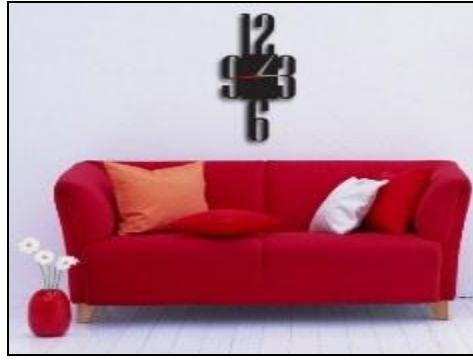
Resim 1.22: Büyük obje ve aksesuarların yerleştirilmesi