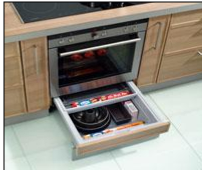
Resim 1.11: Fırın altlarına çekmece

Özellikle dar kullanım alanı olan mutfaklar için önemli bir avantaj sağlayan çekmece sistemi, fırın gereçlerini saklamak için ideal bir çözüm sunmaktadır. Çekmece sistemi, kek kalıplarından peçetelere, ızgara teli, maşa ve şiş gibi mangal malzemelerinden Amerikan servislere kadar pek çok malzeme ve gerecin yerleştirilebileceği bir alandır.