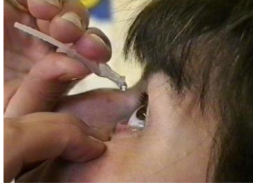
Resim 1.6: Göze damla uygulaması

Şurup: Etkin ilaç maddesinin su ve %60 oranında şeker veya tatlandırıcı maddelerle karıştırılmasıyla elde edilen sıvı ilaçtır. Oral yolla kullanılır. Fazla şekerli olduklarından içerisinde bakteri ve mantarlar üremez.