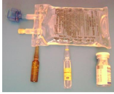
Resim 1.8: Solüsyon, ampul ve flakon

Ampul, flakon, viyal: İçerisinde, toz ya da sıvı etken madde bulunan steril şartlarda hazırlanmış cam muhafazalı farmasötik ilaç biçimidir. Ampul ve flakonda sıvı ya da toz ilaç bulunur. Toz ilaç varsa ayrı ampulde bulunan sıvı ilaçla karıştırılarak kullanılmak üzere ambalajlanır. Viyal; içinde birden fazla doz bulunan biçimidir. Parenteral yolla kullanılır.