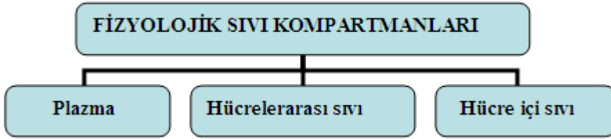
Şema 2.1: İlaçların vücutta dağıldıkları fizyolojik sıvı kompartmanları

İlaçlar absorbe olduktan sonra kapillerlerden damar dışına geçerek interstisyel sıvıya (hücrelerarası boşlukları dolduran sıvı) dağılır. Bazı ilaçlar hücrelerin içine de geçer. İlaçların vücutta dağıldıkları fizyolojik sıvı kompartmanları plazma, hücreler arası (interstisyel) sıvı ve hücre içi (intraselüler) sıvı olmak üzere üç tanedir.