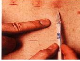
Resim 2.1: Cilt içine ilaç enjekte edilmesi

Bukal (ağız içi) yol: Ağız ve boğaz mukozasının yüzeysel iltihaplanmalarında, ilacın ağız boşluğuna uygulanmasıdır. Gargara, pastil bu yolla kullanılır. İlacın bu yolla emilimi ağızdan yutulardan alınan ilaçlara göre daha hızlıdır.