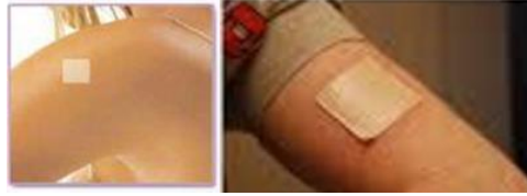
Resim 2.5: Transdermal yolla ilaç uygulaması

İlacın, özel bir farmasötik şekil içinde ciltten absorbe edilerek dolaşıma girmesini sağlamak amacıyla cilt üzerine uygulanmasıdır. Örneğin nitrogliserin, testosteron, estradiol gibi ilaçlar bu yolla uygulanılır.