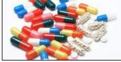
Resim 1.3: Kapsül çeşitleri

Kapsül: Tadı ve kokusu hoş olmayan toz veya sıvı ilaçların kolay alınabilmesi için silindirik, yassı ve zeytin şeklinde iç içe geçen jelatin koruyucular içinde hazırlanmış ilaç biçimidir.