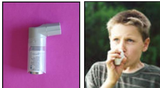
Resim1.7: Aerosol kullanımı

Aerosol: Etkin maddeyi çözebilen özel eriticiler içinde hazırlanan ve inhalasyon yoluyla kullanılan farmasötik ilaç şekilleridir.