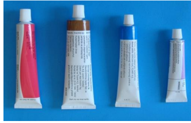
Resim 1.5: Pomad ve krem çeşitleri

Merhem (pomad): Deri ve mukoza hastalıklarının tedavisinde sürülerek kullanılır. Etken ilaç maddesinin lanolin veya vazelin gibi ana maddeler içinde eritilmiş yarı katı ilaç şeklindedir. Daha koyu kıvamlı merheme pat denir. Merheme göre içindeki su oranı fazla ve daha yumuşak ilaç şekline krem denir. Deri ve mukozaya dıştan uygulanır.