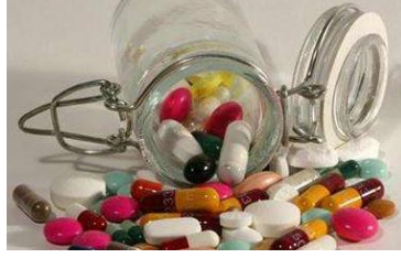
Resim 2. 3: Ağızdan kullanılan farmasötik ilaç şekilleri

Sublingual (dilaltı) yol: İlacın dilaltına konulup yutulmadan ağız mukozasından emilerek alınmasıdır. Örnek: İsoiprenalin astmadaki bronkospazmı kaldırmak için kullanılır.