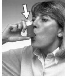
Resim 2.4: İnhalasyon yolu ile ilaç uygulama

Gaz veya buhar hâlindeki lipofilik (yağda çözünen) ilaçlar, solunum yoluyla alveol membranını aşp genel kan dolaşımına geçer. İnhalasyon yoluyla aerosoller ve genel anestezi ilaçlar (azot protoksit,haloton vb.) bu yolla verilir.