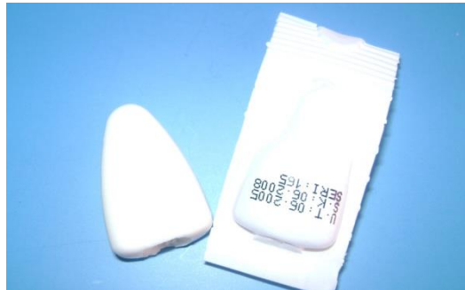
Resim 1.4: Ovül ve ambalajı

Ovül: Oval veya silindirik şekilde vücut ısısında çabuk eriyen ilaç biçimidir. Vajinal yolla kullanılır.