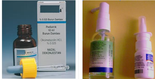
Resim 2.2: Burun damlası, oral ve nazal sprey

İntranazal (burun boşluğu içine) yol: Toz, solüsyon (burun damlası) veya sprey şeklindeki preparatların burun boşluğuna uygulanmasıdır. Halusinojenler ve vazopressin bu yolla kullanılır.