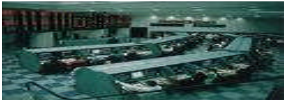
Resim 1.5: Yatırım ortaklığı

Yatırım ortaklıkları, sermaye piyasası araçları ile ulusal ve uluslararası borsalarda veya borsa dışı organize piyasalarda işlem gören altın ve diğer kıymetli madenler portföyü işletmek üzere anonim ortaklık şeklinde ve kayıtlı sermaye esasına göre kurulan sermaye piyasası kurumlarıdır.