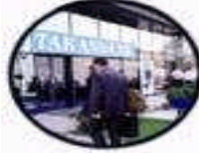
Resim 3.8: Takasbank

Takasbank grevinde bulunacak aracı kuruluřları alıřma esasları ařaęıdaki gibidir: