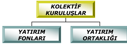
Şekil 1.1: Kolektif yatırım kuruluşu çeşitleri

Birçok küçük yatırımcının bir araya gelmesini ve ortak olarak yatırım yapabilmesini sağlayan kurumlar “kolektif yatırım kuruluşları” dir. Tasarruf sahipleri, aracı kuruluşlardan menkul kıymet (hisse senedi, tahvil vb.) olarak tasarruflarını değerlendirebilirler. Ancak menkul kıymetlere yatırım yapmak bilgi ve uzmanlık gerektirmektedir. Ayrıca bireysel tasarruflar genelde yeterli büyüklüğe ulaşamadıklarından, tasarruf ve tasarrufun getirisinde (faiz ve kâr payı) risk oluşturmaktadır. Bu riski ortadan kaldırmak için, sermaye piyasasında kolektif yatırım kuruluşları oluşturulmuştur. Kolektif yatırım kuruluşları, yatırım fonları ve yatırım ortaklığı olmak üzere iki şekilde piyasada faaliyet göstermektedir.