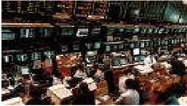
Resim 3.2: Takasbank kuruluşları

Bankaca düzenlenen “TBPP (Takasbank Borsa Para Piyasası) Taahhütnamesi”ni imzalamış olan, İMKB ve görev verilecek diğer borsalara üye Banka ve Aracı Kurumlar ve T.C. Merkez Bankası, TBPP’ de işlem yapabilir.