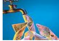
Resim 3.6: Takasbank teminat türleri