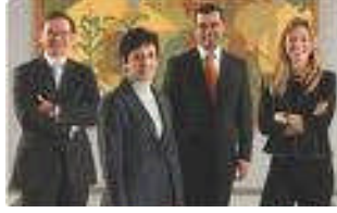
Resim 2.1: Finansal kuruluş çalışanlarının ilkeleri

Finansal kuruluşların çalışma esaslarından biri de çalışma ilkelerinin var olması ve bu ilkeler doğrultusunda faaliyetlerini göstermeleridir. Bu ilkeler aşağıda belirtilmiştir.