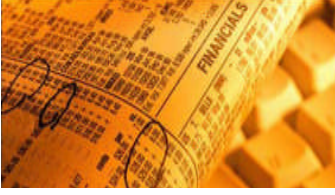
Resim 1.13: Yatırım ortaklığı

Yatırım ortaklıkları sermaye piyasası araçları, gayrimenkul, altın ve diğer kıymetli madenler portföylerini işletmek amacıyla kurulan anonim ortaklıklardır. Yatırım ortaklıklarının kimler tarafından kurulabileceği konusunda özel bir düzenleme yapılmamıştır. Bu nedenle herhangi bir anonim ortaklık ya da gerçek ve tüzel kişiler yatırım ortaklığı kurup işletebileceklerdir.