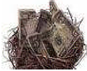
Resim 1.2: Yatırım aracı

Birçok küçük yatırımcının bir araya gelmesini ve ortak olarak yatırım yapabilmesini sağlayan kurumlar “kolektif yatırım kuruluşları” dir. Tasarruf sahipleri, aracı kuruluşlardan menkul kıymet (hisse senedi, tahvil vb.) olarak tasarruflarını değerlendirebilirler. Ancak menkul kıymetlere yatırım yapmak bilgi ve uzmanlık gerektirmektedir. Ayrıca bireysel tasarruflar genelde yeterli büyüklüğe ulaşamadıklarından, tasarruf ve tasarrufun getirisinde (faiz ve kâr payı) risk oluşturmaktadır. Bu riski ortadan kaldırmak için, sermaye piyasasında kolektif yatırım kuruluşları oluşturulmuştur. Kolektif yatırım kuruluşları, yatırım fonları ve yatırım ortaklığı olmak üzere iki şekilde piyasada faaliyet göstermektedir.