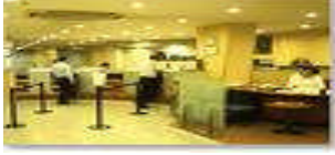
Resim 1.14: Portföy yönetimi

Portföy yürütmek amacıyla kurulması düşünülen şirketlerin aşağıdaki şartlara sahip olması gerekmektedir.