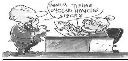
Resim 1.4: Yatırım fonu çeşitleri