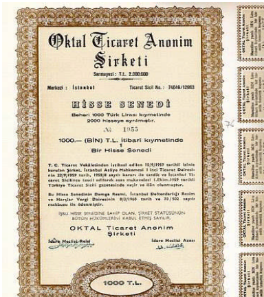
Resim 1.17: Faaliyet aracı

Aracı kuruluşların aracılık faaliyetlerine ilişkin esaslar Kurul tarafından düzenlenir. Kurul, her bir aracılık faaliyetinin ayrı kuruluşlar tarafından yapılmasına ilişkin düzenlemeler yapmaya yetkilidir. Aracı kuruluşlar, Kurulca belirlenecek esaslar dâhilinde, izin almak şartıyla, diğer sermaye piyasası faaliyetlerinde de bulunabilirler.