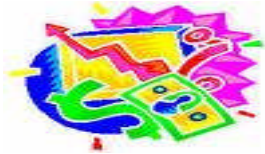
Resim 1.15: Yatırım fonu aracı

Yatırım fonu kuruluşları, genel itibarıyla fon portföyünü yönetmektedirler. Fon portföyü, fonun içerisindeki para ve sermaye piyasası araçlarından oluşan varlıklardır. Fon portföyü aşağıda belirtilen para ve sermaye piyasası araçları ve işlemlerinden oluşur: