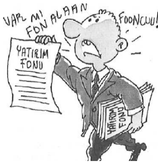
Resim 1.3: Yatırım fonu

Yatırım fonu, yetkili kuruluşlarca, katılma belgesi karşılığında tasarruf sahiplerinden toplanan kaynakların, çeşitli sermaye piyasası araçlarına dengeli bir şekilde dağıtılarak verimlendirilmesini sağlayan kurumlardır. Yatırım fonlarının portföylerinde yer alabilecek varlıklar şunlardır: