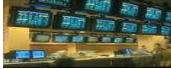
Resim 3.10: Takasbank emir yayını

İletilen alış-satış emirlerinden, alış emirlerinde en yüksek oranlı olanları, satış emirlerinde en düşük oranlı olanları bilgi dağıtım ekranları aracılığı ile duyurulur. En iyi teklifler ve taleplerden işlem yapılması halinde sonraki bekleyen en iyi teklif ya da talep ekrana gelir. Alış ve satış emirlerinde oranlarda eşitlik olması halinde zaman önceliği esas alınır. Aynı oranlı alış ve satış emirleri ekranda toplam olarak görünür. O/N işlemlerde, en iyi üç teklif ve talep derinlik sayfasında izlenebilir.