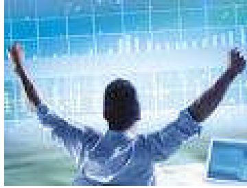
Resim 2.3: Finansal kuruluşların sona ermesi

Sermaye Piyasası Kurulu, aşağıda belirtilen durumlarda, finansal kuruluşların faaliyetlerini temsil eden yetki belgelerini, tamamen veya belirli faaliyet alanları itibarıyla iptal edebilir ya da faaliyetlerini geçici olarak durdurabilir. Bu durumlar;