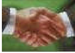
Resim 4.6: Derecelendirme sözleşmesi

Derecelendirme kuruluşlarının, derecelendirme faaliyetlerinde bulunabilmesi için müşterileri ile yazılı bir sözleşme yapmaları zorunludur. Bu zorunluluk talep edilmemiş derecelendirmeler için aranmaz.