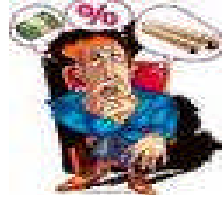
Resim 4.2: Derecelendirme faaliyetleri