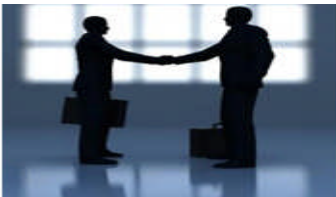
Resim 3.5: Takasbank üyesi

Her aracı kuruluşun, Takasbank’a vermiş olduğu teminatlara göre alış limiti hesaplanır. Üye alış limiti, TBPP limitinden toplam alış işlemlerinin düşülmesi ve vadesi gelen alış işlemlerinin eklenmesi ile bulunur.