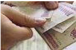
Resim 1.7: Gayrimenkul yatırım ortaklığı