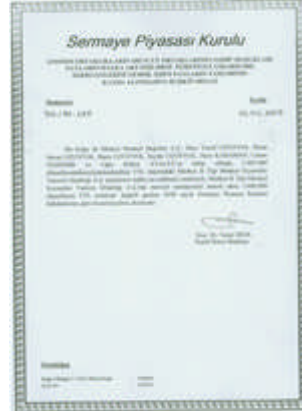
Resim 2.2: Yetki belgesi

İzin verilen kuruluşlara, icra edecekleri sermaye piyasası faaliyetlerini gösteren yetki belgesi verilir. Yapılabilecek sermaye piyasası faaliyetleri ve aracılık türleri itibarıyla yüklenilebilecek sorumluluğun azami sınırına ilişkin esaslar Kurulca düzenlenir.