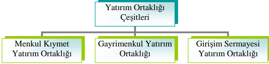
Şekil 1.3: Yatırım ortaklığı çeşitleri

Yatırım ortaklıklarının temel fonksiyonu küçük tasarruf sahiplerinin birikimlerini bir havuzda toplayarak değişik menkul kıymetlerden oluşacak bir portföye yatırmak ve bu yolla elde ettikleri kazancı ortaklarına payları oranında dağıtmaktır. Yatırım ortaklıklarının çeşitleri ise şunlardır: