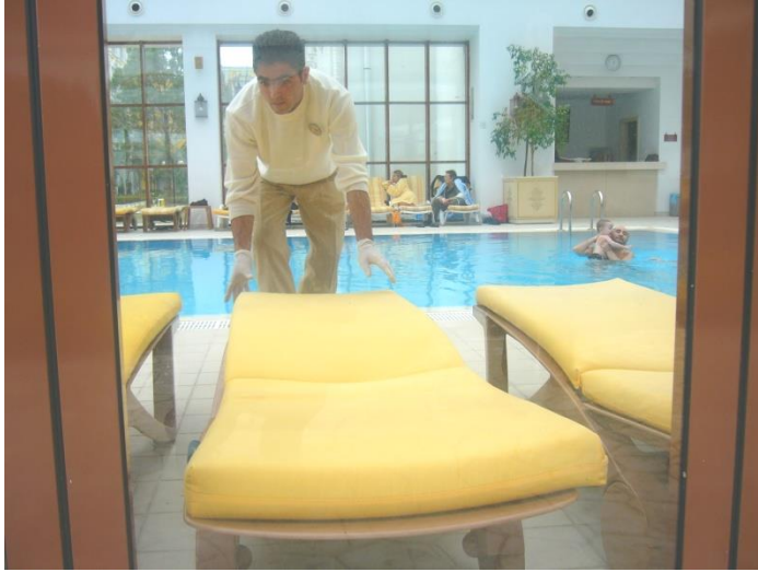
Resim 5.10: Havuz çevresi genel düzeninin sađlanması

Açık vekaalı havuzlar kullanıma açık olduđu süre içerisinde kullanım yoğunluđuna göre sık sık temizlenir ve kontrol edilir. Havuz çevresi genel düzeni sađlanır (Resim 5.10 ). Duş, soyunma kabini ve tuvaletler tekniđine uygun olarak sıklıkla kontrol edilir ve temizlenir. Eksik malzemeler tamamlanır. Havuz çevresinde bulunan uyarı levhaları, duyurular kontrol edilir. Temizlik işlemleri, konuđu rahatsız etmeden yapılır. Çalışma sırasında nezaket kurallarına uygun davranılır. Çalışma alanında malzeme bırakılmamalıdır. Malzemeler tekniđine uygun olarak toplanıp, uygun alanlarda depolanır. Bu alanların temizlik ve düzeninden sorumlu şefi ,sık sık dolaşarak yapılan çalışmaları kontrol etmelidir. Ancak titiz çalışmalar sonunda, kaliteli hizmet verildiđi unutulmamalıdır.