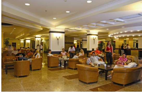
Resim 4.3: Lobi