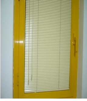
Resim 3.4 Plastik jaluzi