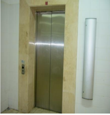
Resim 1.1: Servis asansörü

Servis asansörleri konuk asansörleri kadar gösterişli değildir. Konuk asansörleri, gösterişli malzemelerden yapılmıştır ve farklı malzemeler bir arada kullanılmıştır. Her işletme yapısına uygun özellikte asansör tercih eder; çünkü bu alanlar, görsel açıdan da önem taşır. Konukların dışarıyı görebilmesi için şeffaf malzemeden yapılmış, binanın içinde ve dışında çalışan asansörler de vardır. Asansörlerin yan yüzeyleri genellikle cam,ayna,paslanmaz çelik,pirinç,altın kaplama,ağşap, plastik gibi malzemelerden yapılmıştır.Tavan kısmında havalandırma,aydınlatma,müzik yayın sistemi bulunur.Zemini ise plastik,halı,mermer,taş gibi malzemelerden yapılmıştır.