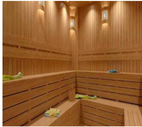
Resim 2.6: Sauna