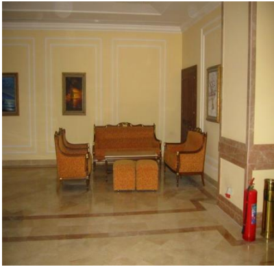
Resim 1.6:Tablolar ve oturma grubu

➤ Kül Tablaları: Günlük temizliği sık sık yapılmalıdır. Temizlik sırasında sönmemiş sigaralara dikkat edilmelidir. Periyodik temizliğinde, yapılış maddesine uygun kimyasallarla parlatma işlemi yapılır (Resim 1.7 ).