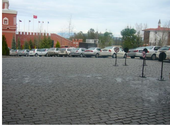
Resim 6.1:Tesis otoparkı

Günlük olarak çöp kovaları boşaltılır ve içleri temizlenir.Yere atılmış çöpler toplanır,zemin süpürülür.Alanda bulunan aydınlatmalar,yön ve uyarı levhaları kontrol edilir Resim 6.1).