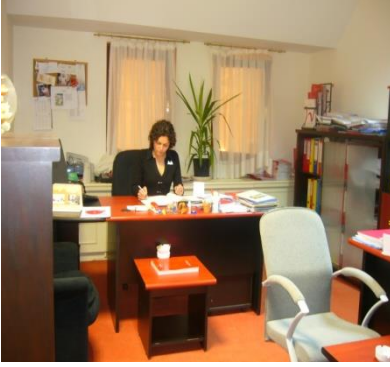
Resim 3.1: Büro çeşit ve donanımları