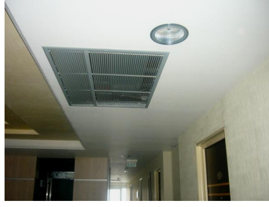
Resim 1.11: Uyarı ve yönlendirme levhaları