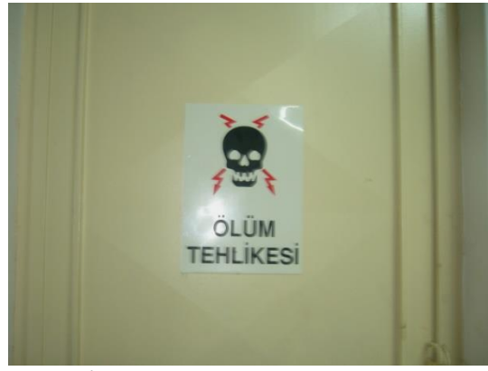
Resim 1.11:Uyarı ve yönlendirme levhaları