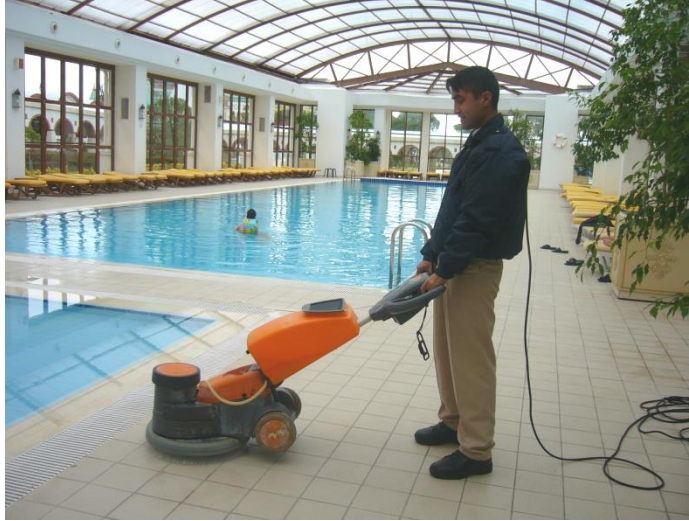
Resim 5.10: Havuz çevresi yıkama makinası

Havuz içi bakımı ve dezenfeksiyonu yapılır. Havuz suyu (genellikle 6 ayda bir )belirli periyotlarla boşaltılır ve içi özel kimyasallarla fırçalanarak yıkanır. Teknik donanımları kontrol edilir ve havuz yeniden doldurulur.