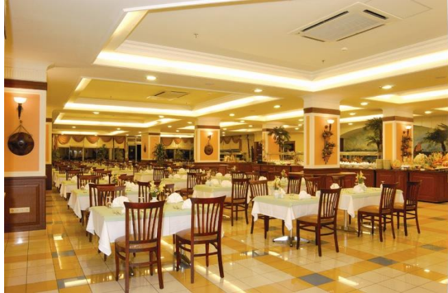
Resim 4.2: Restaurant

Restaurantların temizliği ve bakımı yiyecek içecek servisi personeli ile kat hizmetleri personeli ortaklaşa yapar. İşletmeden işletmeye farklılık göstermekle birlikte genellikle günlük temizliği restaurant tarafından yapılır. Periyodik temizliği kat hizmetleri personeli tarafından yapılır.