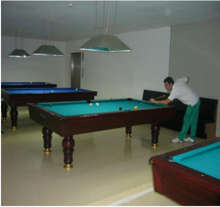
Resim 2.3: Oyun salonu

Konaklama tesisinin hizmet amacına ve büyüklüğüne göre aktivite alanlarının çeşitliliği artabilir veya hepsi bir arada bulunmayabilir (Resim 2.3 ).