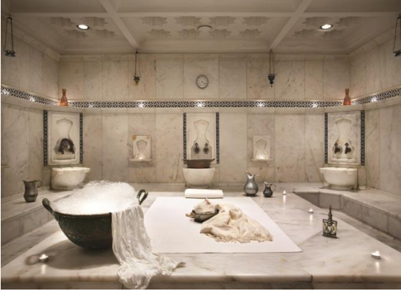
Resim 2.5: Hamam