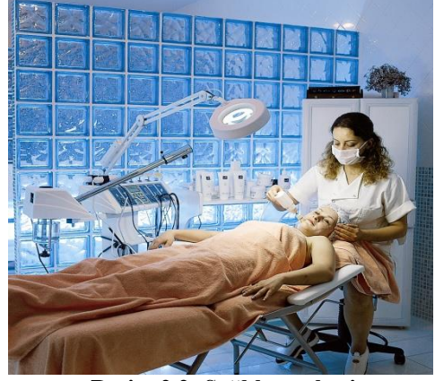
Resim 2.2: Sağlık merkezi