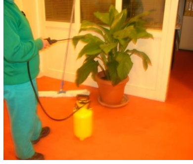
Resim 3.5 iek temizliđi