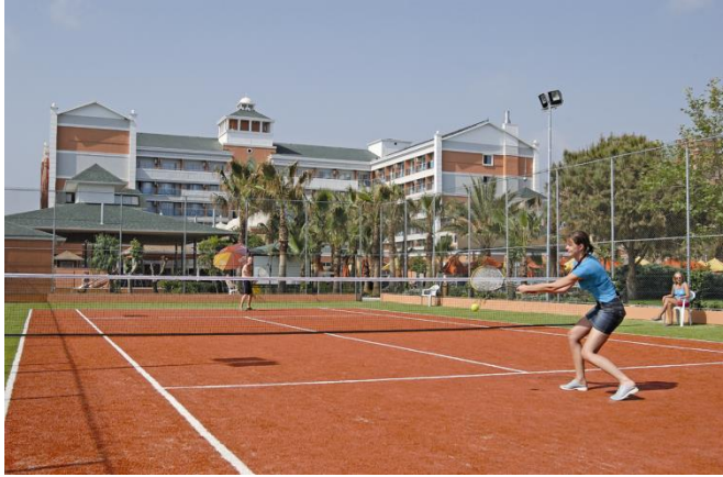
Resim 6.4:Tenis sahası