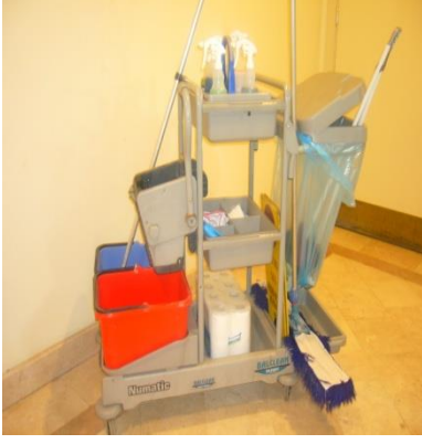
Resim 4.5: Lobi temizlik arabası