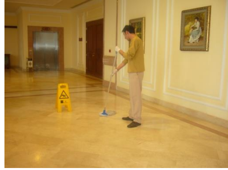
Resim 1.9: Lobi paspaslanması