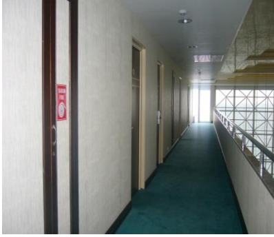
Resim 1.8: Koridor kapı ve kapakları