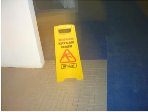
Resim 1.10: Kaygan zemin ve hizmet dışı levhası