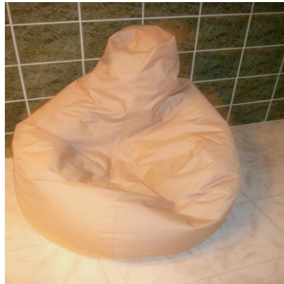
Resim 5.9: Minder

Zemin ; seramik,taş,suya dayanıklı ağaçken olabilir.