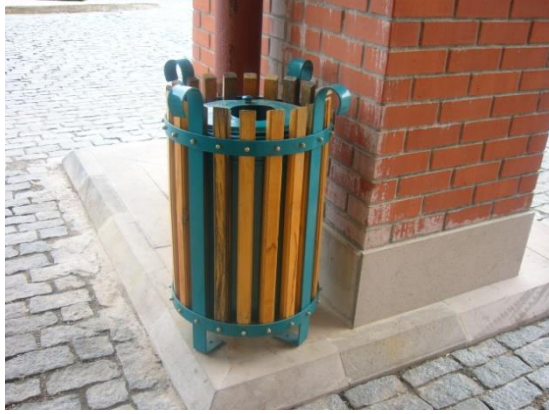
Resim6.3:Genel alan çöp kovası örneği