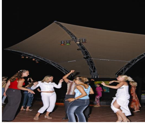
Resim 6.6:Açık disko