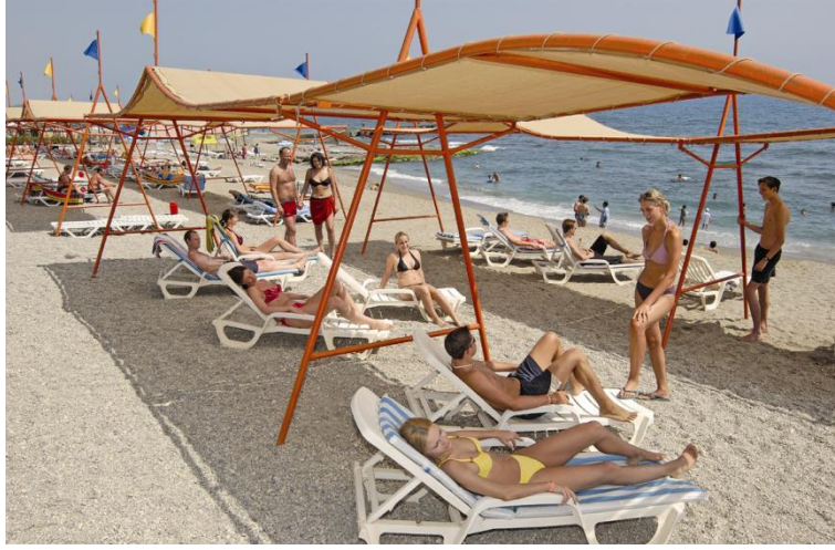
Resim 5.1: Plaj ve donanımları