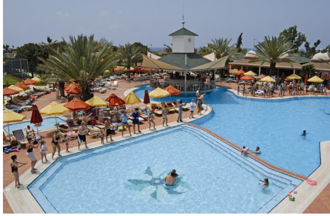
Resim 5.8: Açık havuz ve donanımları

Havuz etrafında konuk ihtiyacı , dekorasyon veya teknik açıdan gerekli donanımlar vardır. Bunlar tesislere göre farklılık gösterir.