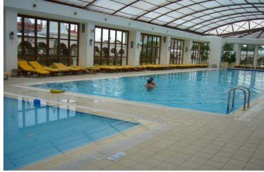
Resim 2.9: Kapalı havuz