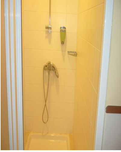
Resim 5.2: Duş kabini