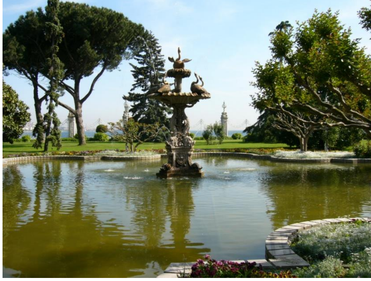
Resim 6.7:Süs havuzu