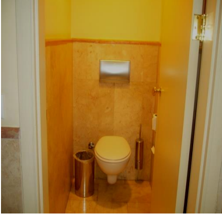
Resim 5.4: Genel alan tuvaleti