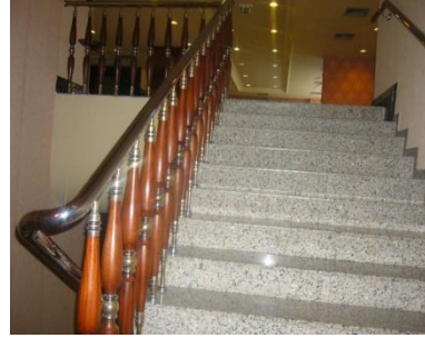
Resim 1.5 Konuk merdiveni