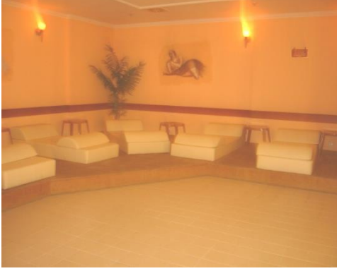
Resim 2.7: Dinlenme salonu