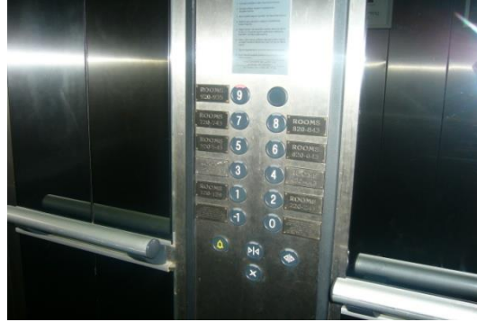
Resim 1.3: Asansör kontrol paneli

Asansör kontrol paneli, asansörde gideceğimiz yön için kullandığımız tuşların bulunduğu ünedir. Asansör kabininin içerisinde ve dışarıda bulunur. Genellikle paslanmaz çelikten yapılmıştır. Üzerinde bulunan tuşlar plastik malzemeden yapılabilir. Gün boyunca bu alanlara defalarca dokunulmaktadır; bu yüzden hem kirlilik hem de hijyen bakımından kontrol panelinin temizliği önem taşır. Gün içerisinde yoğunluğa göre yüzeye uygun kimyasallarla parlatılır ve dezenfekte edilir.Gece görevlileri tarafından yüzey, yağ ve kir çözücülerle temizlenir.Panel üzerinde bulunan tuşların girintilerinde oluşan kirler diş fırçası gibi bir araçla temizlenir (Resim 1.3).