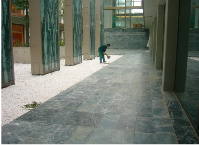
Resim 6.8:Genel alan temizliđi