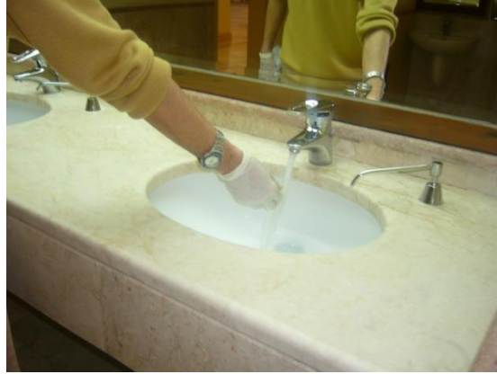
Resim 5.6: Genel alan lavabo temizliđi iřlem sırası