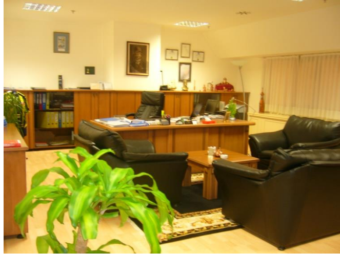
Resim 3.3: Büro donanımları

Büro ve ofisler genellikle gündüz çalışma alanlarıdır. Bu nedenle temizliği akşam görevlileri tarafından yapılır. Görevli kat hizmetleri personeli işini titiz ve dikkatli yapmalıdır. Masa üzerinde bulunan evraklar karıştırılmadan alınır, masanın temizliği yapıldıktan sonra evraklar alındıkları yerlere konulur. Masa üzerinde bulunan küçük notlar atılmamalıdır. Elektrikli araçların temizliği ile ilgili özel notlara dikkat edilmelidir. Çalışma alanınızın başkaları tarafından karıştırılmasına izin verilmemelidir. Temizliği biten alan kilitlenerek güvenliği sağlanmalıdır.