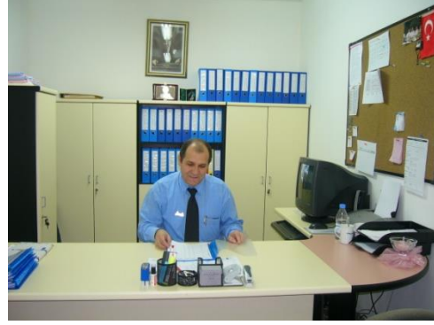
Resim 3.2: Ofis donanımları