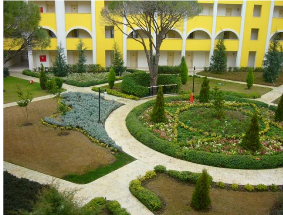
Resim 6.2:Yürüyüş yolları