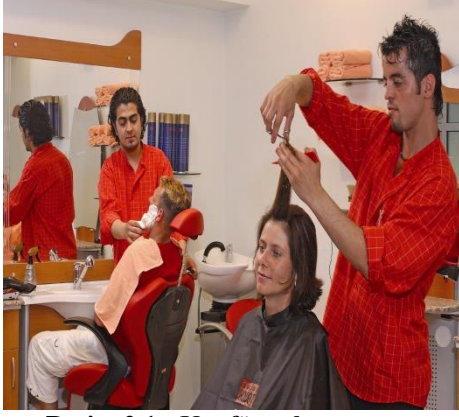
Resim 2.1: Kuaför salonu