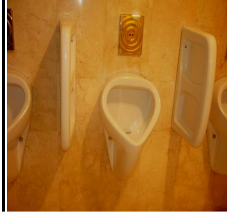
Resim 5.5: Pisuvar