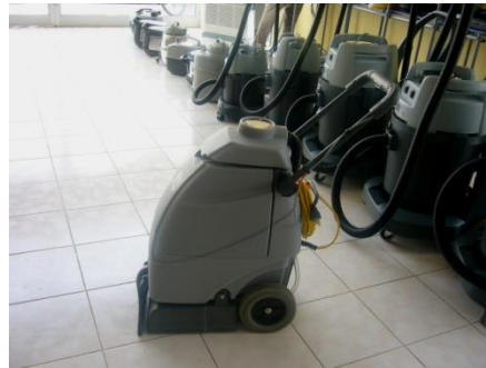
Resim 6.9: Genel alan zemin temizliğinde kullanılan makine çeşitleri