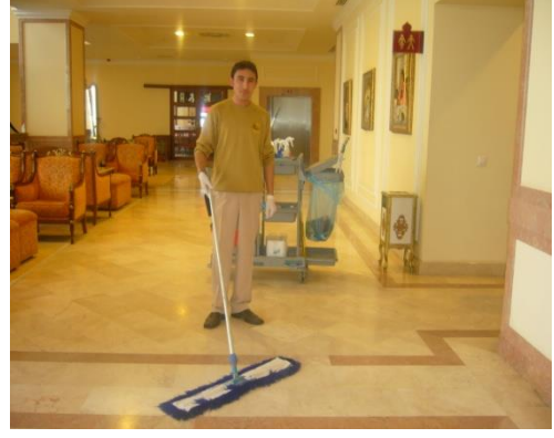
Resim 4.6: Lobi temizliđi