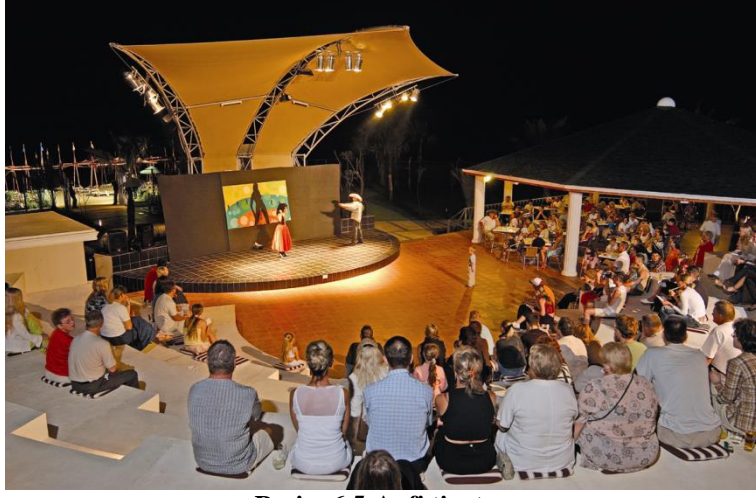
Resim 6.5:Anfi tiyatro