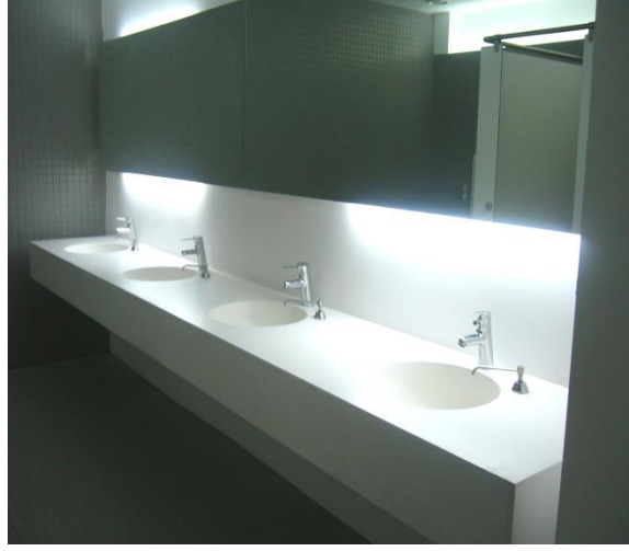
Resim 5.3: Genel alan lavabo örneği