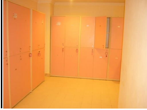
Resim 2.8: Emanet eşya dolabı