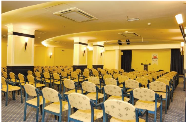
Resim 4.1 Toplantı salonu

Toplantı salonları, toplantı, seminer ve konferanslar için hazırlanmış özel amaçlı salonlardır.(Resim 4.1 )Bu salonların düzenlenmesi ve servis hizmeti, yiyecek-içecek servisi bölümüne aittir. Kat hizmetleri personeli ise bu salonların periyodik temizliğinden sorumludur.