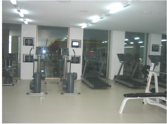
Resim 2.4: Spor salonu