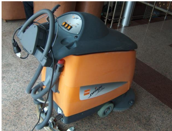
Resim 4.4 Zemin yıkama makinası

Lobinin periyodik temizliği diğer alanlarla aynıdır.