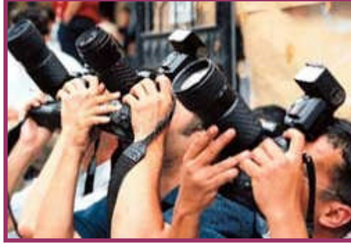
Resim 1.2: Basına ilgi çekici haberler gönderilmesi

Tüm bu maddeleri özetlediğimizde halkla ilişkiler görevlisinin şu kurallara uyması gerekir. Bunlar dürüstlük, kullanılabilirlik, samimiyet, açık sözlülük ve materyalin medyaya zamanında ulaştırılmasıdır.