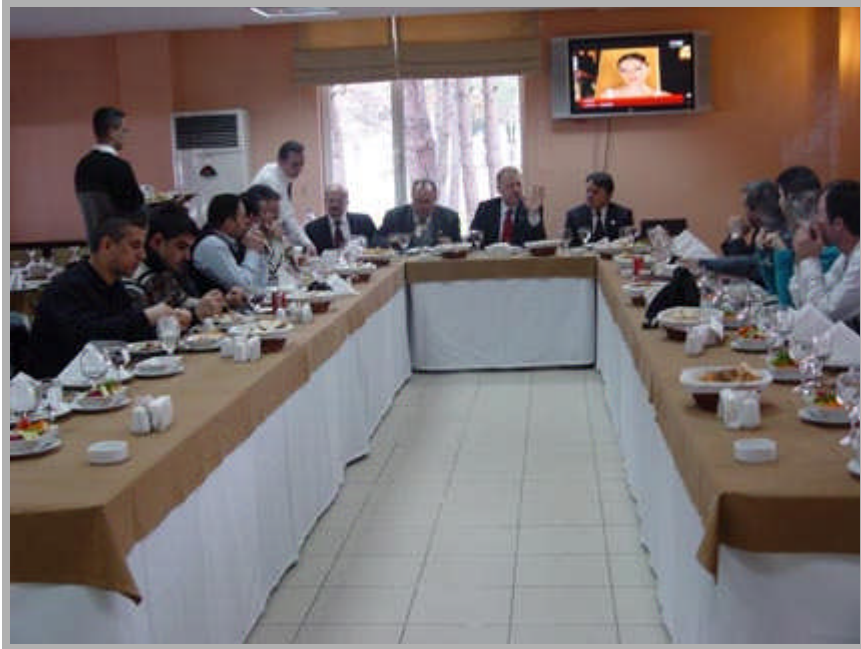
Resim 3.10: Basın toplantısında konuşmacı sözünü bitirdikten sonra sorular sorulması

Bunların dışında ayrıca basın toplantılarının sonunda bir kokteyl düzenlenirse daha renkli bir görünüm kazanır. Özellikle üst düzeyde yeni bir yönetici atanmışsa bir açılış yapılıyorsa veya kuruluş yıl dönümü söz konusu ise basın toplantılarının bir kokteylle süslenmesi ilgi çekici olabileceği gibi işletme yöneticileri ve halkla ilişkiler uzmanlarının basın organlarına daha çok yaklaşmasına fırsat yaratılmış olur.