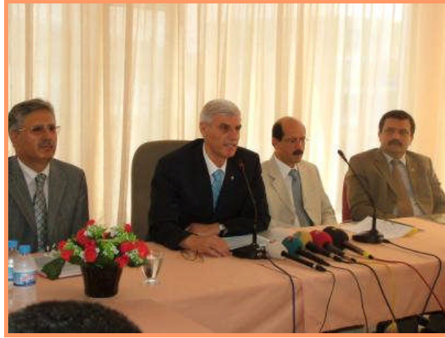
Resim 3.8: Basın toplantısı

Yapılan toplantının etkin ve verimli olması için mutlaka güçlü bir gerekçe olmalı ve iletilecek mesaj haber değeri taşımalıdır. Yoksa gösteriş için basın toplantısı düzenlenmiş gibi bir anlayış sergilenir ki hem katılımcılar düş kırıklığına uğrar hem de zaman boş yere harcanmış olur.