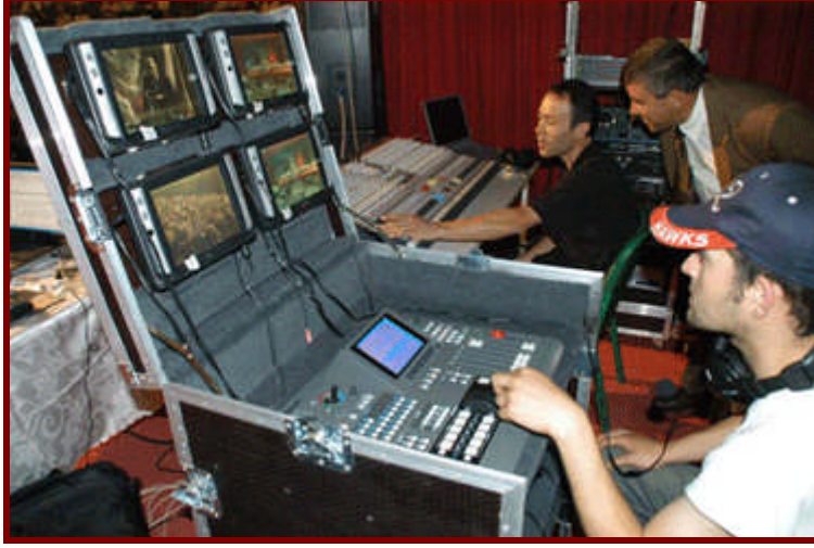
Resim 2.7: Televizyona gönderilen metinde, film kaydının her sahnesinin süresi açık olarak belirtilmesi