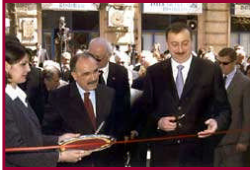
Resim 3.11: Basın kokteyli öncesi açılış töreni

Basını ve kamuoyu önderlerini kuruluşa davet ederek olumlu izlenimlerin ve ilişkilerin oluşumunu sağlayan basın kokteylleri göreve yeni atanan bir yönetici, bir yıl dönümü, kutlama, bir açılış ve yeni bir ürün tanıtımı için düzenlenir. Eğer tüm bu sayılan nedenler yoksa bile herhangi bir neden yaratılmalı ve basınla dostluk zemini oluşturulmalıdır. Çünkü basın tarafından tanınmak ve basın mensuplarının güvenini kazanmak, faaliyet alanınızla ilgili bilgiye gereksinim duyduğu zaman gazetecinin sizi araması anlamına gelmektedir.