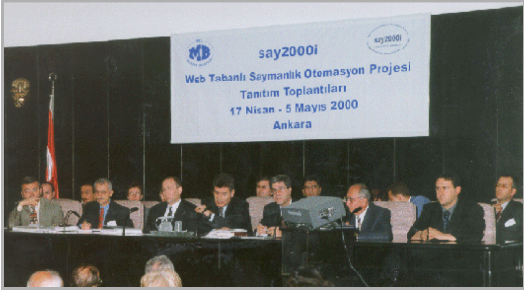
Resim 1.3: Tanıtım toplantılarının basın kurumunu daha yakından tanınmasını sağlaması