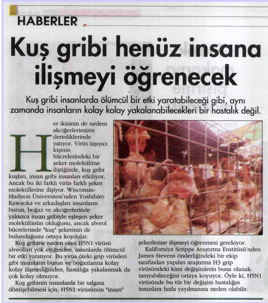
Resim 1.1: Basının kamuoyunu kuş gribine karşı bilinçlendirmesi