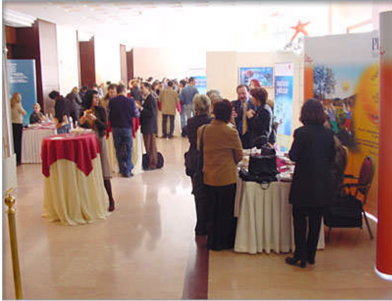
Resim 3.12: Basın kokteyllerinde yeni olan her şeyin basınla tanıştırılması