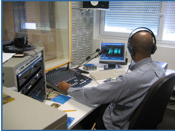
Resim 6: Radyoya gönderilen metnin üzerinde yayın süresi belirtilmesi