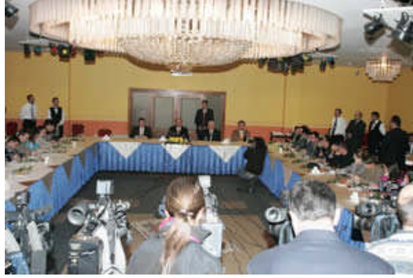
Resim 3.9: Basın toplantılarında U şeklindeki oturma düzeni