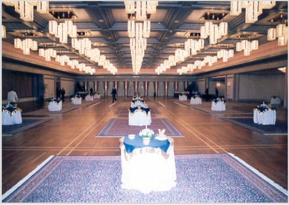
Resim 3.13: TBMM resepsiyon salonu