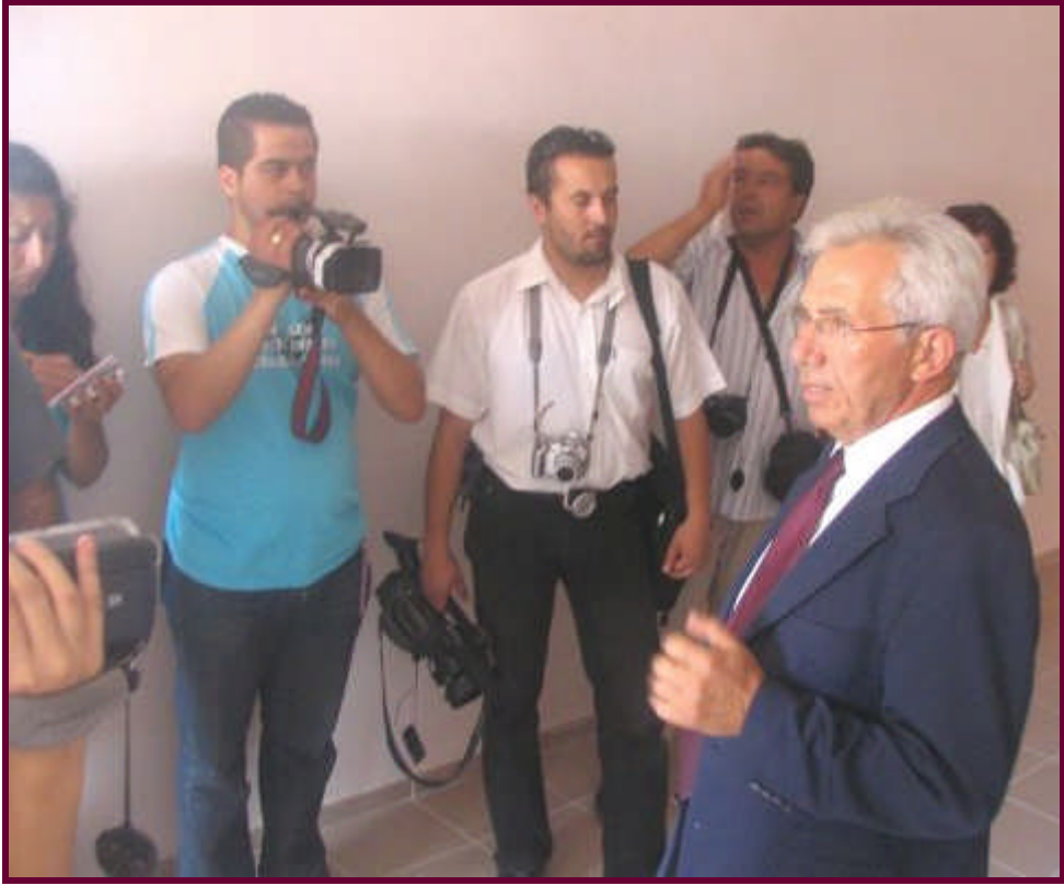
Resim 3.14: Basın gezisinden bir görünüm

Konunun uzmanları bir araya getirilerek basın belirlenen alana götürülür. Gezinin ne zaman yapılacağını, alana nasıl gidileceğini ve gezinin neden yapıldığını anlatan basına yönelik bir davet mektubu yazılarak basın ve ilgili kişiler geziye çağrılır. Organizasyonun başından sonuna kadar, basın mensuplarına eşlik edilmesi gerekir.