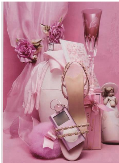
Resim 4.3: Promosyon örnekleri

Artık pek çok işletme bu yüzden halkla ilişkiler birimlerinin etkinliklerini pazarlama bakışı ile yönetmesini istemekte, bazı işletmeler ise, kurumsal tanıtım ve ürün tanıtımı ile kimliği desteklemek için “Marketing PR” olarak adlandırılan özel birimler oluşturmakta veya bu hizmeti veren halkla ilişkiler firmalarından destek almaktadır. Dolayısıyla kurum ve ürün tanıtımında halkla ilişkiler ve pazarlama artık iç içe geçmiş niteliğiyle, birbiriyle sıkı ilişki halinde olan çok yakın komşu görünümü taşımaktadır.