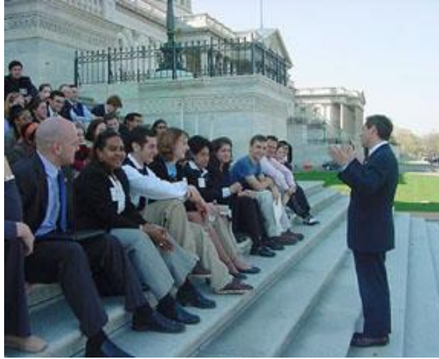
Resim 3.2:Lobicilik faaliyetleri

Meslek sendikaları çevreci dernekler, tüketici grupları vs. lobicilerden yararlanır. Amerika’da bir kongre üyesine kırkın üzerinde lobici düşmektedir. Brüksel’deki Avrupa Komisyonu koridorlarındaki lobici sayısıysa beş yüzü çoktan aşmış durumdadır.