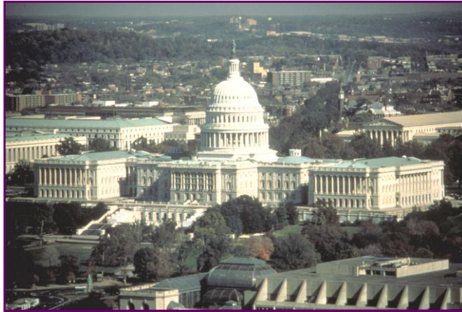
Resim 3.1: ABD kongre binası/Washington

İngilizce “lobby” kelimesinin dilimize uyarlanmış biçimi olan lobi, bir yapının kapısından içeri girildiğinde görülen ilk boşluk ya da otel, tiyatro vb. yerlerde girişe yakın geniş yer anlamlarına gelir. Kelimenin mecaz anlamı ise; bazı ortak çıkarları olan grupların temsilcilerinden oluşan topluluk şeklindedir. Lobicilik kelimesinin kaynağı ABD’de kongre binasının hemen karşısında bulunan, politikacı ve bürokratların sık sık uğradıkları Washington’daki bir otelin lobisine dayanmaktadır.