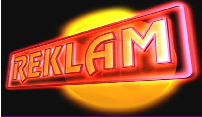
Resim1.1: Reklâm yazısı istenen yönde tutum ve davranış sağlama faaliyetleridir.

Günümüzde reklâmın çok önem kazanması ve günlük hayatın içine bu kadar girmesi farklı açılardan birçok tanımın yapılmasına imkân sağlamıştır.