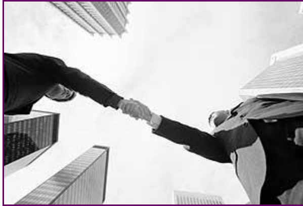
Resim 4.1: Pazarlamada her iki taraf da istekli olmalıdır.