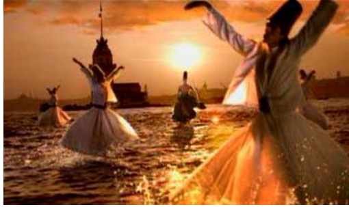
Resim 5.1: Tanıtım faaliyetleri

Tanıtım bir olay, bir birey, bir grup veya bir ürün konusundaki bilginin hedef kitlenin olumlu olarak dikkatini çekmek için haber araçları ve diğer kanallarla yayılmasıdır. Tanıtım, özel kuruluşları ve kamu kuruluşlarını bütün yönleriyle ve gerçekleriyle anlatmayı, yapı ve görevlerine ilişkin bilgi ve haberleri düzenli bir biçimde halka duyurmayı, gerektiğinde de açıklığa kavuşturmayı öngörür.