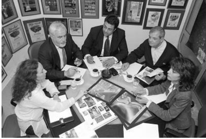
Resim 4.2:İşletmelerde pazarlama bölümü