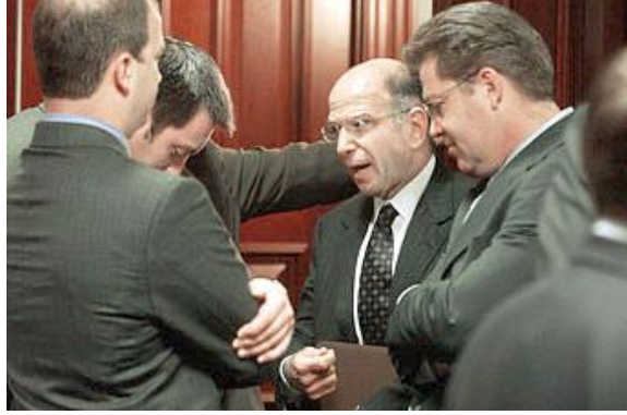
Resim 3.4: Lobiciğin çoğu kez bir siyasi amacı

Lobi faaliyetlerini yürüten grupların hepsi de kamu yararına çalıştığını söyler. Bu durum kamu yararı kavramının kişiden kişiye değiştiğinin bir göstergesidir. Karar mekanizmasının verdiği kararın hangi grup başarılı lobicilik faaliyeti yürüttüyse onun istediği yönde olacağı düşüncesi lobicilik faaliyetinin hem önemine hem de sakıncalarına dikkat çekmektedir.