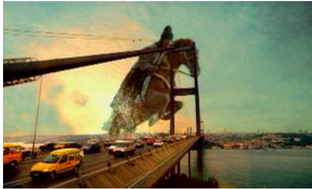
Resim 5.2: Türkiye, Avrupa'nın doğuya açılan penceresidir.