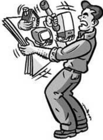
Şekil 4.1: Ürünün satışını kolaylaştırma çabası olan promosyon

Halkla ilişkilere yakın bir diđer kavram da promosyondur. Promosyon, belirli bir ürünün satışını kolaylaştırmak amacıyla yapılan çeşitli teşvik ve özendirme çabalarıdır. Bir ürün ya da hizmetin albenili satışa sunumu ( görsel yanı ağır basan ambalajların ya da fuar mankenlerinin satış teşviki ) ya da bir armağan eşliğinde ürünün satışa sunumu ( gazete promosyonu ya da promosyon olarak bardak veren ton balığı konservesi ) promosyondur. Promosyon kavramının halkla ilişkilerden en önemli farklılığı, ürünün ya da hizmetin satışına doğrudan katkı sağlamasındadır.