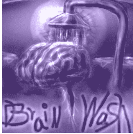
Resim 2.2: Propaganda bir beyin yıkama çalışması