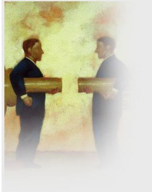
Resim 3.5: Yasa koyucuya yapılacak baskı ahlaki sayılamaz.

Lobicilik karar mekanizmalarını bilgilendirme yöntemidir. Halkla ilişkilerin temel düşüncesinden ayrılırsa, nüfuzun kötüye kullanılması ya da bir tür rüşvet sonucu doğurabilecektir. Zira kişisel çıkarlar için yasa koyucuya yapılacak baskı ahlaki sayılamaz.