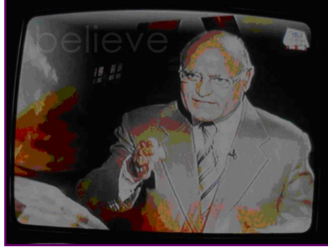
Resim 2.1: Propaganda kitle iletişim araçlarından yararlanma

Literatürde siyah, gri ve beyaz propaganda olarak bir ayrım yapılmaktadır. Beyaz propaganda doğru olarak görülen bilgilerin yayılmasını içerirken, gri propaganda şüphe edilecek nitelikteki iddiaların yayılmasını içermekte ve bu yapılırken bilgi ve bilgi kaynağı arasında sıkı bir bağlantı yapılmaktan kaçınılmaktadır. Siyah propaganda ise, yanlış bilgileri yayan propagandacının kimliğinin belirtilmemesini içermektedir.