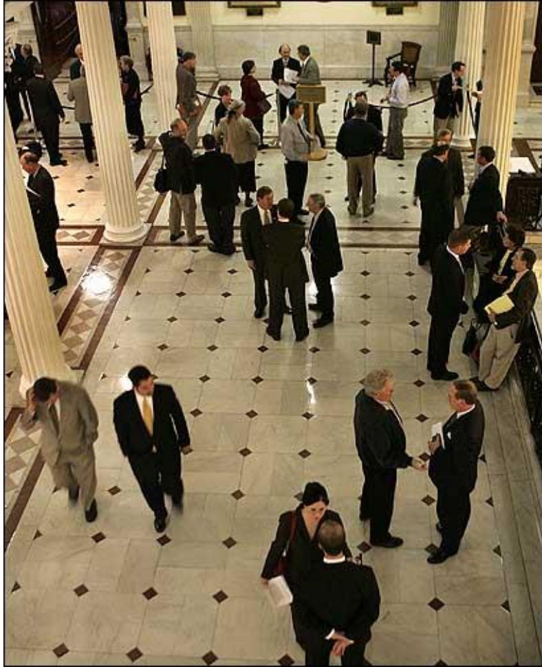
Resim 3.3: Lobicilik faaliyetleri