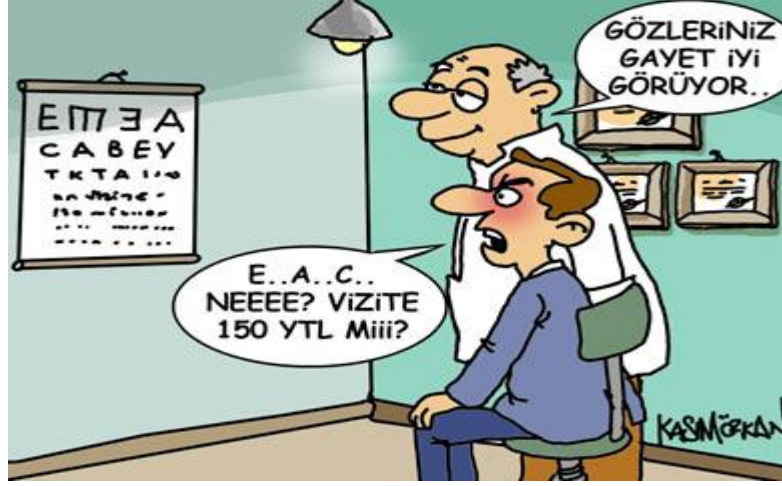
Resim 1.6: Sigortalı olmayan birini vizite karşısında durumu

Artık hepimizin bildiği gibi trafik kazalarında "trafik kazası tespit tutanağı"nın bulunması hasarın tazmini için mutlaka gerekmektedir. Bu, yaralamalı kazalar için de geçerlidir. Çünkü aracı kullananın kusuru olmadan meydana gelen bir yaralanma olayında trafik poliçesinden herhangi bir talepte bulunulamaz. Aracı kullananın kusur durumunu da ancak tutulacak zabıt ile görmek mümkün olacaktır. Trafik kazası tespit tutanağı ile birlikte sürücünün alkol durumunu gösteren rapor, aracın ruhsat örneği ve sürücünün ehliyetinin de ibraz edilmesi şarttır. Diğer yandan yaralanan kişinin tedavi giderlerini gösteren faturalar, hastane/doktor raporları ve eğer maluliyet söz konusu ise iş gücü kaybı oranını gösteren hastane heyet raporunun da tazminat talebinde ibrazı zorunludur.