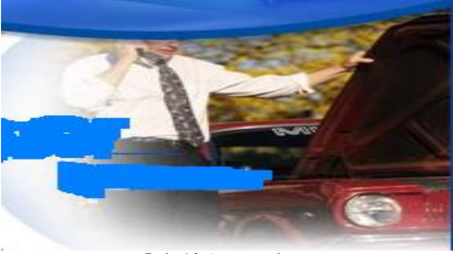
Resim 1.2: Aracın arızalanması