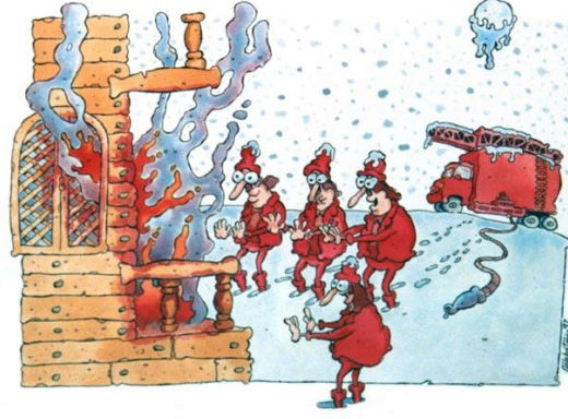
Resim 1.3: Soğuk bir günde çıkan bir yangına itfaiye ekibinin müdahale çalışmaları

olmaması ve maddi zararlarının karşılanması amaçlanır. Bunun için sigortalı/sigorta ettirenin hasar durumunda dikkat etmesi gereken konular: