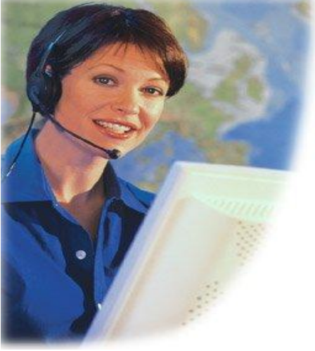
Resim 1.1: Telefonla hasar ihbarı alan şirket görevlisi