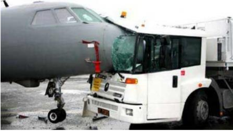
Resim 1.4: Bir nakliye aracının kaza yapması sonucu taşıdığı emtianın zarar görmesi