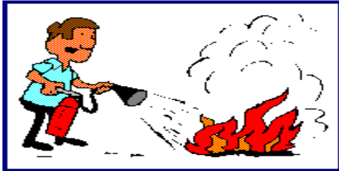
Resim 1.7: Yangına sigortalının anında müdahalesi