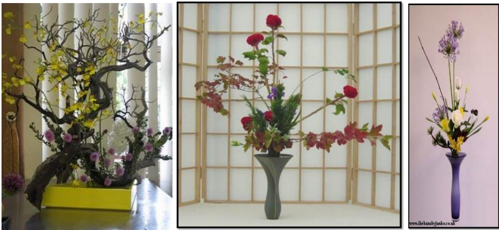
Resim 2.3: Rikka stiline örnekler

Batı kültüründe çiçek yetiştirmek, sistematik olarak bir vazo veya saksıda çiçek bakımını kapsamaktadır. Japon kültüründe ise ikebana (çiçeği yaşatma sanatı) biraz daha karmaşıktır. Ikenobo, Sogetsu ve Ohara şeklinde ikebana öğretilerini konu alan birçok okul mevcuttur. Bunların dışında da değişik stillerde ve bitkilere göre eğitim veren okullar da mevcuttur.