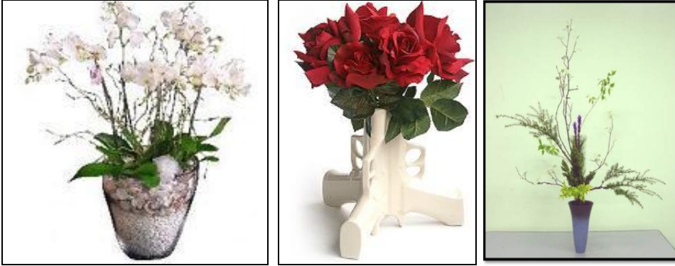
Resim 2.4: Değişik tiplerde vazolar

Çeşitli malzemelerden yapılmış vazolar, ağaç dalları, kamışlar, tel, ip, kumaş parçaları, makas, bıçak vs. kullanılır.