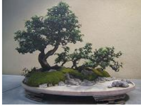
Resim 5.2: Doğa manzarası

Birkaç tutam ot ya da kamışla, bir iki su leylağı veya su kıyısına yerleştirilmiş kara çiçekleriyle belirli bir doğa manzarasının anımsatılması amaçlanır. Ayrıca amaçta, bu düzeni seyreden kişinin kurgu gücü test edilmek istenmektedir.