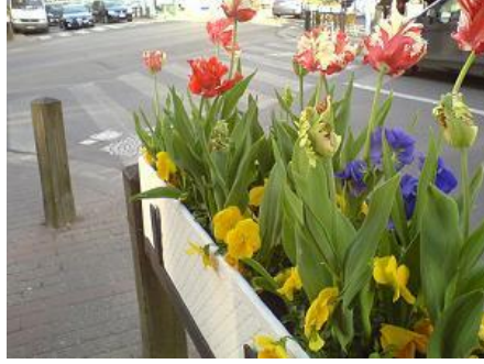
Resim 1.2: Ankara’da çiçek ve bitki süslemeleri yapılmış bir manzara

Çiçekler her zaman zarafetin, güzelliğin, kibarlığın ve medeniyetin temsilcisi olmuştur. Çünkü çiçek sevgisi uygarlığın temel ölçütlerinden biri, kültürün bir boyutudur.