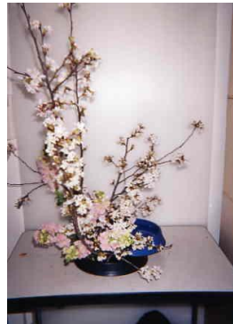
Resim 1.3: Ortama uygun yapılan bir çalışma

Çiçekler ve dallar vazolara belli kurallara göre yerleştirilir. Çiçek düzenleme sabır ve zaman isteyen bir iştir.