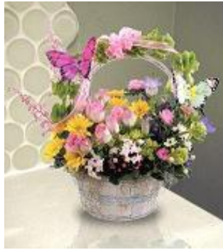
Resim 1. 14: Ortama uygun ahenkte çiçekler

Yemek odası için yapacağımız düzenlemelerde ise çiçekler yemek masasının ortasına ya da kenarına konulur. Kullanılan kap ve çiçekler yemek takımına, masa örtüsüne, perdelere ve halılara uygun olmalıdır. Masada oturan insanların birbirini görebilmeleri için çiçek düzeninin yüksek olmamasına dikkat edilmelidir. Çiçekler kokusuz olmalı, her yandan görünecek şekilde yerleştirilmelidir.