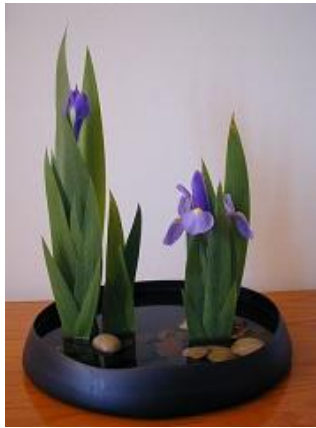
Resim 5.3: Sade bir çalışma

Kara parçası ormanlık, ova ya da dağlık olabilir. Bir yarımada veya bir nehir kıyısı izlenimi de verebilir.