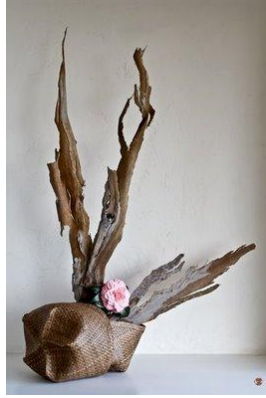
Resim 1.4: Dikey düzenleme