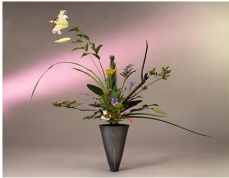
Resim 2.1: Rikka shofutai stiline bir örnek

Rikka Shofutai tarzı; ikebananın en kuralcı stildir. Kendine özgü bir karakteri vardır. Doğal peyzajın güzelliğini ifade eder. Bu geleneksel tarz sıkı kurallara dayanır ve özel teknikler kullanılır. Bu tarz, farklı karakterde dokuz ana daldan oluşmaktadır. Bu dallar açıları, uzunlukları ve yönleriyle doğal peyzajı anlatan bir uyum oluştururlar.