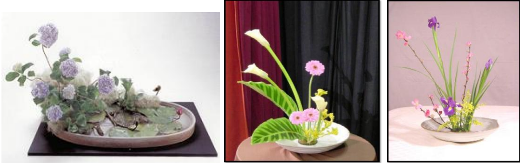
Resim 5.4: Moribana stiline örnekler

Dağ ve kaya görüntüleri taşlarla oluşturulabilir. Karadan suya doğru bir eğilim verilmek istenirse bu giderek alçalan bitkiler, yosunlar ve otlarla ve oraya buraya serpiştirilen taşlarla yapılır. Suyun içine yerleştirilen bir taş dalgaların yaladığı kayalıkları çağrıştırır.