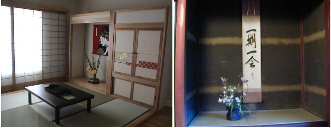
Resim 3.6: Tokonama (oyuklar)