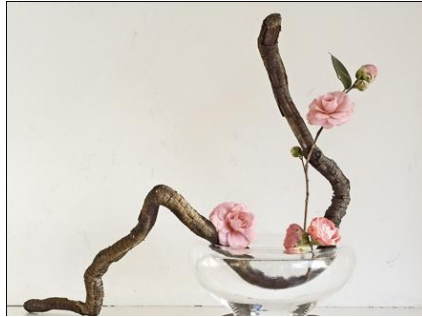
Resim 1.6: S şeklinde düzenleme