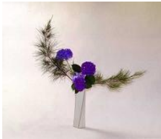
Resim 4.5: Uzun vazolara ve sade olarak yapılan bir çalışma

Uzun vazolara yapılır. Çiçekler ve dalları vazolara yerleştirirken aşağıya doğru fazlaca akması gerekir. Bunun tam aksine bitkilerin üstte kalan kısımları kısa olmalıdır.