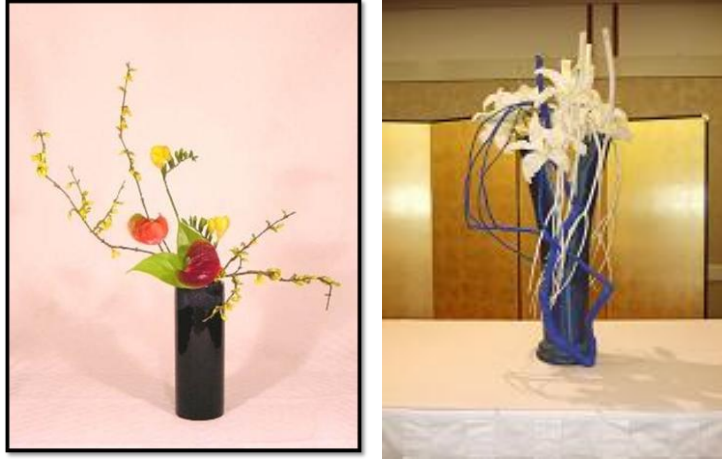
Resim 4.2: Vazodan sarkan dallar

Bir desteğe bağılı olmadan duran dallar ya da çiçekler vazonun kenarından aşağıya sarmaktadır. Bu düzenlemede dalın aşağı sarkan bölümü uzun, dik bölümü ise kısa tutulur. Oluşturulan yapıt, esintiyle savruluyormuş izlenimi verir. Dalları yerleştirilirken diğer stillerde kullanılan kenzan (çiçeklerin içine sıkıca yerleştirildiği obje) kullanılmaz. Vazodan sarkan dal aşağıya doğru akıyormuş gibidir. Bu stilde genellikle silindirik, uzun ve dar ağızlı vazolar kullanılır.