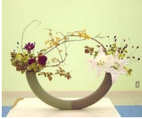
Resim 1.12: Bir hat kullanılmış düzenleme

çok hat bir araya gelir. Kimi zaman yeni ay ya da S şeklinde tek bir hatla aynı sonuca ulaşılır.