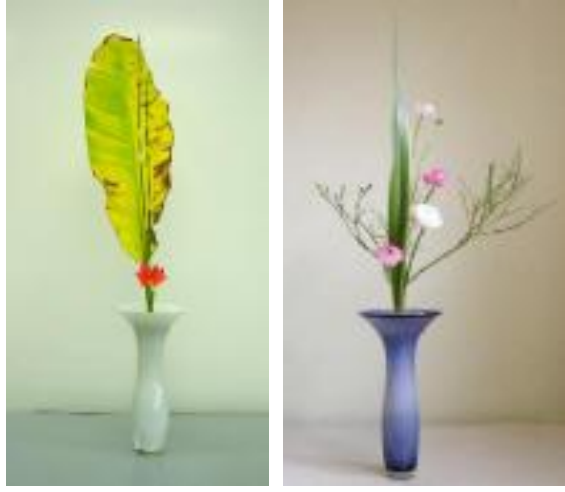
Resim 3.3: Kurallı seika stili