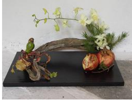
Resim 1.7: Yatay düzenleme