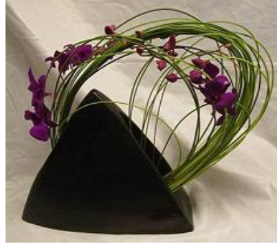
Resim 1.8: Yuvarlak şekilde düzenleme