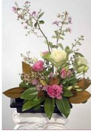
Resim 1.11: İlgi merkezi çiçeğin her tarafında

İlgi merkezinin oluşturulmasında aşağıdaki konulara dikkat edilmelidir: