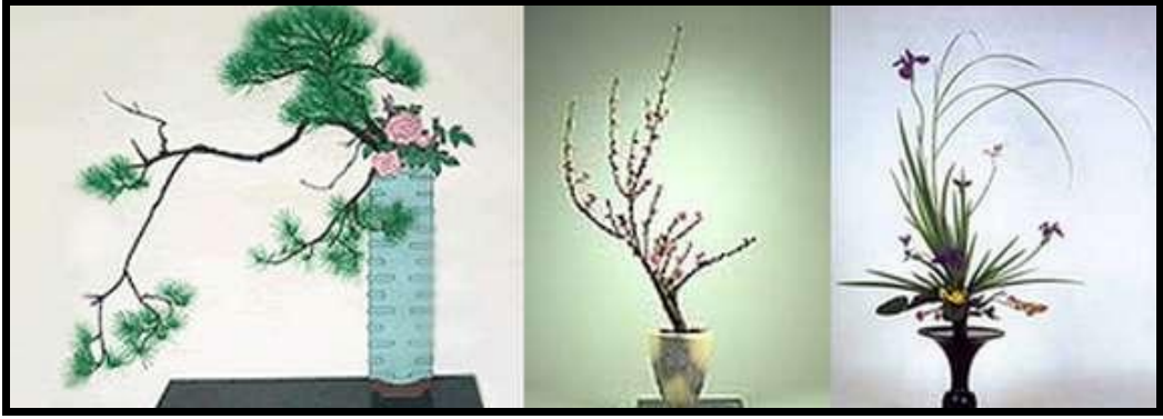
Resim 2.3: Rikka stiline örnekler