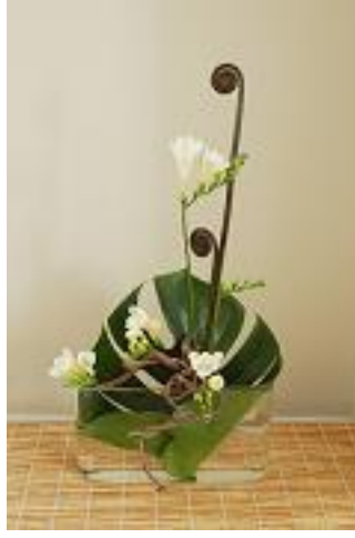
Resim 3.5: Yarı kurallı seika