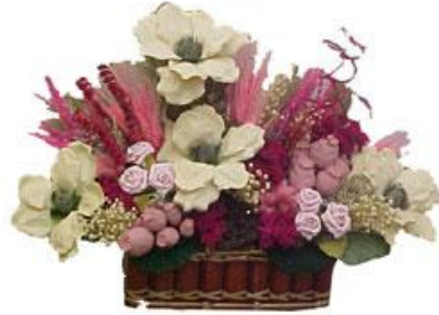
Resim 1.13: Kompozisyondaki renk ve şekil dengesi