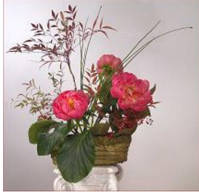
Resim 1.10: Ölçülü bir düzenleme