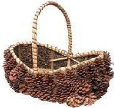
Resim 4.3: İkebanada kullanılan sepet

Bu işlemden çeşitli vazolar, kaplar, sepetler ana malzeme olarak alınır. Bitki olarak, kalın dallar, hafif dallar ve çiçekler kullanılır. Ayrıca sarmaşık ve eğilebilen bitkilerle birlikte bıçak, makas, ip kumaş vs. kullanılır.