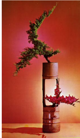
Resim 1.1: Sadeliğin simgesi ikebana

Doğanın bir parçası olan çiçekleri etrafımızdaki herkesle paylaşabiliriz. Bu bize büyük bir mutluluk verir. İnsanların yaşamı ne kadar zorlaşırsa zorlaşsın, bu aşamada uzatılacak bir çiçek, insanlara yaşama sevinci verecektir.