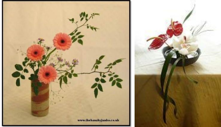
Resim 4.1: Aşağı doğru eğilen dal

Bitkinin aşağıya sarktığı düzenlemelerde eğilmiş olan dal çevreye esneklikle aktığı izlenimi verdiği için “akan dal” denir.