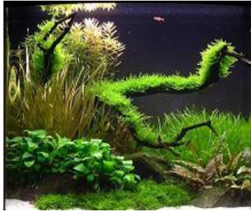
Resim 5.1: Manzara çalışması

Çağımızda en çok kullanılan ikebana çeşididir. İkebananın en basit stilidir. Bu düzenleme şekli bir manzara ya da minyatür bir bahçe hazırlama isteğiyle doğmuştur. Gök, insan ve toprak simgesi, moribana stilinde en önemli üç unsur olarak karşımıza çıkar.