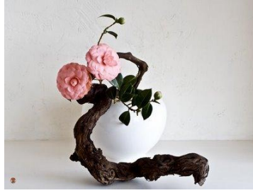
Resim 1.5: L şeklinde düzenleme