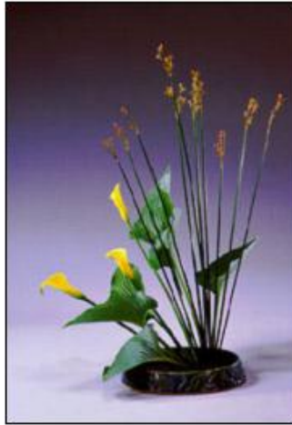
Resim 3.2: Seikada çiçeklerin çıkışı (dik)

Düzenlemedeki dalların oluşturduğu üçgenin esnek biçimde kaydırılmasına göre seika üçe ayrılır.