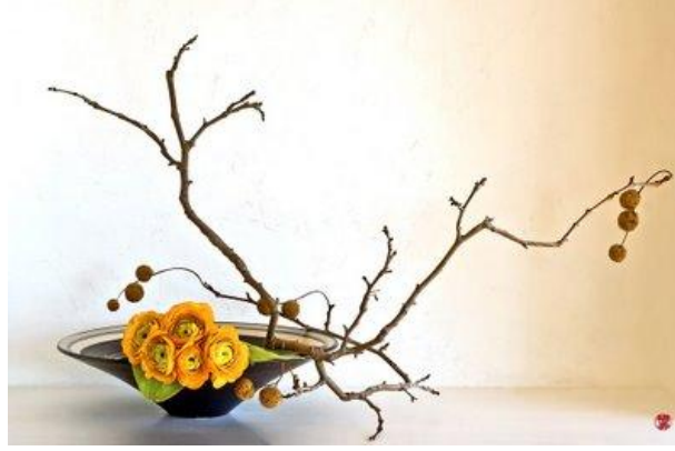
Resim 3.7: Ortadaki dala bağlı diğer dallar

En önemli dal “so” dalıdır. Yani ortadaki daldır. Çünkü diğer dallar genellikle bu “so” dalına bağlanır. Değişik biçim ve türlerin her biri ayrı bir işlem gerektirdiği için çiçek düzenlemedeki işlemlerin sırasında bundan başka katı kural yoktur. “so” nun ortada olması, temel biçim bulunduktan sonra bu yapıya birçok yan dallar eklenebilir.