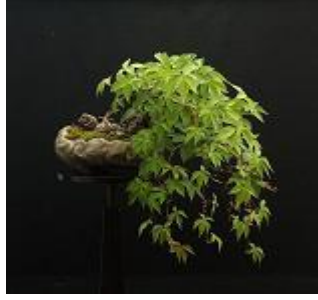
Resim 4.4: İkebanada kullanılan çeşitli sarmaşıklar