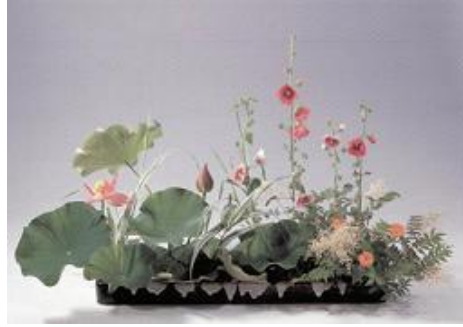
Resim 1.9: Yelpaze şeklinde düzenleme