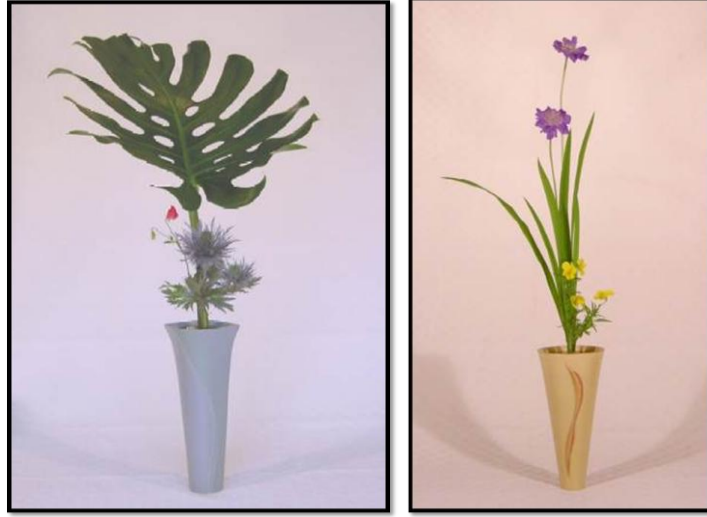
Resim 3.1: Seika stiline örnekler