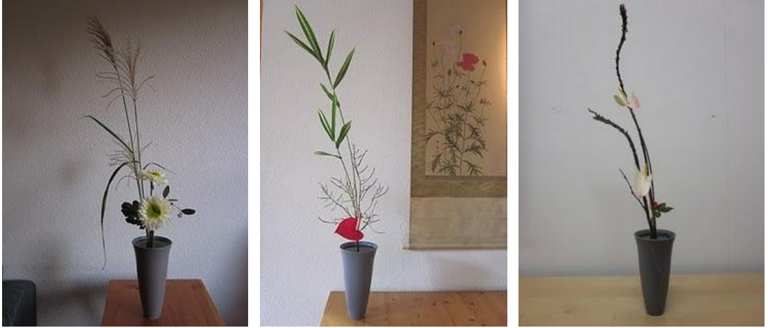
Resim 2.2: Rikka shimputai stiline örnekler

Shoka shimputaide ana hatları bir destek kök veya dala sahiptir. Çok az kural, daha özgür ve daha önceki stiline göre duygu ve ışık vardır. Ancak egzotik çiçekler içerebilir. Malzeme iyi seçilmelidir.