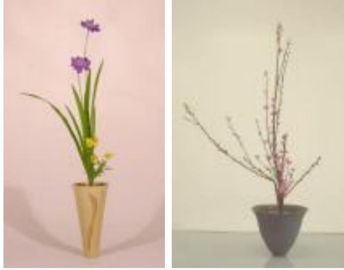
Resim 3.7: Kuralsız seika stili