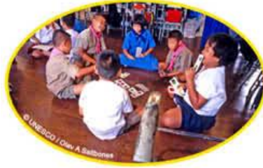
Resim 1.19: Küçük grup çalışması