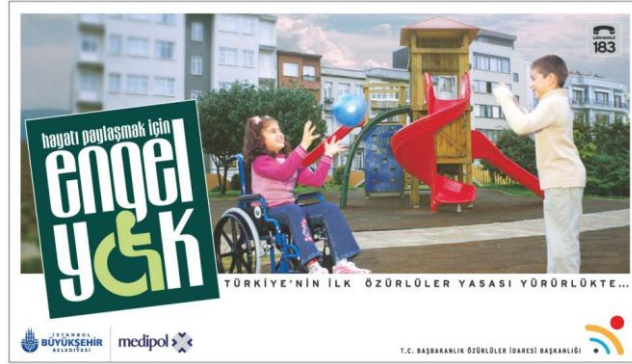
Resim 2.4: T.C. Başbakanlık Özürlüler İdaresi Başkanlığı tarafından hazırlanmış afiş

Aile ve Sosyal Politikalar Bakanlığı'na tarafından sunulan hizmetler ise Özel Rehabilitasyon ve Eğitim Hizmetleridir. Bu kuruluşların işleyişi, Sosyal Hizmetler ve Çocuk Esirgeme Kurumu Genel Müdürlüğü'ne bağlı Özel Eğitim Hizmetleri, Özel Rehabilitasyon ve Eğitim Merkezleri Yönetmeliği doğrultusunda sürdürülmektedir.