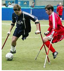
Resim 1.25: Koltuk değnekleriyle oyun oynamanın zorluğu

Sınıf içinde diđer çocuklar ve kaynaştırma eğitimi alan öđrenci arasındaki iletişimi aktifleştirecek sosyal aktiviteler düzenlenmesi, küçük grup çalışmaları yapılması, sınıf içindeki diđer öđrencilerin engelli arkadaşları ile empati kurmalarını sağlayacak etkinlik ya da oyunlar düzenlenmesi yararlı olacaktır.