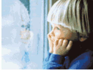
Resim 1.22: Otistik çocuk

Otistik ve duygusal uyum güçlüđu olan öğrencilerin değerlendirilmeleri, öğrencilerin hazır oldukları zamanlarda yapılır.