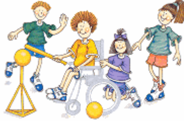
Resim 1.24: Kaynaştırma öđrencisinin yaparak yaşayarak öğrenmesine fırsat tanınmalıdır.

Etkili sınıf yönetimine ek olarak örnek uygulamalar ve yaparak yaşayarak öğrenme yöntemlerine daha sık yer verilmelidir. Kaynaştırma öđrencisine yönelik özel etkinlik düzenlemekten çok, sınıfça yapılan etkinliklere katılımını sağlamak esas olmalıdır.