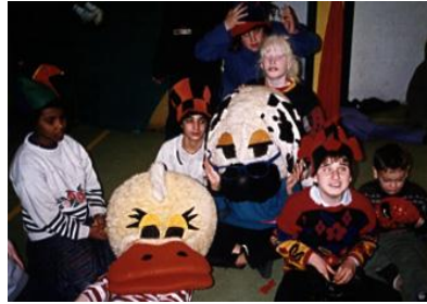
Resim 2.9: Kaynaştırma sınıfı

Kaynaştırma öğrencisi bulunan erken çocukluk eğitimi kurumu öğretmeni, çocuğun özel eğitim aldığı kurumdan gelen raporu inceler ve Bireyselleştirilmiş Eğitim Planı Geliştirme Birimi'nce hazırlanmış BEP doğrultusunda Bireyselleştirilmiş Öğretim Planı hazırlar. BÖP hazırlığında uzun ve kısa dönemli amaçları belirlemeden önce çocuğun şu andaki mevcut performansına bakarak hangi gelişim alanında, hangi yaş grubunun, hangi hedef davranışlarını gösterdiğini belirlemelidir. Daha sonra bu hedef davranışın bir üst davranışını kazandırmayı BÖP planına amaç olarak yerleştirmelidir. Bireyselleştirilmiş Öğretim Planı'nda bulunması gerekenleri şu şekilde sıralayabiliriz: