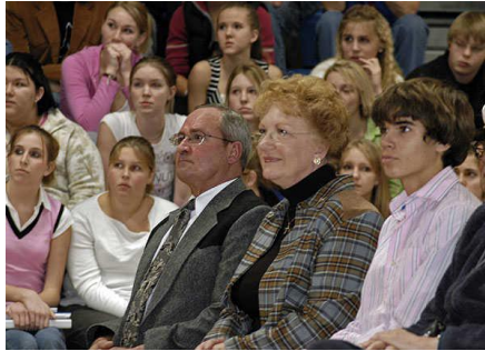
Resim 1.13: Ailelerle toplantıda anne-babaların yanı sıra kardeşler de bulunabilir.

Kaynaştırma eğitiminde ailelere önemli görevler düşmektedir. Bu nedenle kaynaştırma eğitimine katılacak özel gereksinimli çocuğun ailesi ve sınıfta bulunan diğer çocukların aileleri ile görüşmeler düzenlenmeli, mevcut durum ve karşılaşılabilecek olası problemler hakkında bilgilendirilmelidir. Kaynaştırma eğitimi süresince de bu toplantılara devam edilmeli, ailelerden bilgi alınmalı, gelişmeler hakkında aileler bilgilendirilmeli ve uygulamanın başarılı olduğu yönler örneklerle gösterilerek ailenin istekli olması sağlanmalıdır. Kaynaştırma eğitimi sürecinde normal gelişim gösteren çocukların aileleri de durum konusunda bilgilendirilmeleri ve gerekli toplantılara katılmaları sağlanmalıdır. Okulda yapılan çalışmalara ailenin destek ve iş birliğini sağlamak iyi bir kaynaştırma eğitimi için zemin sağlayacaktır.