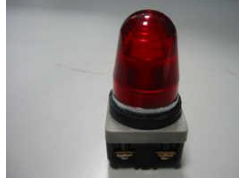
Resim 1.10: Teneffüs saatlerini bildiren ışıklı alarm