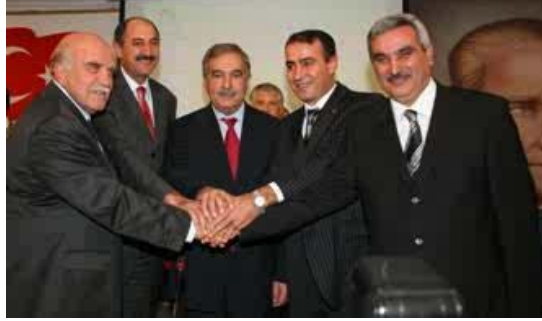
Resim 2.5: Milli Prodktivite Merkezi, Trkiye İř Kurumu Genel Mdrlę ve İř Saęlıęı ve Gvenlięi Genel Mdrlę yetkilileri ile protokollerin imzalanması treni

Engellilerin alıřabileceęi iř alanları, engellilerin istihdam edilmesinde zel gereksinim cinsi ve derecesinin yanı sıra, aldıkları mesleki eęitim ve kursların da gz nnde bulundurulması alıřma hayatındaki bařarılarını arttıracak ve kendilerine gven duymalarını saęlayacaktır.