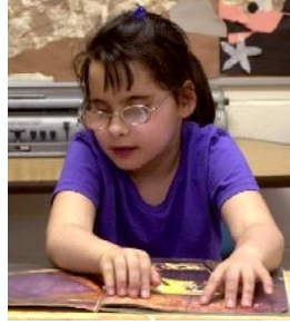
Resim 2.8: Az gören kaynaştırma öğrencisi

Kaynaştırma uygulamaları yapılan okul ve kurumlarda, kaynaştırma eğitimini ve özel eğitim gerektiren kaynaştırma öğrencileri için bireyselleştirilmiş eğitim programını geliştirmek, uygulamak, izlemek ve değerlendirmek için bireyselleştirilmiş eğitim programı geliştirme birimi oluşturulur.