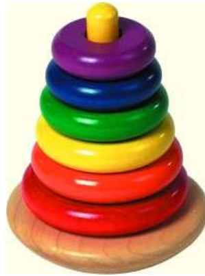
Resim 1.18: Verilen ipuçları yaşantısının içinden, onun tanıdığı nesne ve olaylardan seçilmelidir.