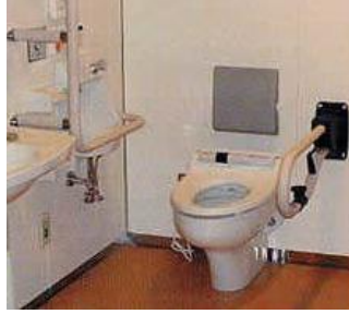
Resim 1.7: Kaynaştırma eğitimi uygulanan okulda ortopedik engelli öğrenci için düzenleme yapılmış tuvalet ve lavabolar