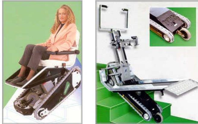
Resim 1.8: Ortopedik engelliler için merdiven çıkmayı ve inmeyi sağlayan özel taşıyıcı sandalye