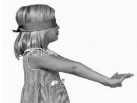
Resim 1.26: Körebe oyunu

Örneđin, sınıfında görme engelli öđrencisi olan öđretmen, sınıfındaki diđer öđrencilerin de katılımıyla “körebe oyunu” ya da “görmeden tanı” oyunu oynatarak diđer çocukların görme engelli arkadaşlarının ne gibi zorluklar yaşadığını anlamalarına yardımcı olabilir.