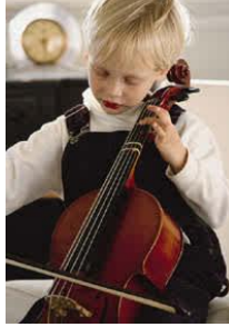
Resim 1.4: Üstün ve özel yetenekli çocuk

Akademik alanda ve/veya sanat alanındaki yetenekleri açısından akranlarına göre üst düzeyde performans gösterme durumunu ifade eder.