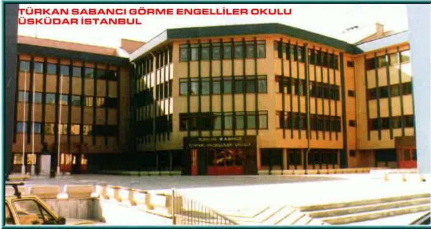
Resim 2.1: Türkan Sabancı Görme Engelliler Okulu

Özel eğitim okulları, erken çocukluk eğitiminden başlayarak yükseköğrenime kadar her düzeyde açılan ve özel eğitim gerektiren bireylerin bir arada eğitim aldıkları kurumlardır. Tanımından da anlaşılacağı gibi özel eğitim okulları doğrudan kaynaştırma eğitiminin uygulandığı kurumlar değildir. Bu kurumlarda sadece herhangi bir nedenle normal çocuklardan farklı olan çocuklara eğitim verilmektedir.