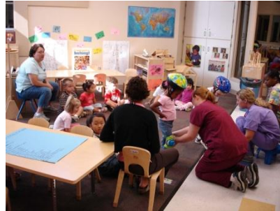
Resim 1.16: Kaynaştırma öğrencisi için hazırlanan BEP doğrultusunda okulun mevcut programı uygulanır.