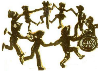
Resim 1.1: Kaynaştırma öğrencisi normal gelişim gösteren çocuklarla birlikte etkinliklere katılmalıdır.