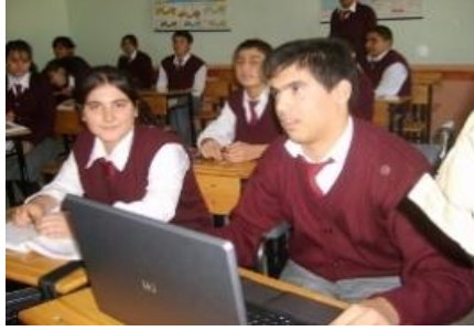
Resim 1.6: Kaynaştırma öğrencisi