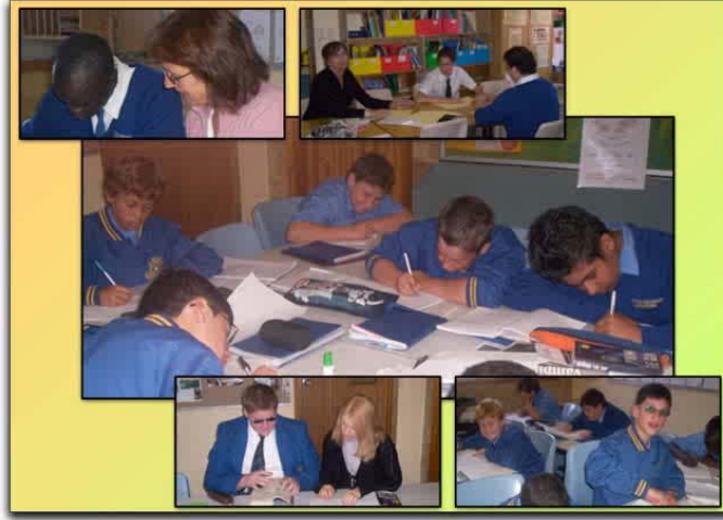
Resim 1.23: Kaynaştırma eğitiminde grup çalışması