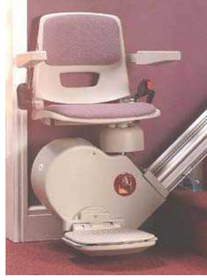
Resim 1.9: Ortopedik engelliler için tasarlanmış bu sandalye lift, merdiven ve meyil çıkımlarında onlara kolaylık sağlayacaktır.