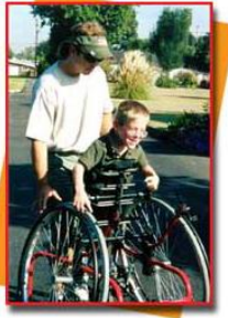
Resim 1.3:Ortopedik engelli

Bedensel engelli çocukların sınıflaması engelin derecesine göre hafif derecede yetersizlik, orta derecede yetersizlik ve ağır derecede yetersizlik olmak üzere üç grupta toplanmaktadır. İkinci bir sınıflama ise engelin olduğu yere göre merkezi sinir sistemi ile ilgili yetersizlikler ve kas iskelet sistemi ile ilgili yetersizlikler olmak üzere iki grupta toplanabilir.