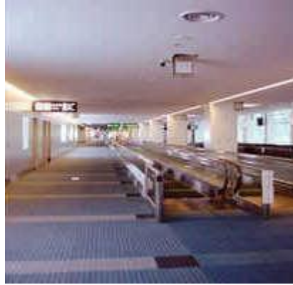
Resim 1.11: İşitme engelli öğrenciler için koridora elektronik yazı panoları yerleştirilebilir.