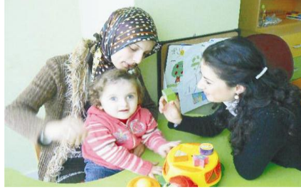
Resim 1.15: Uzun dönemli ve kısa dönemli hedeflere sınıf içi etkinliklerle ulaşılabilir.

Kısa dönemli amaçlar hazırlanırken, “Bireyin şu andaki performans düzeyinden, uzun dönemli amaçlara ulaşabilmesi için hangi aşamaları yerine getirmesi gerekir?” “Uzun dönemli hedefe ulaşmak için öğrencinin ne yapmasını gerekli görüyorsunuz?” ya da “Hedeflere ulaşmak için temel noktalar nelerdir?” sorularına cevap aranmalıdır. Kısa dönemli hedeflerin belirlenmesinde amacımız, öğrencinin var olan performans düzeyi ile yıllık hedefler arasında ölçülebilir, gözlenebilir adımları planlamaktır.