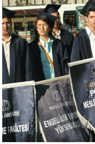
Resim 2.3: Engelliler Entegre Yüksekokulu 2005 mezuniyeti

Engelliler Entegre Yüksekokulu 1993-1994 eğitim-öğretim yılında faaliyete geçmiştir. Uygulamalı Güzel Sanatlar Bölümünde, Grafik Sanatları Lisans Programı, Seramik Sanatları Lisans Programı; İdari Meslekler Bölümünde, Bilgisayar Operatörlüğü Ön Lisans Programı; Mimarlık Bölümünde, Yapı Ressamlığı Ön Lisans Programlarında eğitim verilmektedir. Bünyesinde bulunan bölümler, işitme engelli bireylerin eğitim gereksinimlerini karşılayabilecek teknoloji ile donatılmıştır. Engelliler Entegre Yüksekokulu'nun amacı, özel eğitime muhtaç engellilere engel türlerine uyan meslek programlarında eğitim vermek, onların topluma üretken bireyler olarak katılmalarını sağlamaktır.