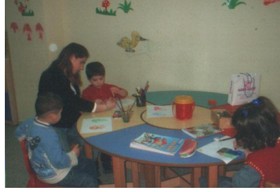
Resim 1.2: Özel eğitim gerektiren öğrenciler her sınıfa eşit olarak dağıtılır.