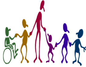
Resim 1.20: Engelli birey de uygulamaların içinde olmalıdır.

Öğretmenin, kendisini merkezden çıkarıp yönlendirici konumuna çekerek oluşturduğu öğretim stratejisine, "keşfetme (buluş) yoluyla öğretim yaklaşımı" denmektedir. Burada öğretmenin görevi, sorulan soru ve verilen örneklerle öğrencileri öğrenmeye hazır hale getirerek öğrencilerin konuyu analiz ve sentez yoluyla geliştirmelerini ve pekiştiricilerle öğrencilerin konu hedeflerine ulaşmalarını sağlamaktır.