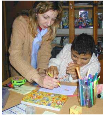
Resim 1.17: Demostrasyon