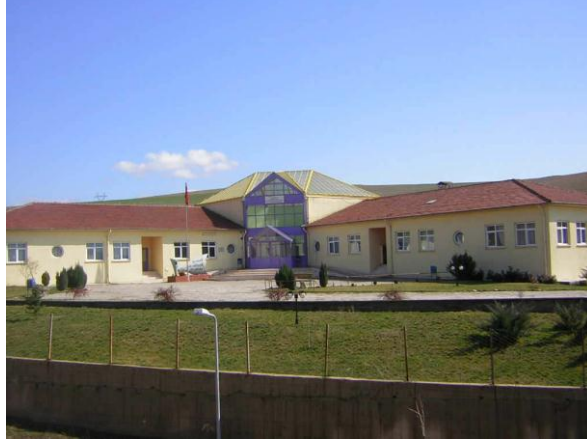
Resim 2.2: Safranbolu Hasan Gemici Eğitim Uygulama Okulu ve İş Eğitim Merkezi - Zihinsel Engelliler Okulu

Ancak özel eğitim kurumu dolaylı olarak kaynaştırma eğitimine destek olmaktadır. Kaynaştırma eğitimi alan bir öğrenci, aynı zamanda da bir özel eğitim kurumundan destek eğitimi alabilir. Bu süre zarfında özel eğitim okulundaki öğretmen ile çocuğun kaynaştırma eğitimi aldığı okul öğretmeni arasında sıkı bir iş birliği söz konusudur. Bazen de kaynaştırma eğitimi alan çocuğun ayrıca bir özel eğitim okulundan destek eğitimi almasına gerek olmadığı durumlar vardır. Yine de kaynaştırma öğrencisi olan okulun öğretmeninin, çocuğun daha önceden eğitim aldığı özel eğitim kurumu ile iş birliği içinde olması faydalı olacaktır. Bu sayede öğrencisini daha iyi tanıyabilecek, olumsuzlukların nedenlerini daha çabuk bulabilecektir.