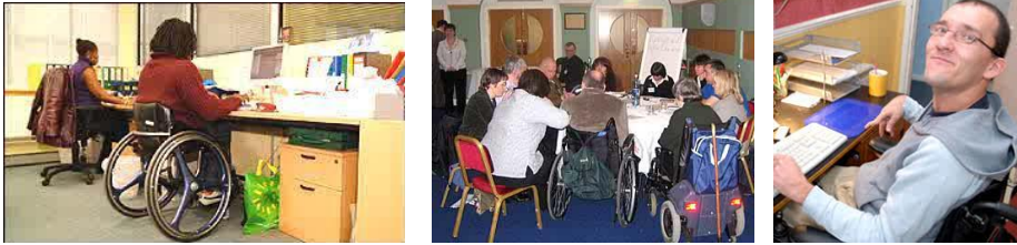
Resim 2.7: Bedensel engelliler ve çalışma mekanları