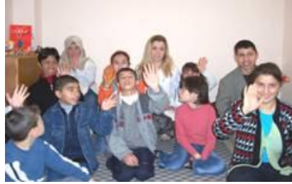
Resim 1.5: Kaynaştırma eğitiminde görev alacak öğretmen aileler ve öğrencilerle görüşmeler düzenlenmelidir.

Sınıfında kaynaştırma çocuğu bulunan öğretmenler için yapılması gereken bazı hazırlıkları aşağıdaki şekilde sıralamak mümkündür: