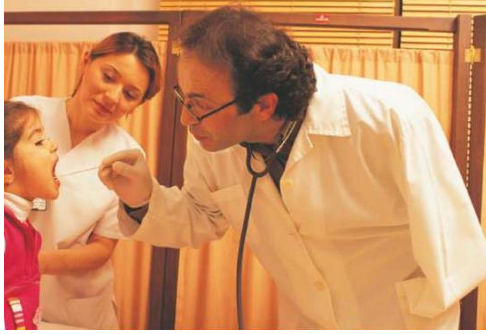
Resim 2.6: Gerekli imkanlar saęlandıęında engelliler de birok iř alanında grev yapabilirler.

Engellilerin alıřabileceęi iř alanları, engellilerin istihdam edilmesinde zel gereksinim cinsi ve derecesinin yanı sıra, aldıkları mesleki eęitim ve kursların da gz nnde bulundurulması alıřma hayatındaki bařarılarını arttıracak ve kendilerine gven duymalarını saęlayacaktır.