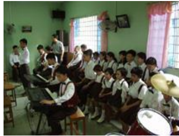
Resim 1.14: İlgi ve becerileri doğrultusunda sınıf içi aktivitelerde görev alması sağlanabilir.

Öğrencinin var olan performansı, onun yeterli ve yetersiz olduğu alanlar hakkında temel bilgileri oluşturur. Bu bilgiler onun eğitsel programının düzenlenmesine yardımcı olur. Uzun dönemli amaçların belirlenmesi ve uygulanması, var olan performansın doğru olarak belirlenmesine bağlıdır. Bireyin o anki performans düzeyi, öğretime hangi noktadan başlanacağını belirtir. Örneğin, öğrenci 1'er 1'er 100'e kadar sayabilmektedir. Öğrenci için bir sonraki uygun basamak ifadesi, “10'ar 10'ar 100'e kadar sayar.” olabilir.