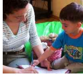
Resim 11: Bebek bakıcısı

Konukların tatillerini mutlu ve huzurlu geçirmeleri bir otelin en büyük referansıdır. Otel bünyesinde çocuklu aileler için hazırlanmış özel alanlar yaratılmıştır. Çocukların gündüzleri hem eğlenip hem de güvende olabilecekleri klüpler, eğlence odaları ve gündüz bakımevleri oluşturulmuştur. Konuklar çocuğuna güvenle bakabilecek özel eğitilmiş personeli, ekstra bir ücret ödeyerek talep edebilirler. Burada dikkat edilecek nokta, bebek bakıcısı hizmeti verecek olan kişinin bu iş için eğitilmiş olması ve güvenli olmasıdır. Bebek bakıcısı hizmeti veren oteller, özellikle çocuklu aileler tarafından tercih edilmektedir.