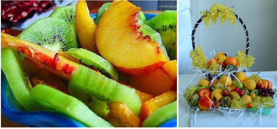
Resim 39: Meyve ikramı