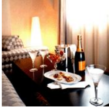
Resim 38: Şampanya Servisi

VIP, Repeat Guests ve benzeri konuklarımızın check-in işleminden önce işletmenin belirlediği prosedürler gereği konuk odalarına içecek ikramları yapılmaktadır. Genellikle standart düzeydeki vip odalarımızın mini barlarına hafif alkollü ve alkolsüz içeceklerin konulması şeklindedir. Ancak konunun önem derecesine göre şatafatlı şampanya v.b. lüks içecekler de ikram edilmektedir.