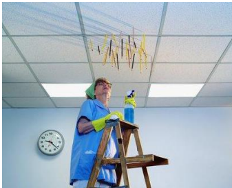
Resim 9: Ekstra temizlik

Ekstra temizlik işlemleri, üç günde bir yapılan standart oda temizlik işleminin yanı sıra yapılan ilave temizlik işlemleridir. Odadaki piriñlerin parlatılması, camların silinmesi, taş yüzeylerin cilalanması ekstra temizlik için sayabileceğimiz örneklerdir.