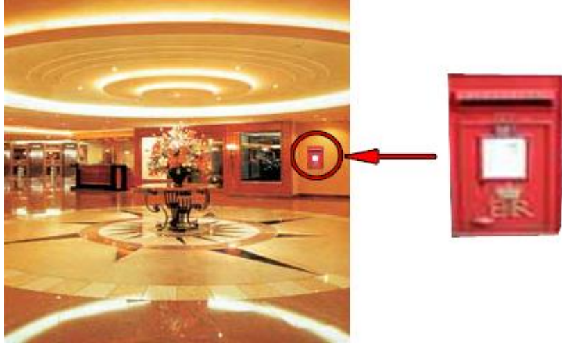
Resim 29 – Dilek ve Őikâyet kutusu

Bir Őikâyet formu hazırlanarak çeŐitli sorularla konuk memnuniyeti ölçölmeye çalıŐılır. Bu formu düzenlerken konuğun vaktini alıcı, sıkıcı ve uzun sorulardan oluşmamasına dikkat edilmelidir.