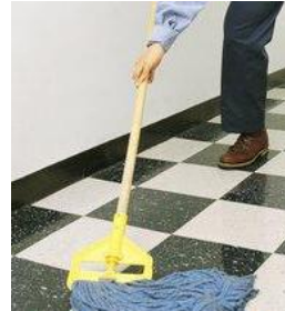
Resim 10: Taş yüzeylerin cilalanması