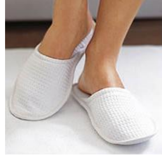
Resim 6: Tek Kullanımlık Terlik