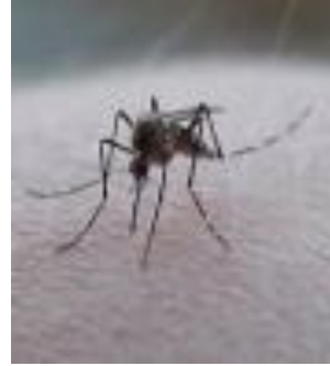
Resim 22: Hamamböceği - sivrisinek