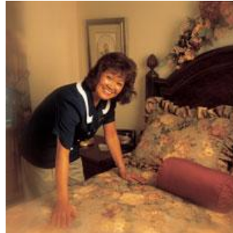
Resim 26: Kusursuz oda, konuk memnuniyeti

Tesisin en fazla gelir getiren departmanı olan, odalar bölümünün temizliğinden, bakımından ve dekorasyonundan sorumlu olan housekeeping departmanı servis departmanından sonra en fazla elemanla hizmet veren departman olma özelliğini taşımaktadır. Her departmanda olabileceği gibi housekeepingde de gözden kaçan bazı hatalar olabilir.