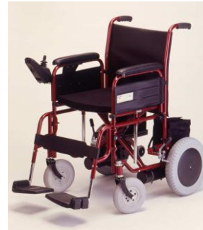
Resim 35: Özürlü odası ve tekerlikli sandalye