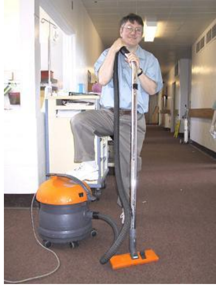
Resim 28: Hollerin temizliği