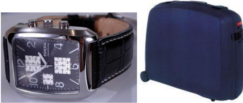
Resim 33: Kayıp eşya

Kayıp ve bulunmuş eşyayı üstlenmemiz, konuğa sunduğumuz hizmetlerden biri olarak düşünülmelidir. Önemli bir eşyasını kaybeden konuk, bunu bulan personele karşı bir minnettarlık hissedebilir. Ayrıca kaybolan eşyadan otel de sorumlu tutulabileceğinden kayıp eşyalar için uygulanan prosedürün son derece hassas bir şekilde takibi gerekmektedir.