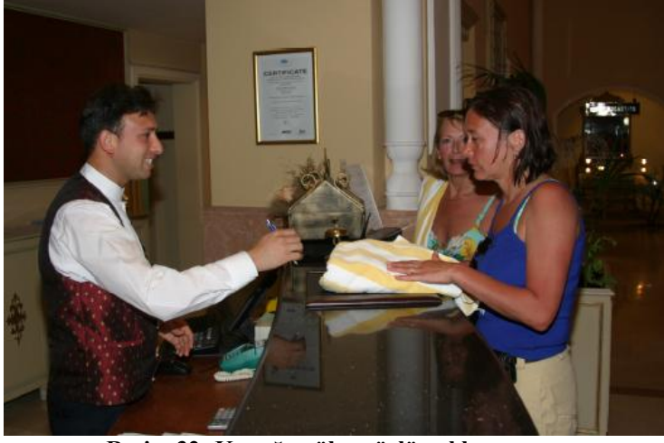
Resim 32: Konuđa gler yzly yaklaşım