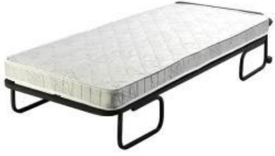
Resim 2: İlave yatak