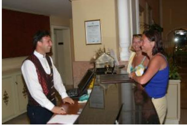
Resim 30: Konuğun bilgilendirilmesi