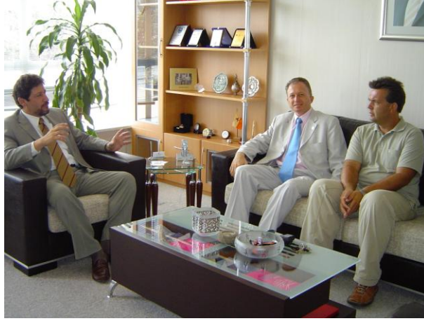
Resim 25: Konuğun istek ve şikâyetlerinin dinlenmesi

Halkla ilişkiler faaliyetleri, tesisin prestijini artırmaya yönelik çalışmalardır. Halkla ilişkiler departmanına gelen istek ve şikâyetler genelde yüz yüze olur, halkla ilişkiler çalışmaları sırasında konukların sorunları ve istekleri saptanarak iyileştirme çalışmaları yapılmalıdır. Otelde verilen hizmetten memnun kalan herkes bunu sevdiklerine anlatarak otelin isminin ve hizmetlerinin duyulmasına yardımcı olur. Bu yüzden konuk memnuniyetini sağlayacak hiç bir şeyden kaçınılmamalıdır.