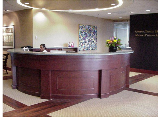
Resim 25: Önbüro

Otelin beyni olarak bilinen önbüro departmanı, turistik bir tesisin yönetiminden- oda satışına, konuğun karşılanmasından memnuniyetine kadar çok geniş bir alanda faaliyet göstermektedir. Konumu gereği göz önünde bulunması ve bilgi alınabileceği bölüm olması konukların her konudaki istek ve şikâyetlerinin önbüroya gelmesinin nedenlerindedir. Özenle seçilen önbüro personeli, önbüroyu insanların rahatlıkla danışabilecekleri veya şikâyetlerini iletebilecekleri bir yer haline getirmiştir.