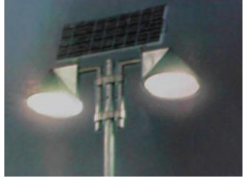
Resim 21: Sokak lambası (yüksek ışık)