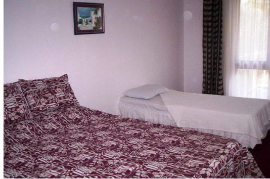
Resim 1: İlave yatak

Tesise gelen konukların, ikiden fazla kalma isteği genelde ebeveynlerinin yanında kalacak 0-12 yaş çocuklar için geçerlidir. 0-3 yaşa kadar bebek yatağı, 3 yaştan sonra ilave yatak kullanılır. Bebek yatağı, dört yanı korumalı ve bebeğin içinden çıkamayacağı yükseklikte olmalıdır. İlave yatak, odanın diğer yatağına göre daha küçük, genelde portatif ve katlanabilir olmalıdır.