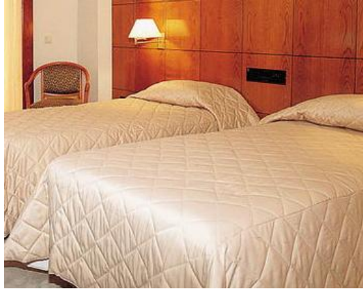
Resim 4: İlave yatak örtüsü

İlave yatak için, normal yatakta kullanılan eşyalar kullanılır alt çarşaf, üst çarşaf ve battaniye. Normal yatak yapımı esaslarına uygun olarak hazırlanır. Yastık bir adettir, isteğe göre fazladan yastık ve battaniye verilebilir.