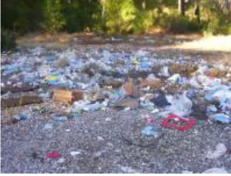
Resim 20: Çevre kirliliği, pis koku

Çevre ile ilgili şikâyetler tesis içinden olabileceği gibi tesis dışından da olabilir. Konuk, diğer konukların gürültüsünden, personel çalışmaları sonucu ortaya çıkabilecek gürültülerden ya da tesis dışından gelen ses, ışık, koku gibi etkenlerden etkilenebilir ve bunu şikâyet konusu yapabilir. Bu durumlarda konuğun şikâyeti giderilmeye çalışılmalıdır (Olağandışı Durumlar Modülü).