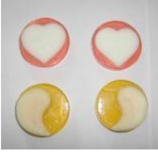
Resim 5: Tek Kullanımlık Güzel Kokulu Sabun