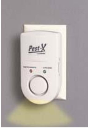
Resim 23: Sinek kovucu