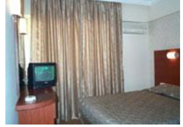
Resim 13: Oda temizliği

Konukların oda temizliği ile ilgili şikâyetlerini en aza indirmek için, yukarıda sayılan olumsuzluklara dikkat edilmelidir.