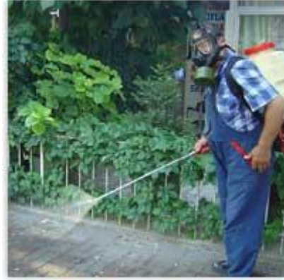
Resim 24: Tesisin ilaçlanması