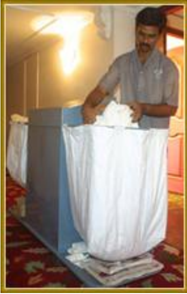
Resim 27: Hol ve tuvalet çöplerinin boşaltımı