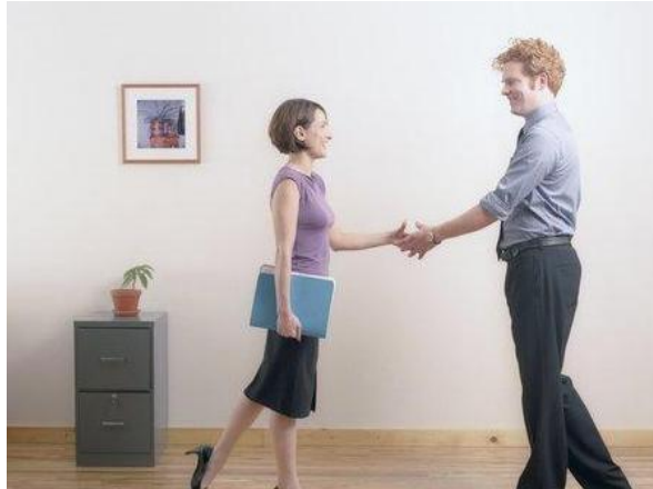
Resim 31: Görevli personelce konuğa sonucun bildirilmesi

Herhangi bir aksaklığın giderilme sürecinde konuğa bilgi vermek kadar aksaklık giderildikten sonra da ilgili departman amiri tarafından, tekrarını önlemek amacıyla kontroller yapılması da önemlidir.