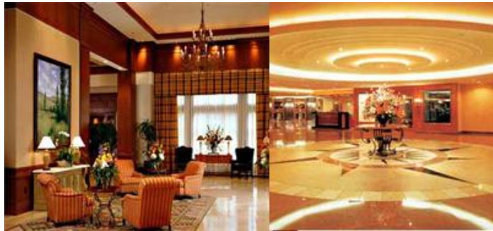
Resim 17: Genel alan (lobby)

Genel alanlar yoğun bir şekilde kullanıldığı için temizliğinin daha sık yapılması ve kontrol edilmesi gerekmektedir. Zaman zaman yaşanan yoğunluktan dolayı şikâyetlerin geleceği unutulmamalı ve gerekli önlemler alınmalıdır. (Genel Alan Temizliği Modülü).