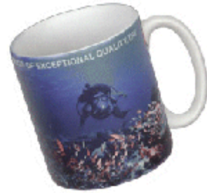
Resim 8: Fincan