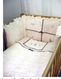
Resim 3: Bebek yatağı