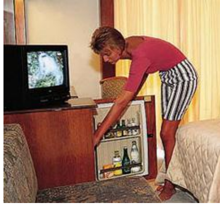
Resim 34: Mini Bar