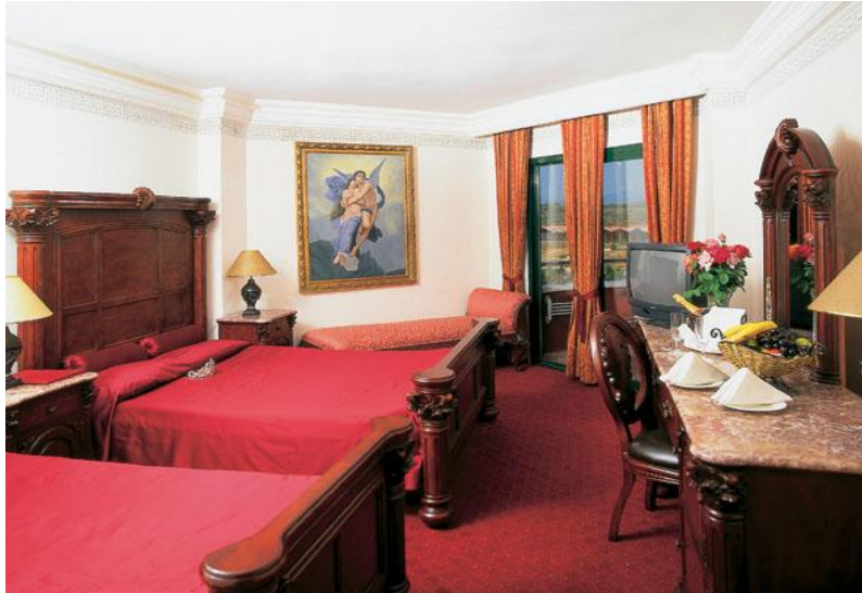
Resim 36: VİP konuk için düzenlenmiş oda

Özel durumu olan konuk VİP ise genelde odanın yatak düzeninde belirgin değişiklikler yapılır. Özel yatak örtüleri saten veya işlemeli çarşaf, gösterişli ve büyük yatak başlıkları en belirgin değişiklikler olarak konuklara sunulmalıdır. Gösterişli hazırlanmış bir yatak konuk memnuniyetini üst düzeye çıkaracaktır.