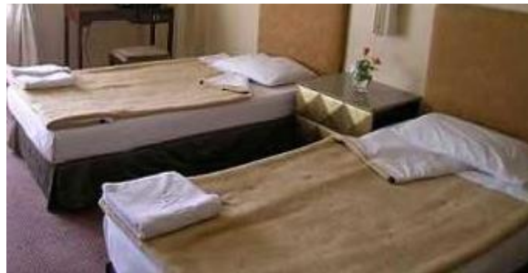
Resim 12: Yatak örtüsünün açılması

Standart yatak yapıldıktan sonra, bir ucu hafifçe açılarak yatak yapımı tamamlanır. Konuğun beklentisi, temiz ve ütülü çarşaflar ile yatağı açıldığında gelecek temizlik kokusudur. Bu yüzden otellerde parfümlü deterjanlar tercih edilir.