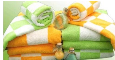
Resim 14: Banyo havlusu