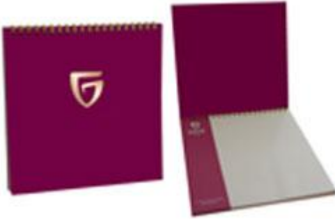
Resim 7: Not defteri

Konaklama tesislerinde konuđu memnun edecek ve işini kolaylaştıracak küçük eşantiyonlara yer verilir. Burada amaç konuklara tesisi hatırlatacak küçük hediyelerin verilmesidir. Bu amaç doğrultusunda bu eşantiyonların tümünün üzerinde tesis adı ve amblemi bulunmalıdır. Bu eşantiyonlar genelde antetli A4 kağıtları, küçük bloknolar, kalemler, fincan, çakmak, kibrit ve bunun gibidir.