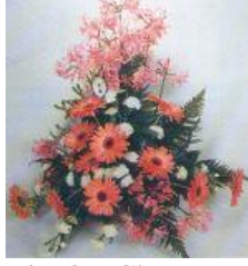
Resim 37: Çiçek servisi

Konuğun özellik derecesine göre odaya çiçek göndermek hoş bir jesttir. Gönderilen çiçek genellikle check-in'den önce odaya yerleştirilir. İçerisine özel günlerini veya otelimizde bulunduğundan duyulan hoşnutluğu belirtecek bir kart ve çiçeği kimin gönderdiği ile ilgili bir kartvizit bırakılır. Burada dikkat edilecek nokta, çiçeğin kesinlikle canlı çiçeklerden seçilmiş olmasıdır.