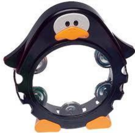
Resim 2.6: Tef