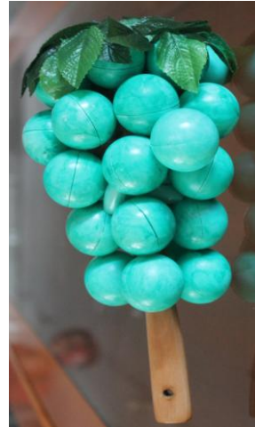
Resim 2.15: Pinpon toplarından marakas