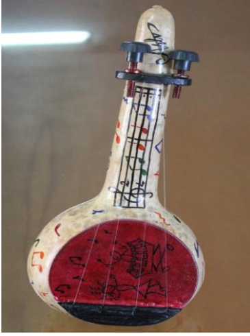
Resim 2.16: Su kabağından ritim aracı