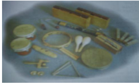
Resim 1.1: Ritim araçları (koçak, oiala, katja)

Ritim çalışmaları, çocuklarda ritim duygusunu, işitsel algı yeteneğini, dikkatini, eşlik etme, birlikte çalma, söyleme ve hareket etme yeteneğini geliştirir; disiplin kazandırır.