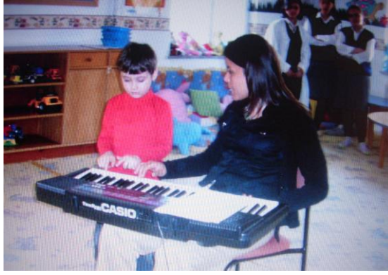
Resim 19: Müzik etkinlikleri