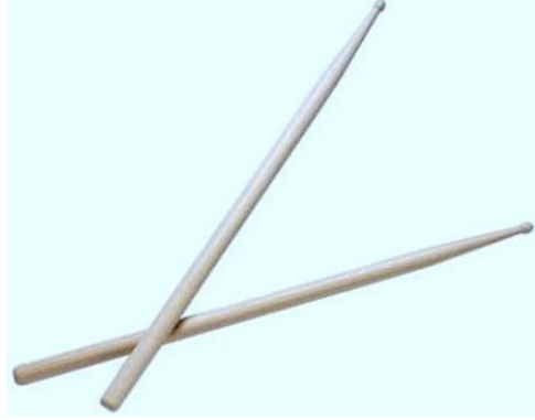
Şekil 2.13: Ritim çubukları

Yapılışı: 30 cm uzunluğunda zımparalanmış, özellikle yuvarlak sopalar boyanarak yapılır. İstenirse uç kısmına zımpara kâğıdı, çingirak takılabilir.