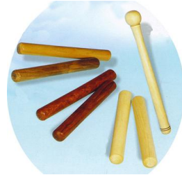
Resim 2.2: Ritim çubukları