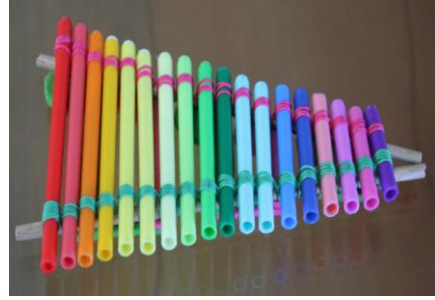
Resim 2.17: Keçeli kalemlerden üflemleri ritim aracı