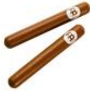
Resim 2.1: Ritim çubukları

Ritim çubukları 30cm uzunluğunda, hafif, zımparalanmış tahtadan yapılmış özel çubuklardır.