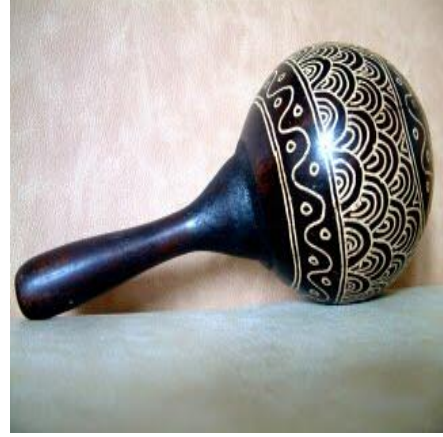
Resim 2.4: Su kabağından marakas