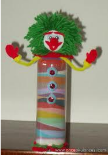
Resim 2.9: Maraka