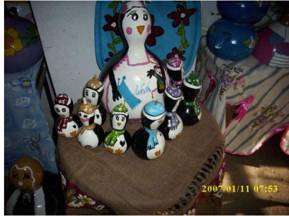
Resim 2.10: Su kabağında marakas örnekleri