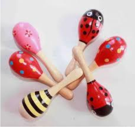
Resim 2.3: Marakas örnekleri

Marakas evde ve okulda yapılabilir. Küçük mukavva veya plastik kutuların içine küçük taşlar, boncuklar vb. (1) konularak kapağı kapatılır. Kutunun üzeri boyanarak çekici hale getirilir. Bunlar sallandıkları zaman değişik sesler çıkarırlar; bu sesler çocukları çok mutlu eder.