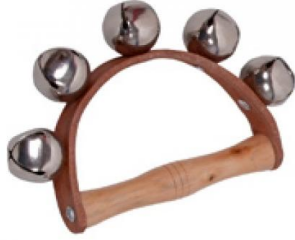
Resim 2.7: Saplı zil

Değişik boyutlarda ve şekillerde yapılabilen ziller, ritim çalışmalarında kullanılan ilgi çeken ritim araçlarından biridir. Zillerden ses çıkarmak çok kolay olduğundan kendine güveni olmayan çocuklarda müziğe başlamak için en ideal ritim aracıdır.