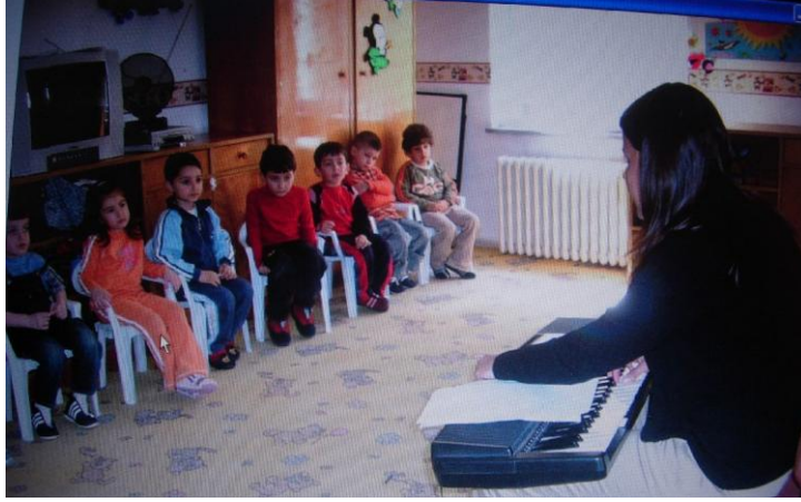
Resim 1.2: Ses dinleme çalışmaları

Bir başka ses dinleme çalışması da seslerin geldiği yönün tahmin edilmesi çalışmasıdır. Çocuklar sesin arkadan mı, önden mi, sağdan mı, soldan mı geldiğini tahmin ederler. Sesin şiddetini yani alçak mı yüksek mi olduğunu kavrama çalışmaları da ses dinleme çalışmalarındandır.