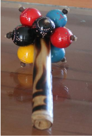
Resim 2.14: Boncuklardan yapılabilecek ritim aracı