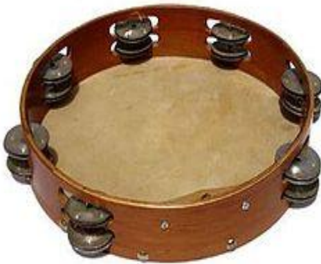
Resim 2.5: Tef

Tef, müzik etkinliklerinde, ritim çalışmalarında ve şarkı söyleme çalışmalarında en çok kullanılan ritim araçlarından biridir. Bu araç, yapımı çok kolay olduğu için öğretmen tarafından hatta öğrencilerle birlikte yapılabilir.