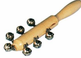
Resim 2.8: Saplı el zili