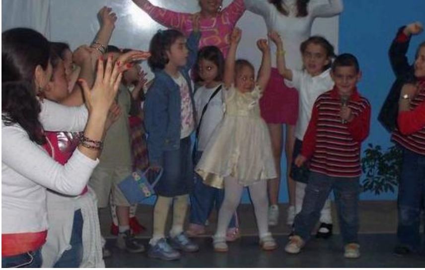
Resim 1.3: Müzik saatinde yaratıcı dans çalışması

Çocuklar hoplayıp, zıplayıp, yuvarlanıp duygularını hareketlerle ifade ederken, enerjinin dışı vurularak kullanımı da gerilimin azalmasına, çocukların rahatlamalarına katkı sağlar. Çocukta yaratıcılığın gelişimine katkıda bulunan bu çalışmalar, çocuğun duygu ve düşüncelerini hareketlerle ifade etme becerisinin gelişmesine de yardımcı olur. Yaratıcı dans, toplu olarak yapılan bir çalışma olduğu için çocuğun sosyal gelişimine de katkıda bulunur. Yapılan hareketler vücut koordinasyonuna eşgüdüm, denge, esneklik gerektirdiği için psikomotor gelişime de katkıda bulunur.