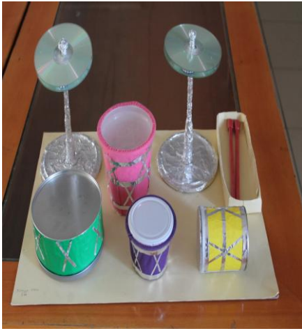
Resim 18: Kutulardan ritim aracı