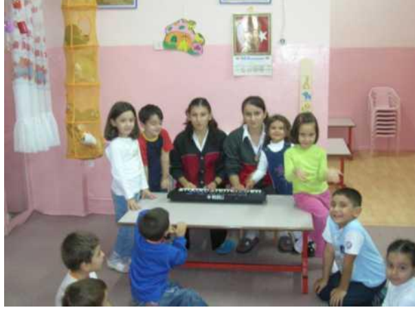
Fotoğraf 1.5: Çocukların şarkı öğretimine ve şarkı söyleme çalışmalarına hazırlanması