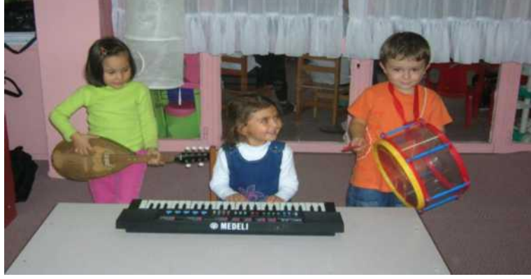
Fotoğraf 1.1: Müzik etkinliği

Erken çocukluk döneminde müzik eğitiminin amacı; çocuğun duygusal, bilişsel, dil ve psikomotor gelişimlerine yardımcı olmak başka bir deyişle çocuğun duyduklarını, düşündüklerini ritim ve şarkılarla serbestçe ifade edebilmesini, müzik kültürü ile tanışmasını ve müzik sevgisini kazanmasını sağlamaktır. Çocuğun içinde bulunduğu müzik ortamı, müzik gelişimini olumlu veya olumsuz yönde etkileyecektir. Çocuğun müzik gelişimine olumlu yönde yapılacak en önemli katkıyı yine çocuğun gideceği erken çocukluk eğitim kurumu sağlayacaktır. Erken çocukluk eğitiminde müzik, çocuğun sosyalleşmesinde ve kişiliğinin gelişmesinde önemli bir rol oynar. Çocuk çevresinde duyduğu çeşitli sesler ve müzik sesleriyle her zaman müziğin içindedir. Çocuk sesleri dinleme, sesleri ayırt etme, ses üretme çalışmaları, nefes açma çalışmaları, ritim çalışmaları, şarkı söyleme, yaratıcı dans, müzikli dramatizasyon ve müzikli öykü çalışmaları ile müziğin içine girer. Bu çalışmalar doğrultusunda müzik yoluyla duygularını anlatabilir. Yaratıcılığı gelişir. Çocuğun müziğe karşı doğuştan bir ilgisi ve yeteneği vardır. Fakat her çocuğun müziğe karşı olan yeteneği aynı derecede değildir. Bunun yanı sıra bütün çocuklar müziği sever. Çocuk hayata ilk gözünü açtığı andan itibaren sesle tanışır. Hatta bazı araştırmacılara göre çocuk, anne karnındayken dışarıdan gelen seslerden etkilenebilir. Ritim ve sesi küçük yaşlardan itibaren kavrayabilir.