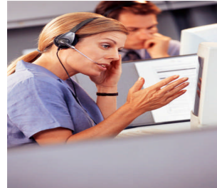
Resim 1.1: Müşteri bankanın verdiği numarayı kullanarak telefon aracılığı ile banka işlemlerini gerçekleştirebilir.