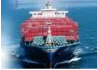
Resim 1. 3: Deniz Taşımacılığı