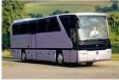
Resim 1. 2: Yolcu Otobüsü

Bunlardan en yaygın olanları iç nakliyat sigortası ile deniz nakliyat sigortasıdır.