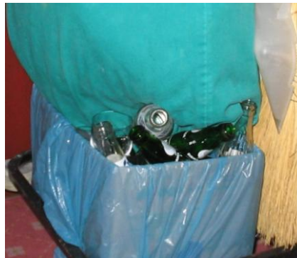
Resim 3. 9: Kat arabasında cam atıklar

Banyo çöp sepetleri plastik veya metal malzemedendir, kapaklı ve plastik çöp poşeti kullanılabilir olmalıdır. (Resim 3. 9)