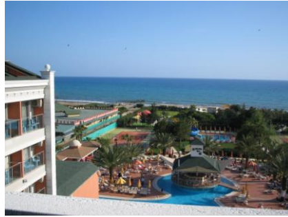
Resim 1.4: Corner room