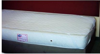
Resim 1.7: Yaylı yatak