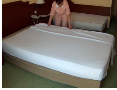
Resim 2.5 Alt çarşaf açma 3

yatađın üstüne bırakılan çarşaf ise öne doğru getirilerek bir elle köşe tutulup kaldırılmalı diđer elle çarşaf yatađın altına sokulmalıdır.