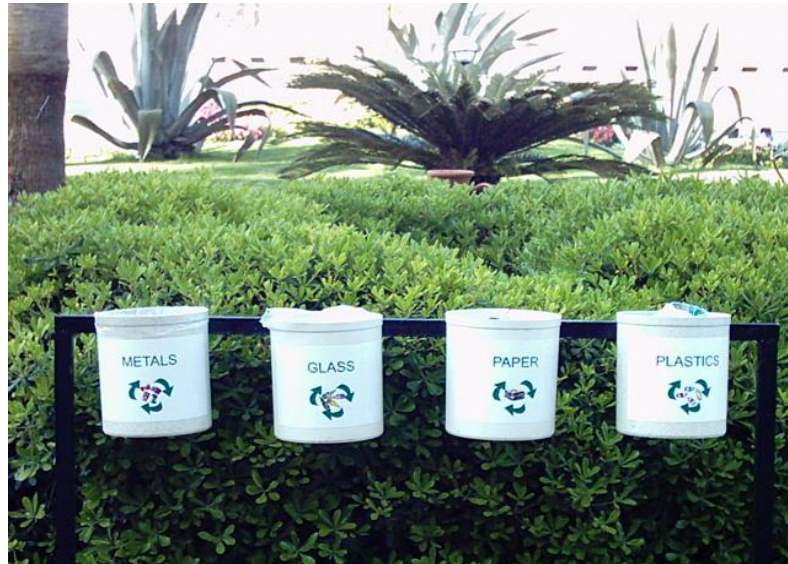
Resim 3.3: Atık çeşidine göre çöp kutuları

Kullanıldıktan sonra standartlara uygun olarak toplanan, sanayide işlenerek tekrar kullanıma sunulan, kullanılabilir (kağıt, çam eşya, plastik eşyalar vb.) madde haline getirilebilen atıklara dönüşümlü çöp diyoruz. (Resim 3. 3)