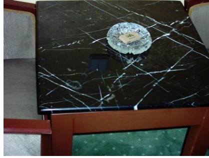
Resim 3. 8: Kül tablası

Oda temizliğine başlarken ilk yapılacak iş kül tablasının temizlenmesidir. Kül tablası temizlenmeden pencere açılacak olursa, kül tablalarında uçacak kül odaya yayılır.