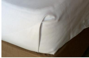
Resim 2.6: Köşe yapımı

Üst çarşaf, kenarlardaki dikiş yerleri üste gelecek şekilde yerleştirilir. Üst çarşafın yatak başından 10 cm. sarkacak şekilde yerleştirilmesine dikkat edilmelidir. Bu kısım daha sonra battaniyenin üstüne katlanacaktır.