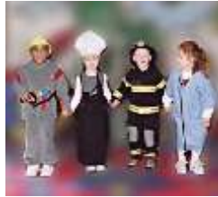
Resim 2.8: Taklit oyunları