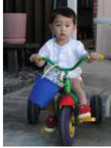
Resim 2.1: Oyun oynanacak mekân

Mekân, seğıilen oyun için uygun olmalıdır. Örneđin geniş alanda oynanabilecek oyunların küçük bir sınıfta oynanması kazalara ya da çocukların oyundan zevk almamalarına neden olabilir. Oyun için seğıilen ortamın normalden sıcak ya da sođuk olması, fazla aydınlık ya da karanlık olması, yeterince havalandırılmamıř olması da çocukların oyuna ilgilerinin azalmasına neden olabilir.