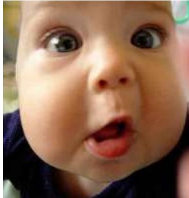
Resim 1.19: Çocuğun ilk bilinçsiz ve basit hareketleri

Çocuğun ilk hareketleri, bilinçsiz ve kontrolsüz hareketlerdir. Kollarını ve bacaklarını sallar, kıpırdanıp sağa sola döner. Çocuğun bilinçsiz yaptığı bu hareketler, onun ileride yapacağı yürüme, koşma, atlama, tutma gibi doğal ve bilinçli hareketleri yapabilmesi ve organlarını kontrol altına alabilmesi için alıştırma niteliğindedir. Çocuğun bu ilk bilinçsiz ve basit hareketleri onun için oyundur. İşte onun bu ilk hareketlerine, ilk alıştırmalar ve fonksiyon oyunları denir. Bu hareketler, gerçek bir oyun karakteri taşımaz.