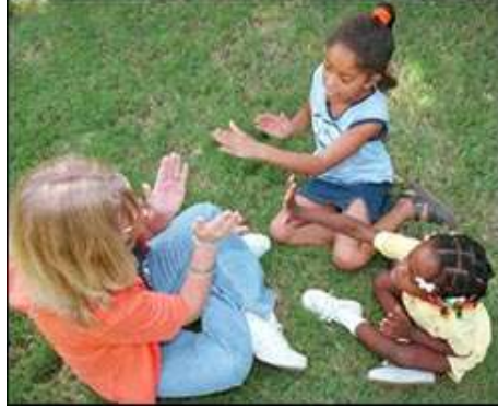
Resim 1.12: Oyun ve iletişim

Bateson, Vygotsky gibi oyun ve iletişim arasında bir ilişki olduğunu savunur. Ancak oyundaki iletişimin tam iletişim değil, yarı iletişim olduğu görüşündedir. Sosyal oyunlarda kişiler, davranışlarının gerçek olmadığını, sadece oyun olduğunu iletmek zorundadır. Bu iletişimdeki başarısızlık, oyunun amacının yanlış anlaşılmasına ve sosyal uyumsuzluğa neden olur.