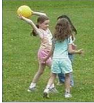
Resim 1.24: Çocukların açık havada atlama, zıplama, koşma oyunları

Açık hava oyunlarının çocuğun sosyal, duygusal, bilişsel ve fiziksel gelişimlerine olumlu etkileri çok fazladır. Çocuk; açık havada atlar, zıplar, koşar. Çim, toprak ve kumla oynayarak doğayı tanır.