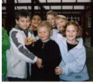
Resim 3.4: Öğretmen; sınıfındaki çocukları, özel gereksinimi bulunan çocuğa karşı hazırlamalıdır.

Sınıfında bu tür özel gereksinimi bulunan eğitimcinin dikkat etmesi gereken noktalar vardır. Öncelikle çocuğun eğitiminden sorumlu olan kişi ve kurumla, aynı zamanda da aile ile iş birliği içinde bulunmalıdır. Dikkat etmesi gereken bir diğer husus ise sınıfındaki çocukları bu duruma hazırlamaktır.