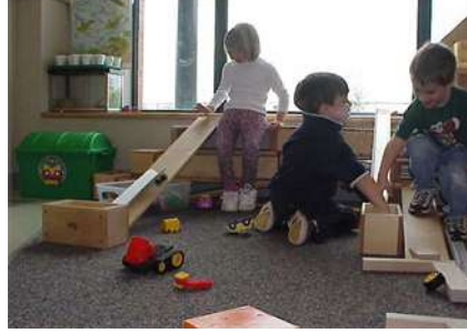
Resim 1.20: Üç yaşından sonra hayal gücüne dayanan oyunlar

Fonksiyon oyunları devresi kısa sürer. Üç yaşından sonra, hayal gücüne dayanan oyunları oynamaktan hoşlanır. Oyuncakları ile konuşur, onlara canlı muamelesi yapar. Kız çocuklar, bebeklerini uyutur, mama yedirir, yaramazlık yaptığı için kızar. Erkek çocuklar ise sopadan atına biner, polis olup suçluları yakalar, bloklardan yollar, köprüler yapar.