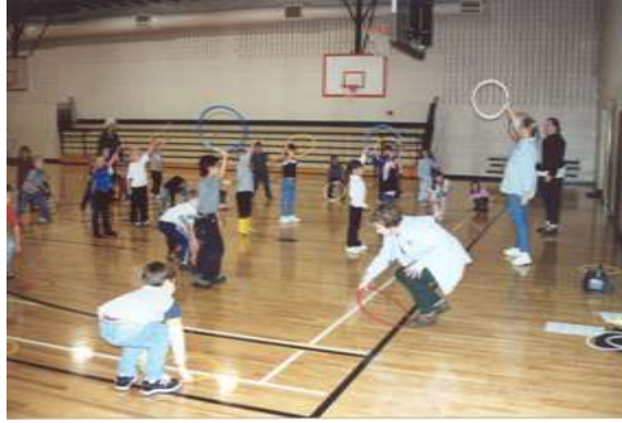
Resim 1.28: Salon oyunları; sınıf, ev, oyun odası, spor salonu gibi kapalı mekânlarda oynanabilen oyunlar

Kurallı ya da kurlsuz serbest oyun şeklinde oynanabilir. Çocuklar, oyuncaklarıyla ya da oyuncaksız serbestçe, tek başına ya da grupça oynayabilir. Ayrıca kuralları önceden belirlenmiş oyunları da salon ya da sınıflarda oynayabilir. Erken çocukluk eğitimi kurumlarında oyun saatinde oynanan kurallı oyunlar üç aşamada uygulanır. Bunlar, ısındırıcı, hareketli ve dinlendirici oyunlardır. Çocukları hareketli ve düzenlemeli oyunlara hazırlamak için oynanan oyunlar ısındırıcı oyunlardır. Basit beden hareketleri, insan-hayvan ya da taşıt taklitleri, parmak oyunları ısındırıcı oyunlara örnektir.