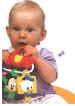
Resim 1.18: Çocuğun ilk hareketleri

Çocuğun ilk hareketleri, bilinçsiz ve kontrolsüz hareketlerdir. Kollarını ve bacaklarını sallar, kıpırdanıp sağa sola döner. Çocuğun bilinçsiz yaptığı bu hareketler, onun ileride yapacağı yürüme, koşma, atlama, tutma gibi doğal ve bilinçli hareketleri yapabilmesi ve organlarını kontrol altına alabilmesi için alıştırma niteliğindedir. Çocuğun bu ilk bilinçsiz ve basit hareketleri onun için oyundur. İşte onun bu ilk hareketlerine, ilk alıştırmalar ve fonksiyon oyunları denir. Bu hareketler, gerçek bir oyun karakteri taşımaz.