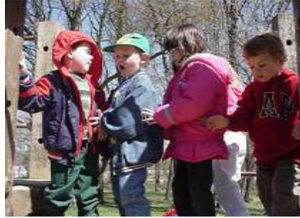
Resim 1.5: Oyun, çocuğun dikkat gelişiminde yardımcıdır.

Çocuktaki motor gelişim, öğrenmesi, büyümesi ve gelişmesiyle ilgilidir. Oyun, başlıca motor yetenekler olan güç, hız, dikkat, eş güdüm (koordinasyon) ve esnekliğin gelişmesi için ideal bir ortamdır.