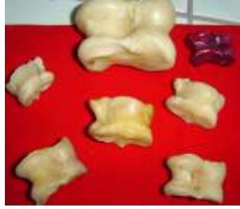
Resim 1.2: Aşık oyununda kullanılan kemikler

Çocuk oyunları içerisinde taşla ve aşıkla (koyun ve keçi gibi hayvanların arka ayak diz bölgesinden çıkan kemiklerle) oynanan oyunları genelde en eski oyunlar olarak kabul edilmektedir.