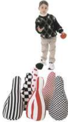
Resim 2.10: Hedef devirme oyunu

Çocuklar iki gruba ayrılır. Grupların bulunduğu yerden belli mesafe uzaklığa hedefler yerleştirilir. Her çocuk, sırası geldiğinde topu atarak hedefteki labutları devirmeye çalışır. Skor tahtasına birinci gruptaki ilk çocuğun devirdiği hedef sayısı kadar çizgi çekilir. Hedefler tekrar düzeltilerek ikinci grubun ilk çocuğunun topu atması istenir ve onun da devirdiği hedef sayısı skor tahtasına işaretlenir. Bütün çocuklar atışını tamamlayana kadar oyun sürdürülür. Oyunun sonunda her iki grubun da skorları toplanır. En çok hedef deviren grup başarılı olmuş sayılır.