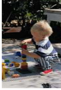
Resim 1.15: Tek başına oyun dönemi

Tek başına oyun dönemindeki en büyük özellik, çocuğun çevresindeki hiçbir şeyden etkilenmeden kendi oyununa devam etmesidir. Toplarını yuvarlayıp küplerden kuleler yapar. Yaptıklarına bakarak sevinir, kızar ve kendi kendine söylenir.