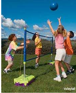
Resim 1.17: 10–12 yaşlarından itibaren kurallı oyunlar

Kurallar, oyuna başlamadan önce belirlenir ve oyunun ortasında değiştirilemez. Kurallara uymayana ya da oyunda yenilene verilecek ceza, oyuna katılanların ortak kararı ile belirlenir.