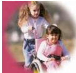
Resim 3.5: Özel gereksinimi olan çocuğa arkadaş desteği

Çocukları bu duruma hazırlamak ve sınıfa katılacak çocuğun özel problemi, gereksinimi konusunda bilgilendirmek için oyun etkinliklerinden faydalanabilir. Çocukları bilgilendirmek ve yeni duruma uyum sağlamalarına yardımcı olabilmek için onlara bazı sorular sorarak başlayabilir.