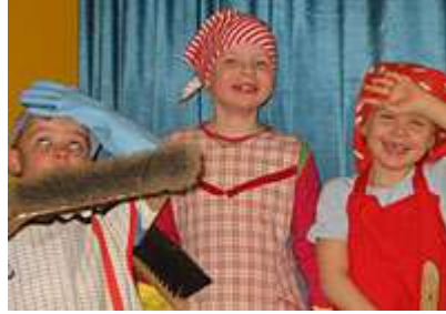
Resim 1.21: Çocuğun hayal gücüne dayanan yaratıcı oyunlar

Çocuk, bu tür oyunlarla kendini bir başkasının yerine koyar ve gizli duygu ve düşüncelerini açığa vurur. Küçüklüğünü ve güçsüzlüğünü bu oyunları oynarken aşar. Çünkü bu oyunlarda güçlü kişi kendisidir.