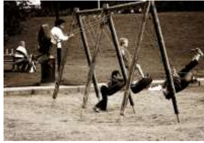
Resim 1.30: Aracın üzerinde ya da içinde oynanan oyunlar

Bir oyun aracının üzerinde ya da içinde oynanan oyunlardır. Jimnastik sırası, denge aleti, tahterevalli salıncak, jimnastik minderi, atlama kasaları ile oynanan oyunlar araçta yapılan oyunlardır.