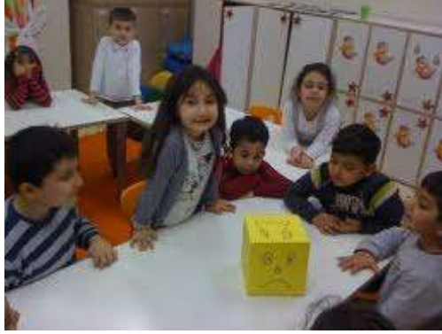
Resim 1.7: Duyguların yüz ifadesi ile anlatımı