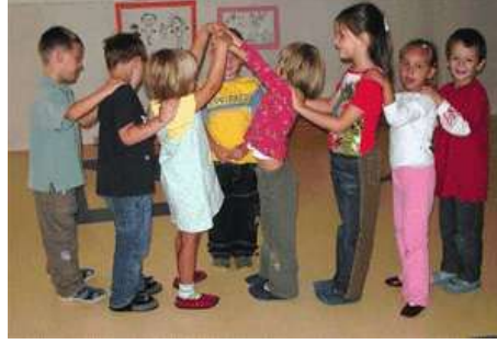
Resim 2.7: Oyuna katılmak isteyen çocuklar