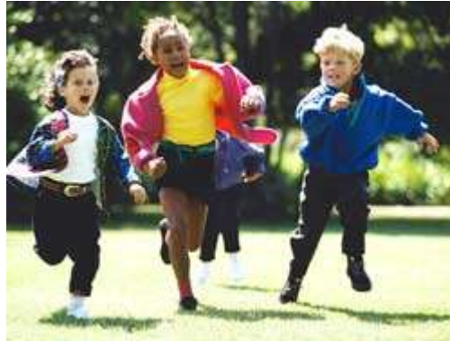
Resim 1.25: Koşmaca oyunları