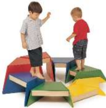
Resim 1.8: Denge oyunları

Bu kurama göre oyun, vücutta bulunan fazla enerjinin harcanmasıdır. Çok oynayan çocuk bu nedenle sağlıklıdır. Bu kuramda oyunun içeriği önemli değildir. Bu kuramın temsilcileri Friedrich Schiller ve Herbert Spencer’dir.