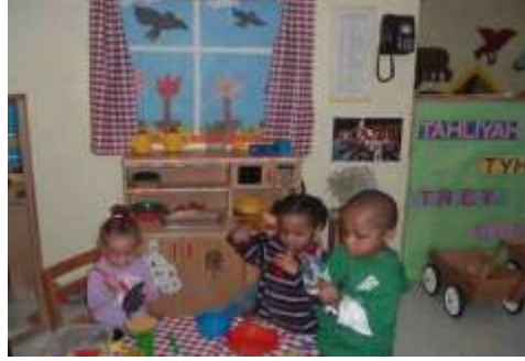
Resim 1.9: Rahatlama ve dinlenme kuramına göre oyun

Bu kurama göre günlük hayattaki zorlayıcı etkinlikler, insanı bedenen ve zihnen yıpratmaktadır. Bunun sonucunda ise dinlenme ve uyku ihtiyacı hissedilir. Gerçek dinlenme ise insanın normal hayattaki yaşamsal görevleri dışında başka etkinliklerle uğraşmasıyla olur. Kişi, kendini bu şekilde yeniler. Bu kuramın savunucusu olan Moritz Lazarus, yorucu bir çalışmanın ardından vücudun belli bir dinlenme etkinliğine ihtiyacı olduğunda oyun oynandığını belirtmiştir.