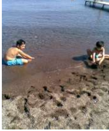
Resim 1.4: Açık havada kum, deniz ve güneşten yararlanarak oyun oynayan çocuklar

Oyun yoluyla enerjisini boşaltan çocuğun uykusu düzene girer ve iştahı açılır. Ayrıca açık havada oynanan oyunlar, güneşten ve temiz havadan yararlanmasını sağlayarak bedensel gelişimini hızlandırır.