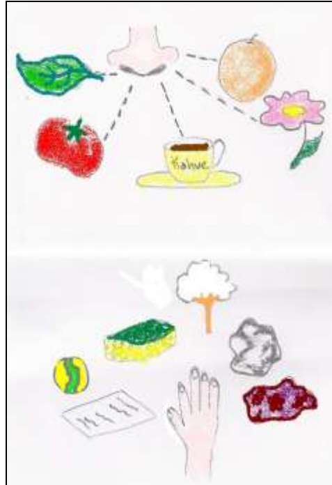
Şekil 3.6: Dokun Tanı oyunu

Masanın üzerine çeşitli şekil, koku ve büyüklükteki nesnelere yerleştirilir. Gruptan bir öğrenci seçilerek gözleri bağlanır. Masadaki nesnelere birini eline vererek bu nesneyi tanıması istenir. Bu çalışma, diğer çocuklarla da yapılarak neler hissettikleri sorulur.