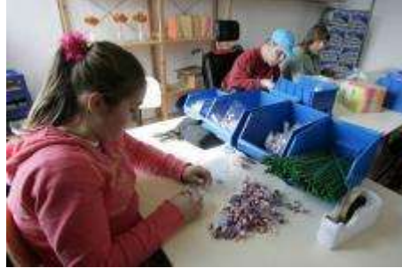
Resim 3.2: Özel gereksinimli çocukların gelişiminde, oyun için iyi düzenlenmiş çevre

Özel gereksinimli çocukların gelişiminde oyunun yararlı olabilmesi için öncelikle çevrenin zenginleştirilmesi ve iyi düzenlenmesine özen gösterilmelidir. Bunun yapılmasındaki amaç ise farklı gelişen çocukların oyuna başlayabilmesini, oyunu sürdürmesini ve tekrar oynama isteği duymasını sağlayacak bir çevre yaratabilmektir. Kum havuzu, top havuzu, kuklalar, oyun hamuru, bloklar, çeşitli büyüklük ve renkteki toplar ve bunlar gibi uyarıların zenginleştirilmesinin faydası olacaktır.