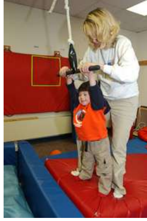
Resim 3.1: Özel gereksinimi olan çocukların oyun ihtiyacının karşılanması

Ancak unutulmamalıdır ki herhangi bir özel gereksinimi olsun olmasın bütün çocuklar, oyun oynamaktan büyük haz alırlar. Bu nedenle farklı gelişen çocuklara da oyunla eğitim vermek ve gelişimlerini desteklemek mümkündür.