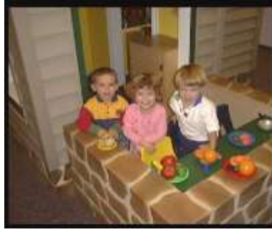
Resim 1.6: Arkadaş grubunda oyun

Çocuk; doğru-yanlış, haklı-haksız, uyulması gerekli kurallar gibi birçok toplumsal ve ahlaki kavramları oyun sırasında öğrenir ve benimser.