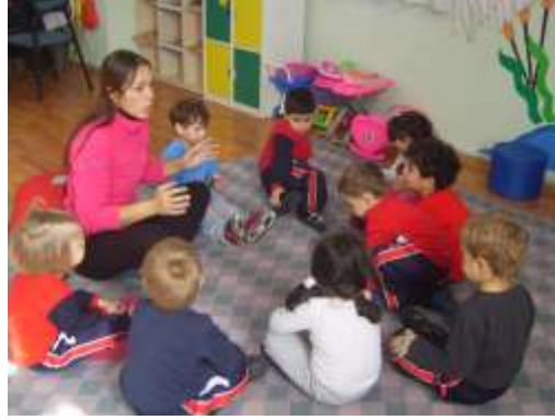
Resim 1.26: Öğretmen rehberliğinde oynanan oyun

Aslan Avı oyununu oynamak için aranızdan bir ebe bir de avcı lideri seçiniz. Ebe, aslan rolünü üstlenecektir.