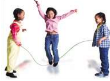
Resim 1.22: 5-6 yaşlarından sonra başlayan grup oyunları

sıkılan çocuk, evini ve çevresini tanımaya başlar. Komşu ve mahallesinde bulunan yaşıtı çocuklarla arkadaşlık kurar. Eđer bu dönemde anne- babalar çeşitli nedenlerle çocuęun bu isteęine karşı çıkıp komşu çocuklarla oynamasına, arkadaşlık kurmasına izin vermez ve evde tek başına oynaması konusunda baskı yaparlarsa çocukta olumsuzluklar görölmesine neden olurlar. Bu tür yasaklarla büyüyen çocuklar; ileride içe dönük, korkak, bazen de hırçın ya da aşırı yaramaz olurl.