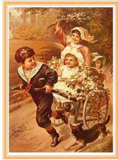
Resim 1.1: Geçmişten günümüze oyun

Genel tanımıyla oyun, belli bir amaca yönelik olan ya da olmayan, kurallı ya da kuralsız gerçekleştirilebilen; fakat her durumda çocuğun isteyerek ve hoşlanarak yer aldığı fiziksel, bilişsel, dil, duygusal ve sosyal gelişiminin temeli olan gerçek hayatın bir parçası ve çocuk için en etkin öğrenme sürecidir.