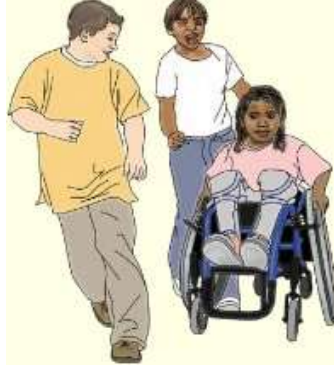
Şekil 3.9: Gruptaki çocukların, özel gereksinimli çocuğa yardım etmelerini sağlayan oyunlar

sandalyedeki arkadaşını iterek kendi grubuna ait oyuncak kovasına belli sürede taşımaya çalışacaktır. Bu oyunda tekerlekli sandalyedeki grup elemanları, gruba ait oyuncakları taşıma ve kovaya atma görevini üstlenir. Süre dolduğunda hangi grubun kovasında daha çok oyuncak varsa o grup kazanır.