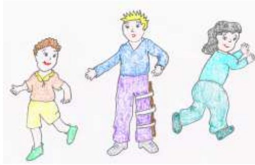
Şekil 3.8: Yakalama oyunu

Çocuklardan biri ebe seçilir ve bacağına plastik bir sopa, çok sıkı olmamasına dikkat edilerek bacağın arka kısmında kalacak şekilde bağlanır. Ebe, bu şekilde gruptaki arkadaşlarını yakalamaya çalışır. Yakalanan grup elemanı ebe olur. Oyun bu şekilde sürdürülür. Oyunun sonunda, oyun değerlendirilirken çocuklara ebe olduklarında bacaklarındaki sopa nedeniyle ne gibi engellerle karşılaştıkları, koşamadıkları, hatta yürümekte zorlandıklarında neler hissettikleri sorulur.