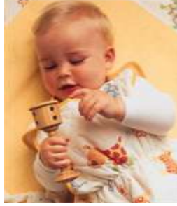
Resim 1.13: İlk aylarda çingırakla oyun oynayan çocuk

İlk aylarda kendi organlarıyla ilgilenen çocuk, tek başına oynamaktan hoşlanır. Kas gelişimi, denge, bilişsel ve dil gelişimi alanlarında yeterli olgunluğa ulaşmadığından başka çocuklarla ilişki kurmaz.