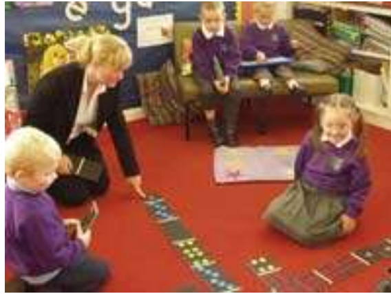
Resim 1.11: Çocuklar için keşfetme aracı olan oyun

Bu kuram, oyunun kökeni ve rolüne ilişkin analizlere dayanır. Vygotsky'e göre oyun, bilişsel mekanizmaların işlemesine en uygun ortamı sağlar ve çocuğun hayali bir çözüm yaratmasıdır. Oyun, keşiftir ve yeni bir oluşumdur. Oyun ve iletişim arasında bir ilişki vardır. Çocuk oyunda gerçek yaşam deneyimlerinden hatırladığı sebep-sonuç ilişkilerini kullanarak yeni davranışlar üretir. Böylece olumsuz dürtülerinden arınır.