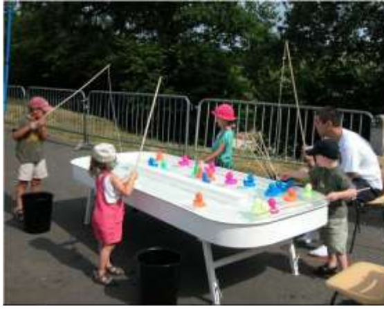
Resim 1.31: Araçla yapılan oyunlar