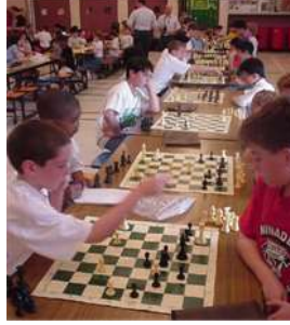
Resim 1.29: Kuralalı oyunlardan satranç ve kart oyunları