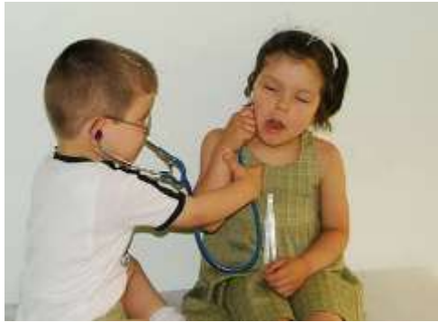
Resim 1.10: Başka bir role girilerek oynanan oyunlar