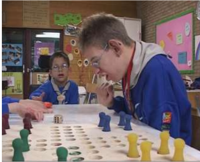
Resim 3.10: Oyun çalışmaları

Bu tür oyun çalışmaları, çeşitlendirilerek çoğaltılabilir. Unutulmaması gereken şey ise bu çocukların diğer çocuklardan farklı oldukları, özür gruplarına ve özür derecelerine göre yaklaşılması gerektiği ve bütün etkinliklerde sınıftaki diğer çocukların da bu çocuklara eğitim verilmesinde etkin rol almalarının sağlanmasının çok büyük yararı olacaktır.