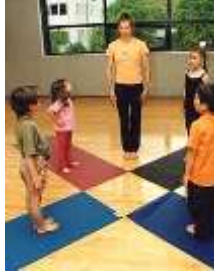
Resim 2.5: Oyuna geçişte uygulanan ısınma hareketleri

Oyuna hazırlanan grupla birlikte oyuna hazırlayıcı ısınma hareketleri yapmak oyuna geçişi kolaylaştıracaktır. Isınma hareketleri, çocuğun psikolojik ve fiziksel olarak rahatlamasını sağlamanın yanı sıra çocukların zevkle ve tam olarak oyuna katılımlarını da sağlayacaktır. Parmak oyunları, basit beden hareketleri, nefes çalışmaları, taklit, yürüyüş ve taklit koşuları ısınma hareketlerine örnektir. Bu çalışma, yaklaşık olarak 5 dakika sürdürülmelidir.