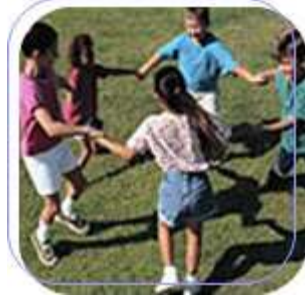
Resim 2.9: Oyun dağılımının olduğu oyunlar