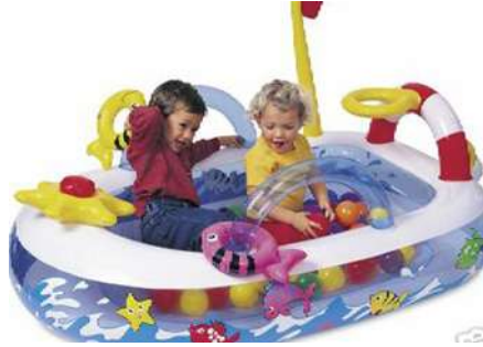
Resim 1.16: Paralel oyunda sosyal iletişim

Artık tek başına oynamaktan vazgeçmiştir. Aralarında çok iyi bir iletişim olmasa da aynı ortamda birkaç çocuk birlikte oynar. Ancak bu oyunda çoğunlukla birbirlerinden bağımsızdır. Aynı oyun malzemelerini kullanan çocuklar, yan yana oynamalarına rağmen aktivitelerini birbirlerinden bağımsız sürdürür. Hareket ve konuşma düzeyi ilerlemiştir. Paralel oyunda, sosyal iletişim çok azdır.