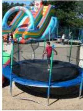
Resim 2.4: Bahçe oyun araç gereçleri