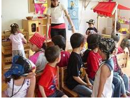
Resim 2.6: Sandalye kapmaca oyununun uygulamalı anlatımı