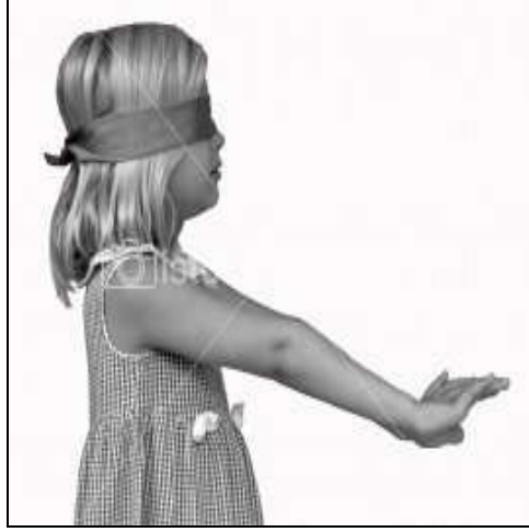
Resim 3.7: Gözleri Kapalı Ebe

Çocuklardan biri ebe olarak seçilir ve gözleri bağlanır. Diğer çocuklar ebenin etrafında dolaşarak çeşitli sesler çıkarırlar. Gözleri bağlı olan ebe, sesin geldiği yöndeki oyunculardan birini yakalamaya çalışır. Yakaladığında başarılı sayılır ve yakalanan kişinin ebe olmasıyla oyun devam ettirilir.