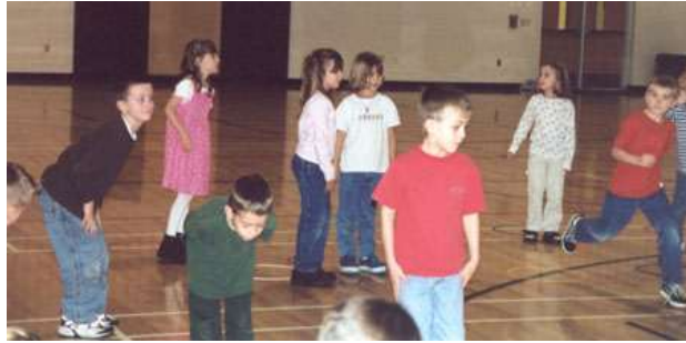
Resim 1.23: Grup oyunları

Grup oyunlarında ilginin dağılmaması için oyunun süresi çok uzun tutulmamalıdır. Erken çocukluk eğitimi kurumlarında grup oyunları, özel oyun salonları, grup oyun odası, spor salonu gibi kapalı alanlarda ya da açık havada oynanabilir.