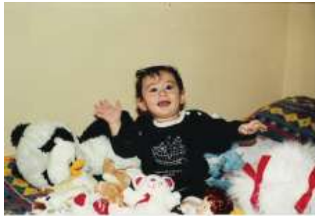
Resim 1.14: Canlı renkli, ses çıkaran, dikkat çekici oyuncaklar

Nesneleri yakalamak, ağzına götürmek, çingırağın sesini dinlemek onun için bir oyundur. Bu dönemde canlı renkli, ses çıkaran, yumuşak ve dikkat çekici oyuncaklar onun ilgisini çeker. Genellikle çevresindeki oyuncaklarla tek başına oynayan bu dönem çocuğu için sosyal iletişim ve oyuncak paylaşımı söz konusu değildir. 0-2 yaş kapsar.