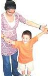
Resim 3.3: Özel gereksinimli çocukların oyunlarında, sosyal kuralları öğrenmelerini sağlayıcı çalışmalar

Özel gereksinimli çocukların dikkat sürelerinin diğer çocuklara göre daha az olduğu unutulmamalı ve oyun seçiminde bu nokta göz önünde bulundurularak fazla uzun sürecek ve dikkat gerektiren oyunlar seçilmemelidir. Onların zihinsel gelişimlerini destekleyici oyun ve oyun araçlarının günlük yaşamla ilgili deneyimler olmasına özen gösterilmelidir. Örneğin küçük topların küçük delikten, büyük topların ise büyük delikten geçirilmesi oyunu ona büyük- küçük kavramını kazandırmamıza; bardaklara çeşitli miktarlarda su konulması ve bu sırada fazla suyun taşması hacim kavramını kazandırmamıza yardımcı olacaktır. Ayrıca elindeki su dolu bardağı belli mesafeye dökmeden taşıması, basit top oyunları gibi oyun çalışmaları da onun gelişimine oldukça fayda sağlayacaktır.