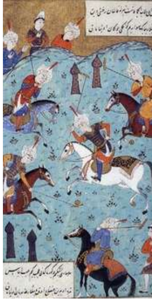
Resim 1.3: Eski Türklerde çevgen oyununu gösteren minyatür

Daha sonraki yıllarda çocuk oyunları nesilden nesile aktararak ve zenginleşerek günümüze kadar gelmiştir. Doğal olarak çocukların ilk dönemlerinden sonraki oyunları zihinsel gelişimle paralel olarak biçim değiştirmekte, zekânın ürünü olmaktadır. Uygarlık gelişiminin bilim, sanat, mimari gibi pek çok alanda gelişme göstermesi çocuk oyunları ve oyuncaklarına da yansımıştır.