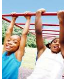
Resim 2.2: Birkaç gelişim alanını destekleyici oyunlar

Amaç ve kazanımlar belirlenip buna göre uygun oyun seçildikten sonra mekân belirlenmelidir. Oyunun özelliğine göre, salonda ya da açık hava da mı, geniş ya da dar mekânda mı oynanacağına karar verilmelidir. Oyun eğer sınıfta oynanacaksa hangi köşede (evcilik köşesi, kukla köşesi, blok köşesi vb.) oynanacağı, açık havada oynanacaksa çim, ağaçlık ya da beton alanda mı oynanacağı belirlenmelidir.