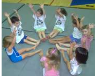
Resim 1.27: Çocukların otururken ya da ayakta iken halka şeklinde durarak oynadıkları oyunlar