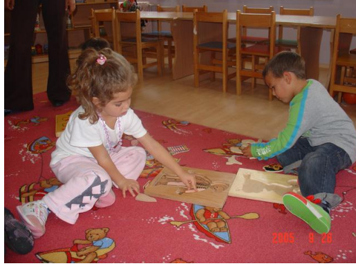
Resim 1.16: Dikkat arttırıcı oyun