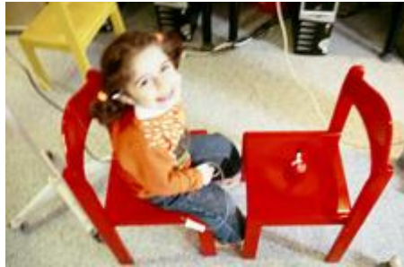
Resim 1.23: Çocuk her yerde çocuktur