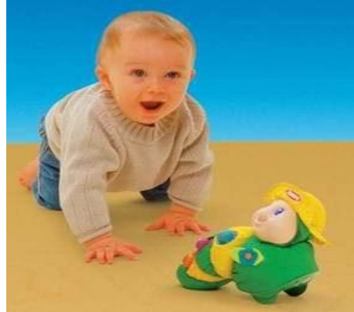
Resim 1.3: Yüz metrelik yola da, bin metrelik yola da bir adımla başlarız

Oyun bir çeşit terapi şeklidir. Oyun çocuğun hem eğlenmesine hem de öğrenmesine yarayan bir etkinliktir. Çocuk nasıl yemek yemek, su içmek için ihtiyaç duyuyorsa, oyun oynamak için de ihtiyaç duyar. Sağlıklı bir çocuk sürekli oynamak ister. Çocuk oyun oynamaya önce annesi ile başlar. Bu oyun ellerin, ayakların, parmakların ilk hareketlerinden ibarettir. Bu hareketler onu daha sonraki hareketlere ve faaliyetlere hazırlar. Çocuk oyunlarla mutlu olur. Yaşına göre değişen oyunlar onu hayata hazırlar.