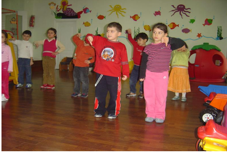
Resim 2.11: Oyunun uygulanmasında kurallar tek tek hatırlatılmalıdır