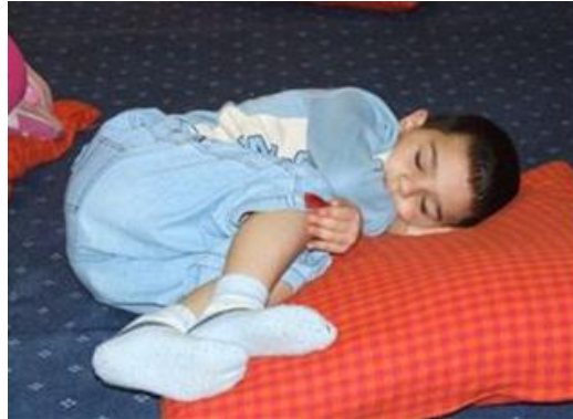
Resim 2.10: Dinlendirici oyun

Bütün oyunlar planlanırken, basitten karmaşığa, az hareketliden çok hareketliye doğru geçişler planlanır. Süre, oyun araç gereçleri, uygulamada anlatılacak kurallar, amaç ve kazanımlar ve değerlendirme bölümleri göz önünde bulundurulur.