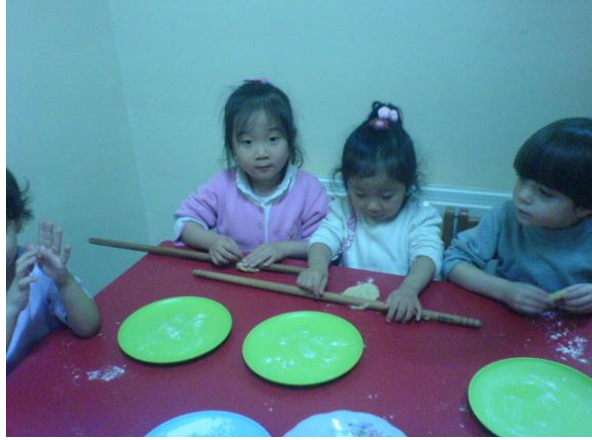
Resim 1.11: Oyununun öz bakım gelişimine etkisi