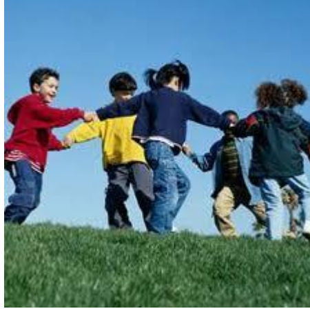
Resim 1.10: Oyunun Sosyal-Duygusal Gelişimine Etkisi