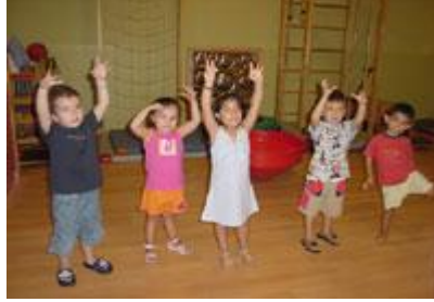
Resim 1.9: Oyunlar ve yarışmalarla çocukta yaşama ve yaratma isteği güçlendirilmelidir. “Feltre”

Özellikle su, kum, kil, çamur gibi doğal materyaller ile tuz seramiği, plastirin, cam macunu ile ilgili oyunları ayrıca karalama, çizme, boyama gibi kalem, boya, fırça kullanımı parmak becerilerinin gelişimine yani küçük kasların motor gelişimine etkisi büyüktür. Bu becerilerin tümü el, göz koordinasyonu (uyumu) gerektirmektedir.