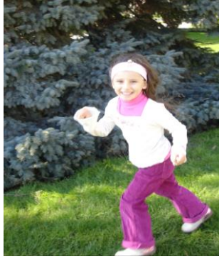
Resim 2.9: Hareketli oyun