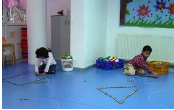
Resim 1.15: Doğal materyallerle oyun