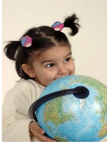
Resim 14: Oyun çocuđun dünyayı algıladıđı ve öğrendiđi ilk ve temel araçtır

Yaşına göre deđişen oyunlar çocuđun bir çok etkinlikle uğraşmasına neden olur. Örneđin 2 yaşındaki bir çocuk suyla oynamaktan çok hoşlanır. Boyalarla karalamalar yapar. Kille, çamurla oynamak onu çok mutlu eder. Bu yıllarda çocuklar kendilerini konuşarak tam olarak ifade edemediklerinden boyalar, hamurlar onlar için kendilerini ifade etme aracıdır. İki yaşlarında çocuklar çok sesli ve gürültülü oyunların yanı sıra sessiz oyunları da çok severek oynarlar. Çocuđun 3 yaşına kadarki temel uğraşısı oyundur. Çocuklar oyun sırasında çok büyük zevk alır ve mutluluk duyarlar. Nasıl büyükler hayatlarını işleri ve aileleri üzerine inşa ederlerse çocuklar da kurdukları oyunlar üzerine inşa ederler.