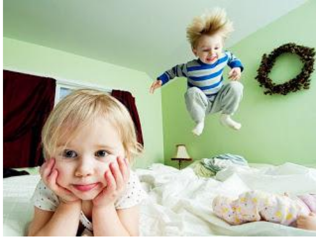
Resim 1.21: Çocuğun iç dengesini kurmak oyunla mümkündür

Hastanede yatan çocuklar için oyun, gelişimsel ihtiyaçlarını karşılamak açısından çok önemlidir. Çocuğun bu süre içerisinde duygusal yönden rahatlayabilmesi, duygularını ve düşüncelerini ifade edebilmesi için hastanelerde oyun odalarına yer verilmelidir. Hastanede yatan çocuk kaygı, korku, öfke gibi tepkiler gösterebilir. Bu tepkilerin altında yatan ruhsal durumlarını ortaya çıkarabilecek ve duruma yeniden anlam verebilecek oyun ortamlarında çocuk bozulan iç dengesini kurmaya çalışır. Hastane ortamı çocuklar için oldukça stresli bir deneyimdir. Ruhsal içe kapanmalar, uzun süreli ağlamalar, uyku düzeninin bozulması, öfke nöbetleri sıkça görülen ruhsal tepkilerdir.