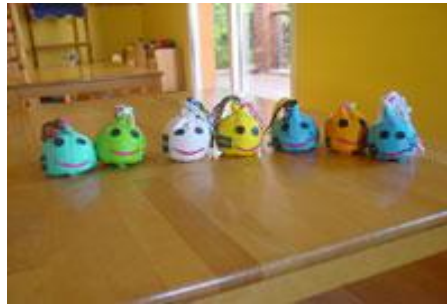
Resim 2.4: Oyun araç gereçleri dikkatli seçilmelidir

Oyun planlanırken dikkat edilecek bir diğer nokta da oyunlarda kullanılacak araç gereçlerin planlanmasıdır. Planlamada eğitim ve öğretim verilen kurumun olanaklarının iyi bilinmesi gerekir.