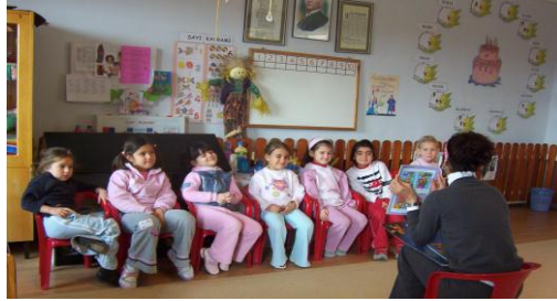
Resim 1.17: Dil gelişiminde oyun