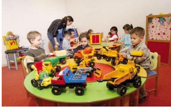
Resim 2.12: Oyunun oynanması