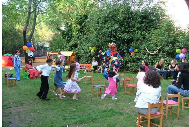
Resim 2.6: Oyun yeri oyuna uygun olmalıdır

Oyun etkinlikleri planlanırken yukarıda belirttiğimiz bütün unsurlar göz önünde bulundurulmalı, hiçbiri atlanmamalıdır. Birbirleriyle bağdaştırılmalı, bütünlük sağlanmalı ve örtüştürülmelidir. Bunların yapılabilmesi için eğitimcinin ilgili, sabırlı ve özenli davranması gerekmektedir. Örneğin büyük kas gelişimi alanı ile ilgili amaçlar ve kazanımlar belirlendi, uygun oyun seçildi, uygun oyunun bayrak yarışı olduğu düşünüldü. Bu oyun için iki bayrağın hazırlanması ve oyun oynanacak salonun uygun olup olmadığının kontrol edilmesi gerekir. Bayrak bulamayıp bu oyunda bayrak yerine top kullanmak etkinlikle örtüşmez ya da bu oyun salon yerine sınıfta oynamak istenirse oyun yerinin uygunluğu ilkesine uymaz.