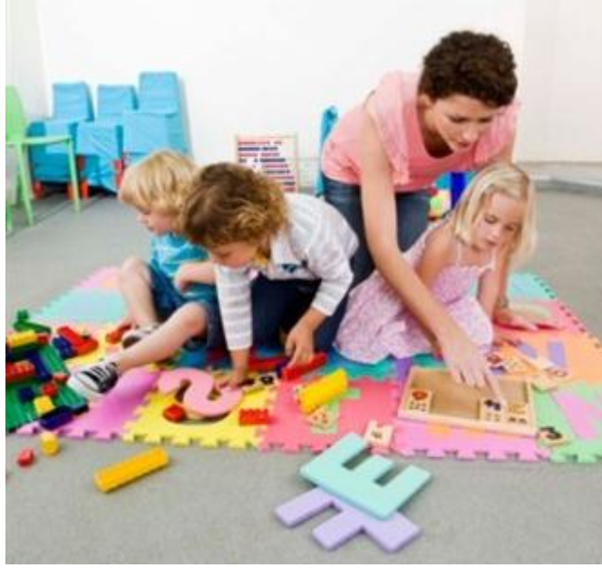
Resim 1.19: Sosyal-Duygusal gelişimde oyun