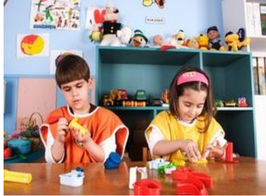
Resim 1.6: “Eğer çocuk oyun oynama olanaklarına sahipse, ellerini kullanarak bir şeyler yapması ortaya çıkarması kabul görüyorsa; zihinsel ilgileri anlayış ve sempati ile karşılanıyorsa, hayal kurma özgürlüğü tanınıyorsa, içinden geldiği gibi düşünmesine izin veriliyorsa, çocuğun bu alanlarda göstereceği ilgi ve beceriler onun akıl sağlığının ve yaşam enerjisinin olumlu göstergeleri olacaktır.”Isaacs