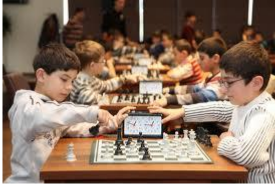
Resim 1.14: Kurallı oyunlara örnek satranç

Kurallı oyun (7-12 yaş) : Bu dönemde genellikle kesin ve karmaşık kuralları olan oyunlar satranç, monopol, tabu vb. oyunlar tercih edilir. Bu oyunların kesin ve değişmez kuralları vardır.