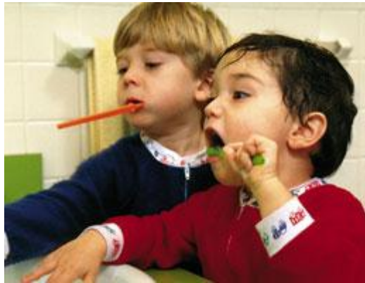
Resim 1.20: Öz bakım becerilerinin gelişiminde oyun