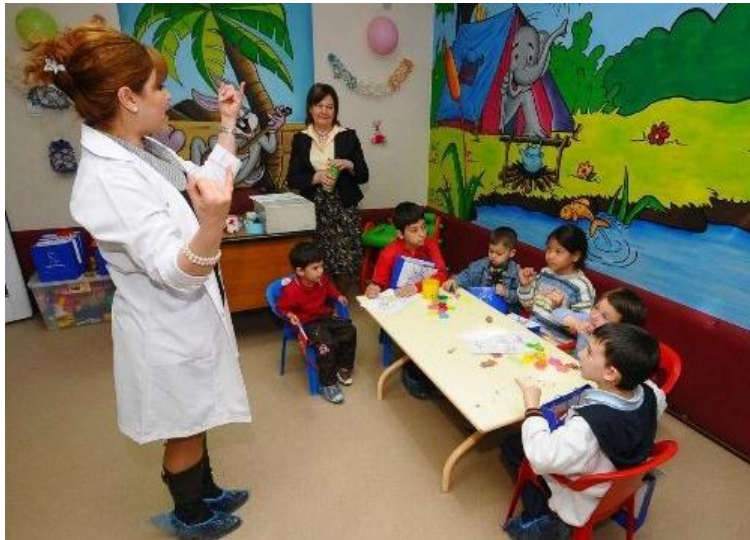
Resim 1.25: Çocuk oyunlarla, hastanede kaldığı sürede kendini güvende ve mutlu hisseder

Her çocuğun ilgisini çekecek, çok farklı çeşitli oyun materyalleri bulundurulmalıdır. Bunlar sanat materyalleri, yapı inşa malzemeleri, bloklar, CD'ler, yapbozlar, radyo, televizyon, bilgisayar, dış mekan oyuncaklarına yer verilmelidir. Hastanede ayrıca, tıbbi oyuncakların bulundurulması çok önemlidir. Örneğin tansiyon aleti, şırınga, stetoskop, yara bandı, doktor giysileri, boş ilaç kutuları, çeşitli cinsiyette oyuncak bebekler bulundurulmalı, çocukların bu aletlerle tanışması, onları işlevlerine uygun olarak kullanması sağlanarak kaygı düzeylerinin etkileyecek ve bazı tıbbi işlemlerden dolayı duydukları korkularını azaltacaktır. Gözlem yapacak yetişkin desteği, çocuklara destek olacak, sıcak ilişkiler kurabilen, güler yüzlü, kabullenici, tutarlı ve hoşgörölü bir yetişkinin olması gerekir.