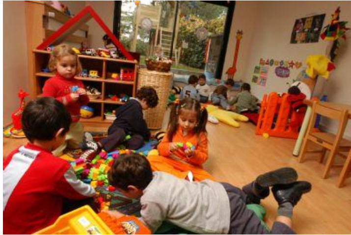
Resim 1.7: Çocuk oyun yolu ile sosyalleşir

Çocuk oyun içinde kendisi için gerekli bilgi, beceri ve alışkanlıkları yaparak, yaşayarak öğrenir. İnsanlık ilişkilerini, yardımlaşma, konuşma, bilgi edinme, alışkanlık ve deneyim kazanma, yaşam rollerini anlama vb. olguları oyun içinde kavrar benimser ve pekiştirir. Çocuğun yetenekleri oyun içinde keşfedilir. Oyun gerçek bir eğitim aracıdır. Erken çocukluk eğitiminde oynanan oyunlar ileriki yıllarda oyunların kuşaktan kuşağa aktarılmasını da sağlar.