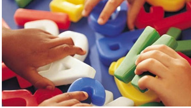
Resim 2.7: Araç gereçler çocuğa uygun olmalıdır