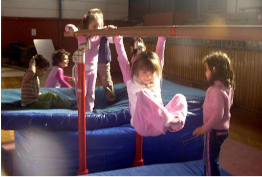
Resim 2.1: Oyunun planlanması çok önemlidir