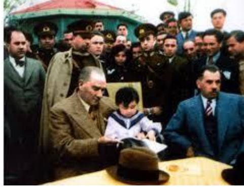
Resim 1.2: Küçük hanımlar küçük beyler sizler hepiniz geleceğin yıldızı, bir mutluluk parıltısıdır. (M.Kemal ATATÜRK)

“İnsan sözcüğün tam anlamıyla oynadığı yerde insandır.” demiş Schiller. Oyun çok geniş kapsamlı bir sözcüktür. Bu nedenle yapmış olduğumuz tanımlara birçok tanım daha ekleyebiliriz.