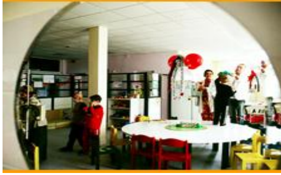
Resim 1.24: Hastanede sağlanan oyun ortamı