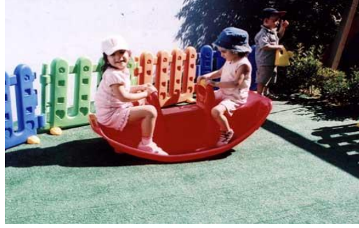
Resim 2.5: Bahçe oyun araç gereçleri