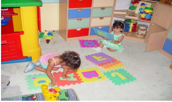
Resim 1.13: Paralel oyun ve birlikte oyun evresi.

Çocuk çevresindeki çocukların oyunlarından etkilenmeden bağımsız bir şekilde tek başına oynar, çevresindeki hiçbir şeyden etkilenmez. Bu durum 0-2 yaşlar arasında görülmektedir. Oyunları tek başına kule yapmak, topu atmak vb.dir.