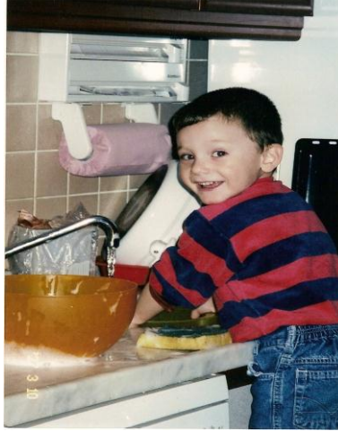
Resim 1.5: Çocuklar su ile oynamayı çok severler

Yaşına göre deđişen oyunlar çocuđun bir çok etkinlikle uğraşmasına neden olur. Örneđin 2 yaşındaki bir çocuk suyla oynamaktan çok hoşlanır. Boyalarla karalamalar yapar. Kille, çamurla oynamak onu çok mutlu eder. Bu yıllarda çocuklar kendilerini konuşarak tam olarak ifade edemediklerinden boyalar, hamurlar onlar için kendilerini ifade etme aracıdır. İki yaşlarında çocuklar çok sesli ve gürültülü oyunların yanı sıra sessiz oyunları da çok severek oynarlar. Çocuđun 3 yaşına kadarki temel uğraşısı oyundur. Çocuklar oyun sırasında çok büyük zevk alır ve mutluluk duyarlar. Nasıl büyükler hayatlarını işleri ve aileleri üzerine inşa ederlerse çocuklar da kurdukları oyunlar üzerine inşa ederler.