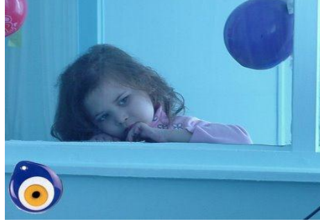
Resim 1.22: Oyun çocuğun rahatlatma aracıdır