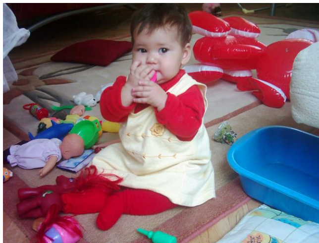
Resim 1.12: Tek başına oyun evresi