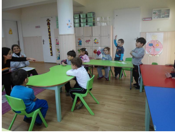
Resim 2.13 :Aile katılımı

Oyun etkinliklerinde aile katılımlarına örnek olarak;