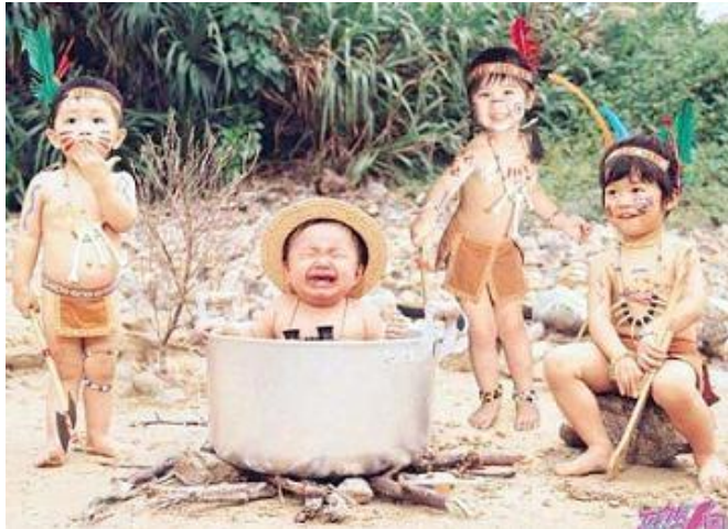
Resim 1.1: Oyun çocuğu hayata hazırlayan en önemli araçtır