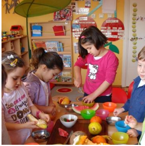
Resim 1.18: Psikomotor gelişiminde oyun