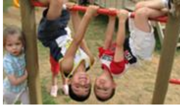
Resim 1.8: Oyun çocuğun büyük kaslarının gelişimine yardımcı olur

Büyüme çocuğun fizik gelişimine yansırken, gelişme motor gelişim ile ilişkili bir kavramdır. Oyun solunum, sindirim, boşaltım sistemlerinin düzenli çalışmasını sağlar.