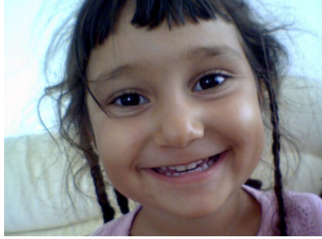
Resim 2.2: Oyun çocuęun gelişim alanlarına uygun olmalıdır

Oyun; amaç ve kazanımlara çocuęun gelişim alanlarına, erken çocukluk eğitimi kurumunun olanaklarının yerin ve mekanın zamanın uygunluęuna, göre belirlenir.