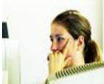
Resim 2.3: Söylenenleri dinlemede dikkat

Bu şemada hız yöneticisi olarak adlandırılan beyindir. Beynimiz işittiğimiz kelimeleri karakterlere dönüştürmemizi sağlayarak parmaklarımıza yaptığı uyarı ile (motor hareket dediğimiz) tuşlara vurmamızı ve günden güne yapılan çalışmalarla dinleyerek de hızlı bir şekilde yazı yazabilmemizi sağlar.