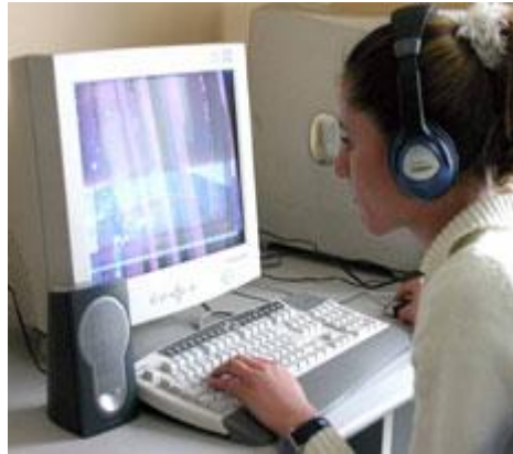
Resim 2.2: Kulaklı Yapılan Dinleme

Monitörü kapatıp sadece dinlediğimiz sese kendimizi vererek çalışmalar yapabiliriz.