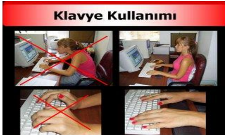
Resim 1.1: Klavye kullanımında oturuş ve parmakların durumu

Bilgisayarlar beş yıl içinde iyi bir araştırma görevlisi kadar iyi bilgi toplayabilecekler. Çalışanlarımızın eline güçlü bilgisayarlar verdiğinizde, firmayı güçlendirecek yeni yollar üretebilirler ve hiç beklemediğiniz bir sinerji yakalayabilirsiniz. Yazılım firmaları yazılımlarını daha kullanıcı dostu yapmaya çalışıyorlar. Kalem yazıyı kontrol edemeyeceği gibi, bilgisayarlar da kararları kontrol edemez. Ama klemsiz yazmaya çalışmanın da hiçbir avantajı yoktur.