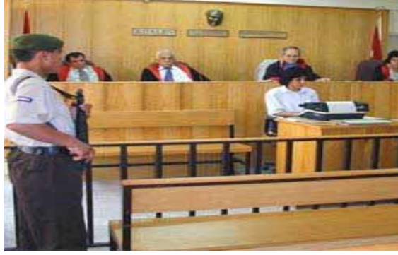
Resim 2.1: Mahkeme salonunda hâkimin söylediklerinin yazılışı