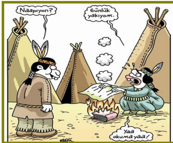
Resim 1.2: Haberleşme üzerine bir karikatür