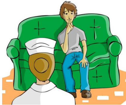
Resim 1.2: Sır saklama ilkesi

Sağlık personeli, sağlık bakım kurumunda hastalar hakkında öğrendiği tüm bilgileri gizli tutmak durumundadır.