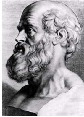
Resim 1.1: Hipokrat (MÖ 370-460)

Hipokrat andında ana ilke; kişisel özelliklerine bakmaksızın hekimin her koşulda hastasına yararlı olması ve onun iyiliği için çalışmasıdır. “yararlılık ilkesi” olarak adlandırdığımız bu ilke diğer sağlık çalışanları için de geçerlidir.