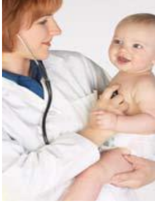
Resim 1.2: Doktor

Örnek: Muayenehanesinde hasta kabul eden bir doktorun, ilmî veya mesleki bilgiye ve ihtisasa dayanan bu faaliyeti, serbest meslek faaliyetidir. Ancak, bu doktor ayrıca bir özel hastane işletmekte ise, Türk Ticaret Kanunu ve Gelir Vergisi Kanunu'nda özel hastane işletmek ticari faaliyet sayıldığından, bu faaliyet sonucunda elde edilen kazanç “ticari kazanç” olacaktır. Bu kişi yıllık gelir vergisi beyannamesini verirken doktorluk faaliyetinden elde ettiği kazancı serbest meslek kazancı, özel hastanecilik faaliyetinden elde ettiği kazancı ise ticari kazanç olarak beyan edecektir.