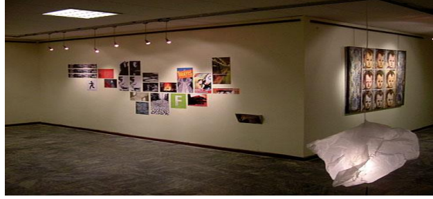
Resim 2.8: Sergi

Dar mükellefiyete tabi (Türkiye’de yerleşmiş olmayan) olanların hükümetin izniyle açılan sergi ve panayırarda yaptıkları serbest meslek faaliyetlerinden elde ettikleri kazançlar gelir vergisinden istisna edilmiştir.