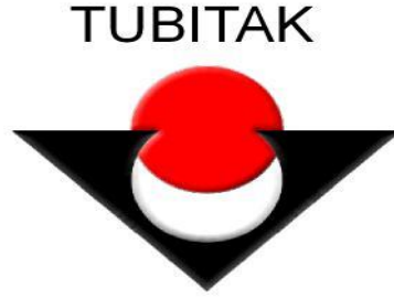
Resim 2.9: Tübitak Logosu

İlim, fen ve güzel sanatların gelişmesini ve memleket bakımından faydalı olan diğer iş ve faaliyetleri teşvik amacıyla serbest meslek erbaplarına verilen ödüllerin miktarları ne olursa olsun gelir vergisinden istisna edilmiştir.