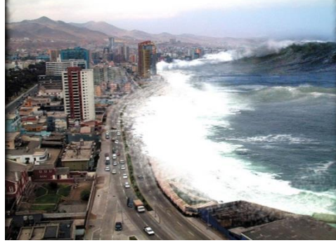
Resim 2.6: Tsunami Felaketi