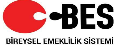
Resim 2.4: Bireysel Emeklilik Sistemi Logosu

Yıllık beyanname veren mükellefler, vergi matrahlarının tespitinde bireysel emeklilik sistemine ödedikleri katkı payının beyan edilen gelirin % 10'una kadar olan kısmını gelir vergisi matrahlarının tespitinde indirim konusu yapabileceklerdir. Bireysel emeklilik dışında kalan şahıs sigortaları için ödenen primlerin ise beyan edilen gelirin %5'ine kadar olan kısmı matrahın tespitinde indirim konusu yapılacaktır. İndirim konusu yapılacak tutarın hesaplamasında beyan edilen gelir olarak, yıllık gelir vergisi beyannamesinde yer alan indirimler ve geçmiş yıl zararları toplamından önceki tutar esas alınacaktır.