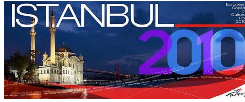
Resim 2.7: İstanbul 2010 Kültür başkenti logosu

5706 sayılı İstanbul 2010 Avrupa Kültür Başkenti Hakkında Kanun uyarınca kurulan Ajansa yapılan her türlü ayni ve nakdi bağış ve yardımlar ile sponsorluk harcamalarının tamamı gelir vergisi beyannamesinde bildirilecek gelirlerden indirilebilecektir.