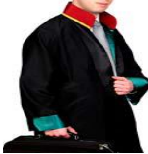
Resim 1.1: Avukat

Serbest meslek faaliyeti, sermayeden çok şahsi mesaiye, ilmi veya mesleki bilgiye veya ihtisasa dayanan ve ticari niteliği olmayan işlerin işverene bağlı olmaksızın şahsi sorumluluk altında kendi nam ve hesabına yapılmasıdır.