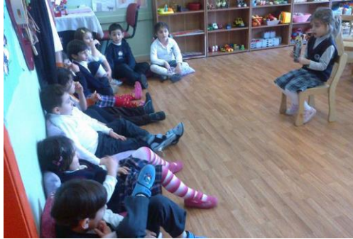
Resim 2.1: Türkçe Etkinliklerinde Öykü anlatımı