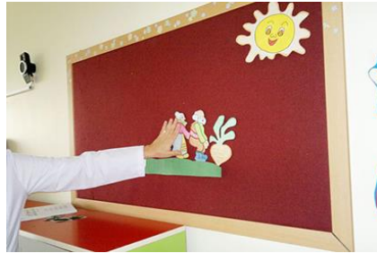
Resim 2.3: Pazen tahta figürü ile anlatım

Pazen tahta yerine piyasada hazır olarak satılan manyetik panolara yapıştırarak da hikâye anlatmak mümkün olmaktadır. Bunun için arkası mıknatıslı figür ya da kartlar kullanılır.