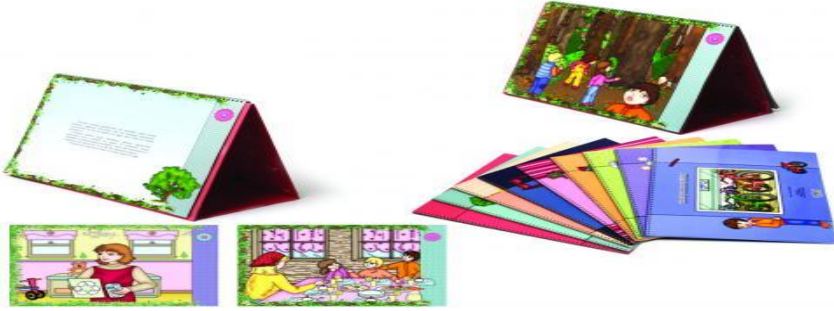
Resim 2.7: Döner levha örnekleri

Döner levha (flipchart): Öykü anlatımında kullanılan diğer bir teknik de döner levhadır. Büyük boyda kağıtlara hazırlanan öykü spiral ciltle birleştirilir. Bir tarafına öykünün resimleri diğer tarafta da öykünün anlatıldığı kısım bulunur. Öğretmen tarafında öykünün anlatıldığı yazılar, çocuklara bakan taraftaysa öyküyle ilgili resimler bulunan bir araçtır. Önceden hazırlanan ve sıraya konan sayfalar birer birer çevrilerek öykü anlatılır.