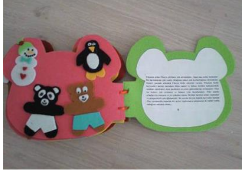
Resim 2.5: Öykü Kitabı