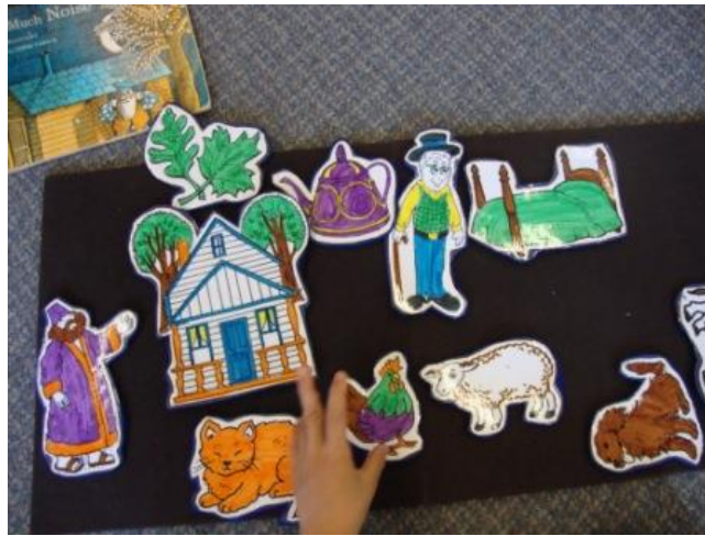
Resim 2.6: Pazen Tahta Figürü

Manyetik tahta kartları ile öykü anlatmak için kare veya dikdörtgen şeklinde mıknatıslı bir tahtaya ihtiyaç bulunmaktadır. Manyetik tahta kartları ve figürleri hazırlamak için, karton veya resim kâğıdına öyküde geçen hazırlanmış karakter ya da figürler çizilir ve boyanır. Kartların ve figürlerin arkasına mıknatıs yapıştırılır. Hazırlanan materyalin sağlam olmasına özen gösterilmelidir. Daha sonra manyetik tahta üzerinde öykü anlatılır. Kullanılan materyal ve figürlere göre öyküler oluşturulur.