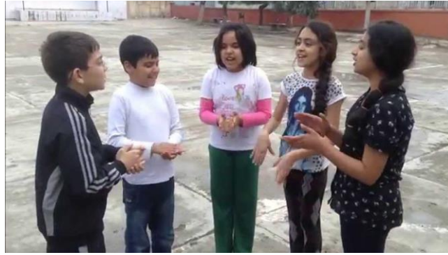
Resim1.5: Oyun Tekerlemeleri