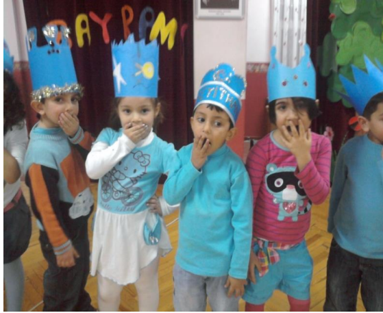
Resim 3.2: Türkçe etkinliklerinde pandomim çalışmaları