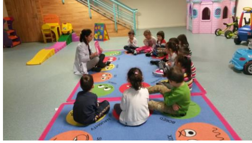
Resim 2.2: Öykü kitabı ile anlatım

Kahramanlar genellikle hareketli, dinamik, çocuklara olumlu duygu, düşünce ve davranış kazandırma özellikleri bulunacak nitelikte olmalıdır.