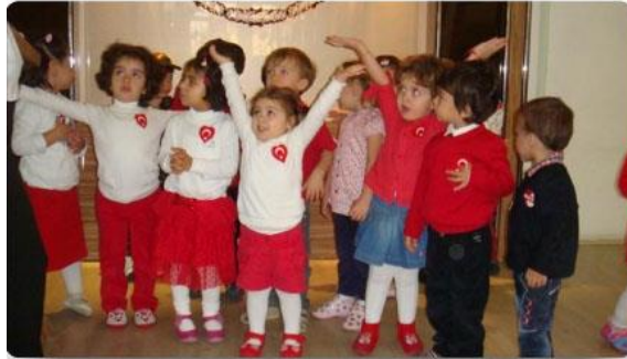
Resim 1.8: Türkçe Etkinliklerinde Şiir