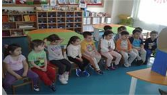
Resim 3.1: Türkçe etkinliklerinde öykü oluşturma ve tamamlama çalışmaları