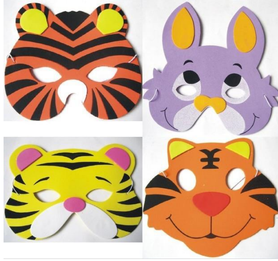
Resim3.4: Öykü Sonrası Etkinliklere Uygun Araç Gereçler