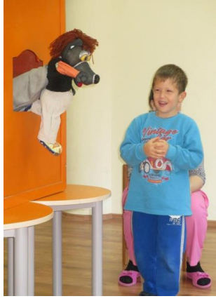
Resim 2.4: Kuklalarla öykü anlatımı

Öğretmen kuklalarla öykü anlatırken, bir kukla sahnesi hazırlamalı veya kukla sahnesinin yerine çevredeki eşyaları ya da sınıfın fiziki ortamını değişik şekillerde kullanmalıdır.