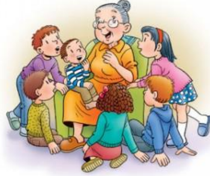
Resim1.7: Masal Tekerlemeleri