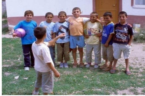
Resim 1.4: Sayısmaca Tekerlemeleri