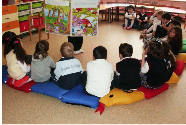
Resim 1.2: Türkçe Etkinliği

Okul öncesi eğitim kurumlarında günlük program uygulamaları içerisinde yer verilen etkinliklerin önemli bir bölümünü Türkçe etkinlikleri oluşturmaktadır. Bu etkinlikler çocukların yeni sözcükler öğrenerek sözcük dağarcıklarını geliştirmelerine, sözcükleri doğru ve yerinde kullanabilmelerine, dil aracılığıyla düşüncelerini ifade edebilmelerine ve kitap sevgisi ve kitap okuma alışkanlığı kazanabilmelerine yardımcı olmaktadır.