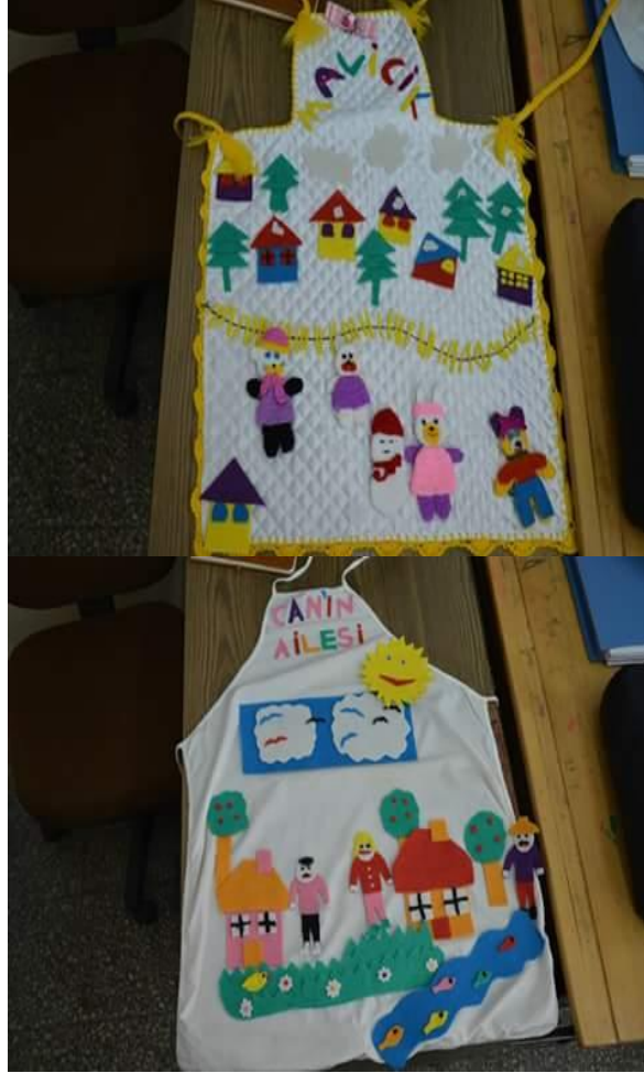
Resim 2.8: Öykü Önlüğü örnekleri