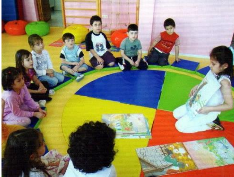
Resim 1.1: Türkçe Etkinliği