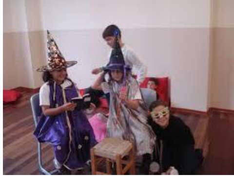
Resim 3.3: Türkçe etkinliklerinde dramatizasyon çalışmaları