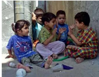
Resim1.6: Oyun Tekerlemeleri

Mini mini birler, Çalışkandır ikiler, Mavi gözlü üçler, Dayak yiyen dörtler, Misafirdir beşler, Altılar, altınımı aldılar, Yediler, yemeğimi yediler, Sekizler, seke seke gittiler, Dokuzlar, doktor oldu, Onlar bizi okuttu.