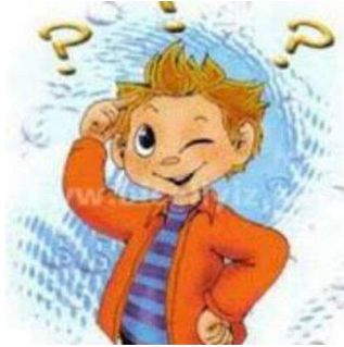
Resim1.3: Türkçe etkinliklerinde bilmeceler