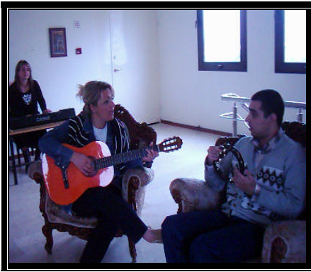
Resim 2.3: Bireysel müzik etkinliği

Uyumsuz çocuklar müzik çalışmalarıyla duyarlı ve nazik bireyler olabilirler.