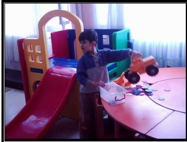
Resim 2.1: Çocuğun cinsiyetine uygun oyuncak oynaması

Oyun terapisi küçük çocuklarda cinsiyetine uygun oyuncaklarla oynatılarak yapılır. Çocuk bu oyuncakları oynamaktan çok hoşlanır. Oynarken onlarla konuşur ve onlara istediği gibi davranır. Bu davranışlar terapistte önemli bilgiler verir. Çocuk davranışlarını, isteklerini ve duygularını en açık biçimde oynarken ortaya koyar. Kıskançlık, kızgınlık, öfke gibi duygularını da oyununa yansıtır. Sevgisini mutluluğunu yine oyunla sergiler. Farkında olmadan iç dünyası hakkında yetişkinlere bilgiler verir. Örneğin bebekleriyle evcilik oynarken kardeşini kıskanan bir çocuk, oyunlarında kardeşi rolündeki bebeği cezalandırabilir ya da dönmek üzere seyahate gönderebilir.