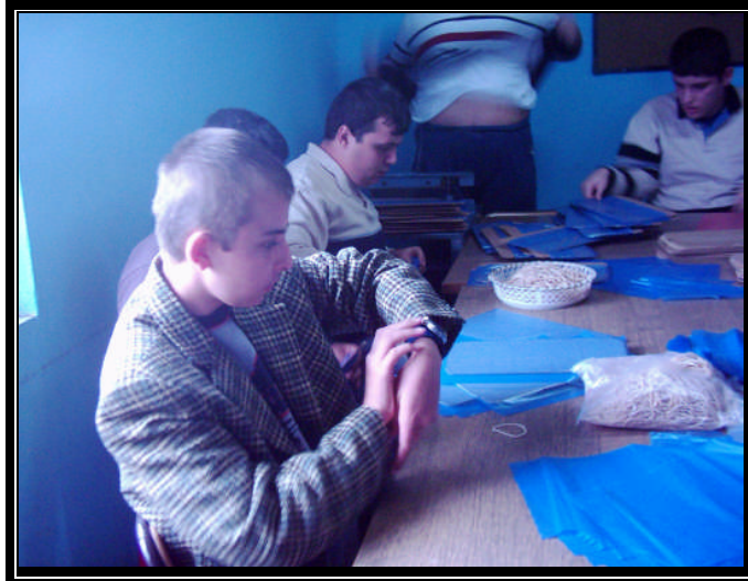
Resim 2.9: Atölyede galoř yapan çocuklar

Naylon, galoř makinelerinde řekillendirilir. Naylon karton kalıba konur ve paket lastikleri naylonlanmış kartona yerleřtirilir. Makineye sokulur ve galoř řekillenir. Yapım ve öđretimi oldukça kolay olan bu iřlem çocuklara çok basit řekilde öđretilir. Öđrencilerin hazırladıđı galořlar satılarak deđerlendirilir.