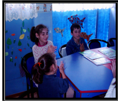
Resim 2.12: Hikaye bitiminde alkışlama