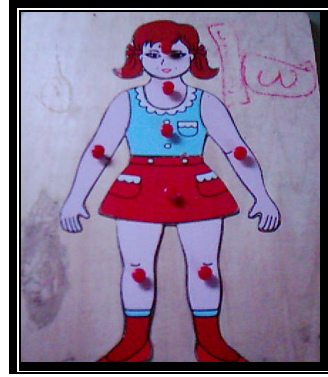
Resim 1.6: Etkinlik materyali