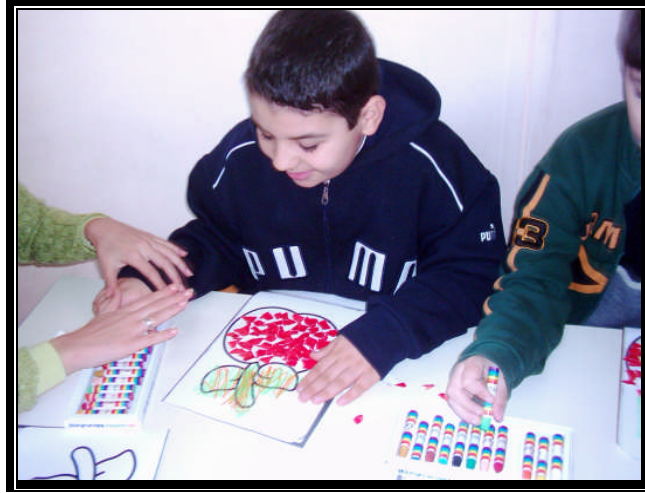
Resim 1.8: Resim boyama etkinliği

Öğretmen psikoeğitsel yaklaşımda; önce sınıf ortamını etkili olarak düzenlemeli, daha sonra bu çocukları kabul edici bir tavır takınarak çocuklara hissettirmelidir. Bu yaklaşım içinde, çocuğun gereksinimleri değerlendirilir ve buna göre bireysel çalışma planı hazırlanır. Çalışma planında genellikle çocuğun kendisinin gerçekleştirebileceği, duygu ve düşüncelerini ortaya koyabileceği etkinliklere yer verilir (Müzik, resim...).