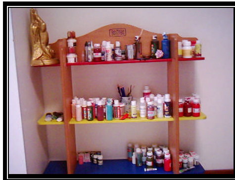
Resim 2.16: Çeşitli renklerde boyalar