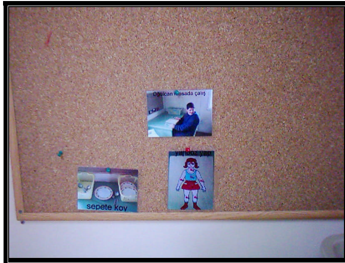
Resim 1.4: Zamanın düzenlenmesi

Otistik çocuklar için zaman soyut bir kavramdır. Otistik çocukların etkinlik süreleri düzenlenirken zamanı olabildiğince somutlaştırmak gerekir. Örneğin; günlük etkinlikler sırasında küçük kartlara yazılıp ya da etkinliğin resmi çekilip öğrencinin masasına asılır. Tamamlanan etkinliğin kartı öğrenciyle birlikte çıkarılır ve diğer etkinliğe geçilir. Böylece çocuk biten etkinliğin arkasından hangi etkinliğe geçeceğini görür.