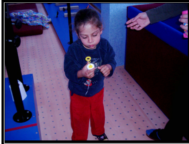
Resim 2.17: Üfleme ile dil kasını geliştirme