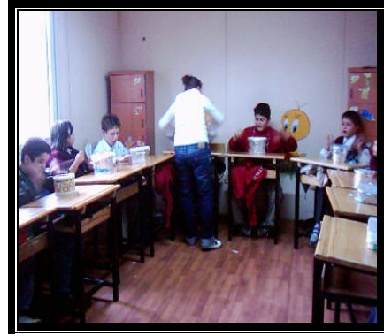
Resim 2.4: Grup müzik etkinliği