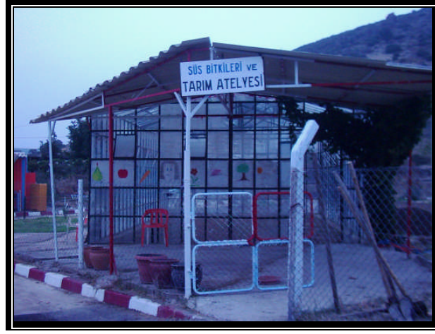
Resim 2.5: Süs bitkileri ve tarım atölyesi

Atölye çalışmalarının çocuklara sağladığı yararlar.