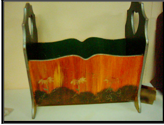
Resim 2.8: Atölyede yapılan gazetelik

Etkinlik: Çocuk gazeteliđi yaparken önce kesilmiş tahtaları zımparalar, birleřtirir ve en son boyamasını yaparak gazeteliđi tamamlamış olur.