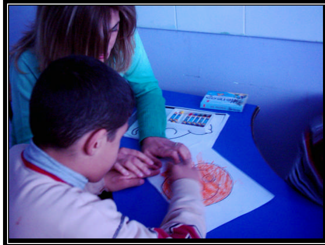
Resim 2.2: Resim terapisi yapan çocuk

Çocuklar bu çalışmalarını zevkle yapar ve devam ettirirler. Bir taraftan sanat becerileri gelişirken diğer taraftan da kendilerini en iyi şekilde ifade etme olanağı bulurlar. Böylece durumlarını düzeltebilirler.