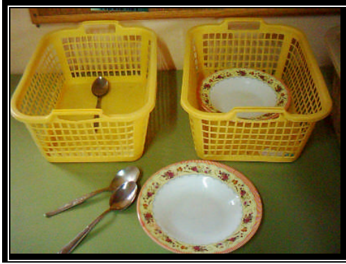
Resim 1.5: Etkinlik Materyali