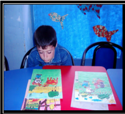
Resim 2.11: Kartlarla hikaye anlatma

Etkinlik 2: Çocuğun eline hikâye kartları verilir ve hikâyeyi anlatması istenir.