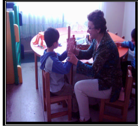
Resim 2.14: Alkışlayarak ödüllendirme