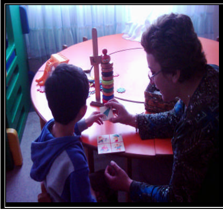
Resim 2.13: Resimli kartlarla çalışma