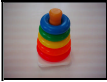
Resim 2.10: Etkinlik materyali

Hayati önemi fazla olan, az akademik, kısa süreli anlamlı ders konularını öğretmeyi amaçlayan etkinlikler.