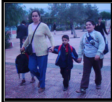
Resim 1.7: Ailenin yardımı

Otistik çocukların kazandıkları davranışların kalıcı olabilmesi için eğitimin sürekli olması gerekir. Bu nedenle yaz tatillerinde “Yaz Okulları” ile eğitimlerine devam ederek çeşitli sosyal etkinliklere katılmaları sağlanmalıdır.