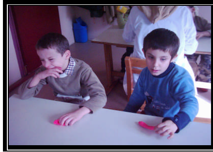
Resim 1.3: Çevresine karşı ilgisiz davranan çocuklar

Burada önemli olan konu antisosyal davranışların sıklığı, süresi ve şiddetidir. Çocuğu bu tür davranışlara zorlayan etmenlerin olup olmadığına dikkat etmek gerekir. Toplumumuzda bu tür davranışlar gösteren çocukların ileride düzeleceklerine ilişkin yaygın bir inanış vardır. Bu inanış aslında doğru değildir. Yapılan araştırmalar sonucu antisosyal davranış gösteren çocuklarda, uygun önlemler alınmaz ise; bu davranışların ileriki yaşlarda devam ettiği görülmüştür.