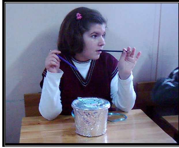
Resim 1.2: Olgunlaşmamış çocuk