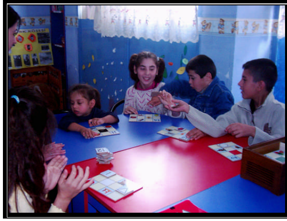
Resim 2.15: Tombala oynayan çocuklar

Tombala oyunu çocuğun görsel ve işitsel belleğini artırıcı bir etkinliktir.