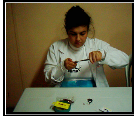
Resim 2.7: Takı çalışması