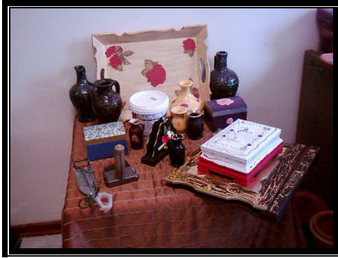
Resim 2.6: Atölyede yapılan ürünler

Bu atölyede yapılan çalışmalar şunlardır: makrome işleri, toka ve boncuklardan üretilen takılar, plaj hasır yapma, gazetelik çeşitli hediyelik eşyalar.