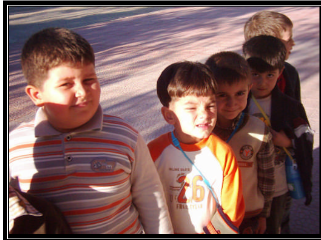
Resim 1.1: Uyumlu çocuklar

Çocuk, doğduğu andan itibaren yaşama uyum gösterme çabası içindedir. Büyümeye başladıktan sonra, içinde bulunduğu çevrenin ve toplumun kurallarına uyum göstermeye başlar. Burada aileye büyük görevler düşer. Çünkü aile, çocuğun ilk sosyal deneyimlerini edindiği yerdir. Çocuğa yöneltilen davranış ve ona karşı takınılan tavır, ilk yaşantıların örülmesinde büyük önem taşır.