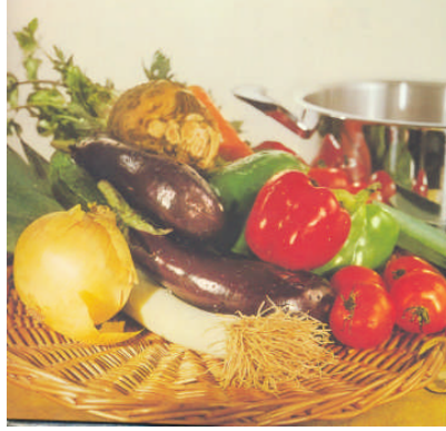
Resim 1: Sebzeler

Besin bakımından insan vücuduna birçok faydası olan bu besinlerin misafir masasında hazırlanması onların göz zevklerine de hitap etmeyi sağlar. Çiğ veya pişmiş sebze ile et, balık, tahıl, süt ürünlerinin karıştırılması ile hazırlanabilecek bir çok salata çeşidi mevcuttur. Ancak misafir masasında hazırlanacak salatanın misafirin gözü önünde hijyenik, düzenli, besin öğelerine zarar vermeden lezzet, kıvam, renk, öğelerine ve birleşimlerine dikkat ederek pratik ve çabuk hazırlanması esastır. Malzemeleri misafir masasına getirmeden önce mutfakta ön hazırlıkların da yapılmış olması gereklidir.