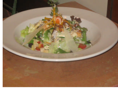
Resim 4: Sezar salata örnekleri