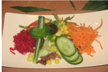
Resim 10: Karışık salata

Kıvırcık salatayı iyice yıkayıp doğrayınız, geniş bir kabın içine alınız. Daha sonra salatalık, domates ve turşuyu doğrayıp kıvırcığın üzerine ekleyiniz. Kırmızı lahana ve havucu rendeleyiniz, maydanoz ve dereotunu ince kıyınız, bunları da kaba ilave edin. Kaba en son mısır taneleri ve zeytini koyunuz Derince bir kasenin içinde zeytinyağı, sirke, limon ve tuzu iyice çırpınız, doğradığınız malzemeye sosu iyice karıştırınız. Dörde pay ederek servis yapınız.