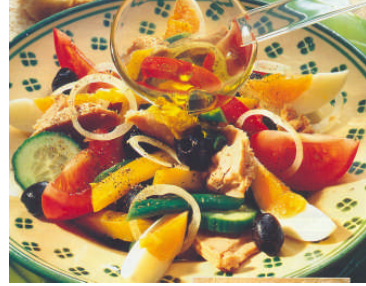
Resim 8: Karışık salata örnekleri