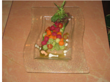
Resim 14: Parizyen salata örneği

Yeşillik olarak bahsedilen sebzeler mevsim özelliğine göre değişiklik gösterebilir. Ayrıca sos ile beraber hardalda isteğe göre salatanın yanında verilebilir.