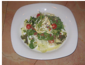
Resim 12: Mimoza salata örnekleri