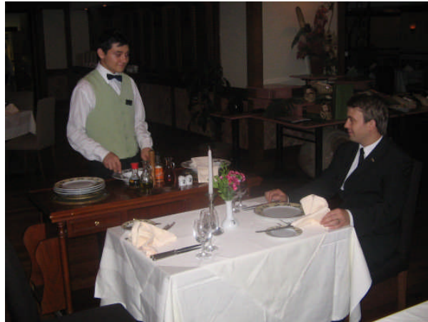
Resim 32: Salata arabası ile salata servisi