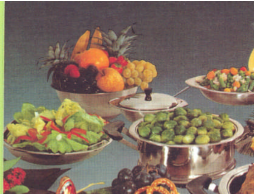
Resim 19: Salata garnitürleri

Özellikle meyve salataları ile sık olmasa da bazı salatalarda taze meyveler, baharatlı elmalar, şeftaliler, karpuz turşuları da garnitür olarak kullanılabilir.