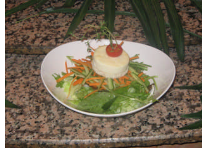
Resim 6: Yeşil salata örnekleri