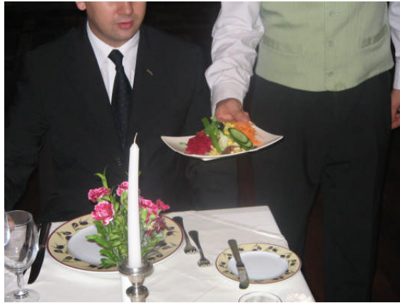
Resim 34: Tabakta salata servisi

Ancak ana yemek ile beraber servis edilen bir salata türü ise kuverinde de bahsedildiđi gibi misafirin sol tarafından ekmek tabađının alt kısmına masa kenarına yakın ana yemek tabađının alt kenarına salata tabađının alt kenarı hizalanacak şekilde yerleřtirilir. Eđer kuver hazırlamada ekmek tabađı masanın kenarına kuver tabađının alt köşesine hizalanarak konmuş ise biraz ileriye iterek boş alan oluşturulur. Bu alana salatanın servisi yapılır.