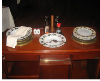
Resim 30: Geridon veya servis arabasının genel olarak hazırlanması ve salata hazırlama