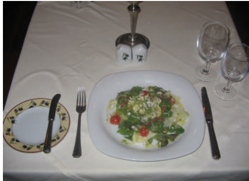
Resim 24: Antre olarak servis yapılmış salata kuveri