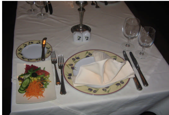
Resim 25: Ana yemekle servis edilen salata kuveri