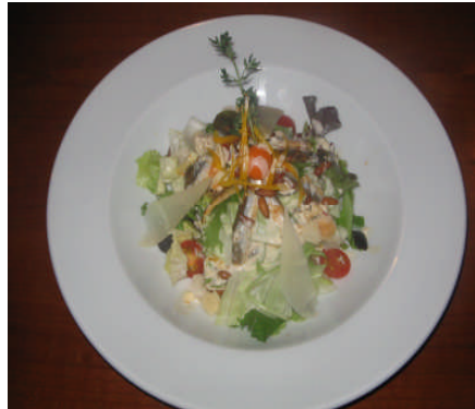
Resim 3: Sezar salata