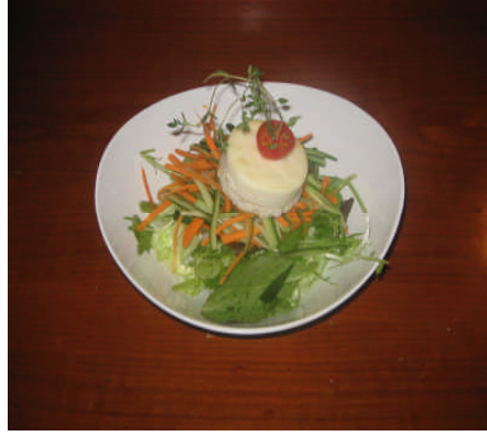
Resim 5: Yeşil salata