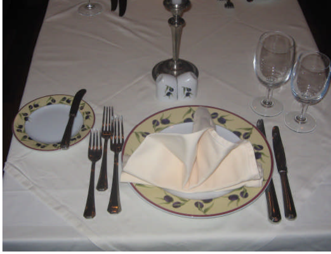
Resim 22: Ana yemekle alınacak salata kuveri