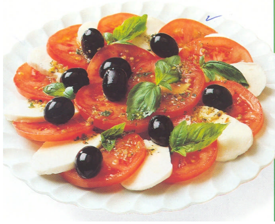
Resim 2: Mozerella salatası örneđi