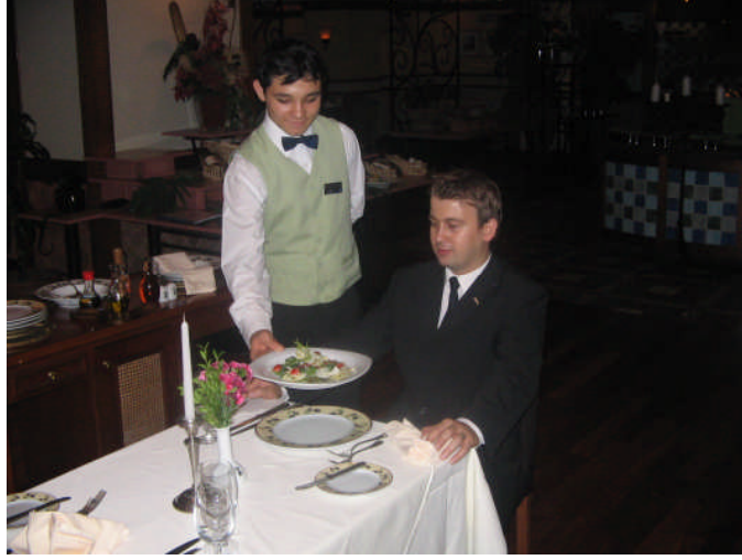
Resim 33: Tabakta salata servisi

Antre olarak veya ana yemekten sonra servis edilecek salata olarak mönüde yer alıyor ise Amerikan servisinde olduđu gibi misafirin sađ tarafından usulüne uygun olarak misafirin önüne servisi yapılır (Tabak servisi).