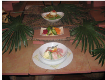
Resim 18: Şef salata

Göbek salatayı, kıvırcık salatayı, tere ve rokayı ince ince doğrayarak bir tabağa koyunuz. Dana jambon, piliç jambon, kaşar peyniri ve Macar salamını ince şeritler halinde doğrayınız. Ardından yine ince uzun doğradığınız kırmızıbiberlerle harmanlayınız. İkiye böldüğünüz kuşkonmazları da ekleyiniz. Harmanladığınız malzemeyi yeşil salatanın üzerine serpiştiriniz. Başka bir kaptaki sos için tüm malzemeyi bir çırpma teliyle karıştırınız. Hazırladığınız salatanın üzerine gezdiriniz. Haşlanmış yumurta ve kiraz domateslerle süsleyerek servis yapabilirsiniz.