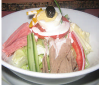
Resim 16: Şef salata