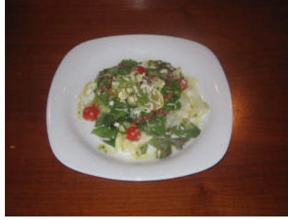
Resim 11: Mimoza salata