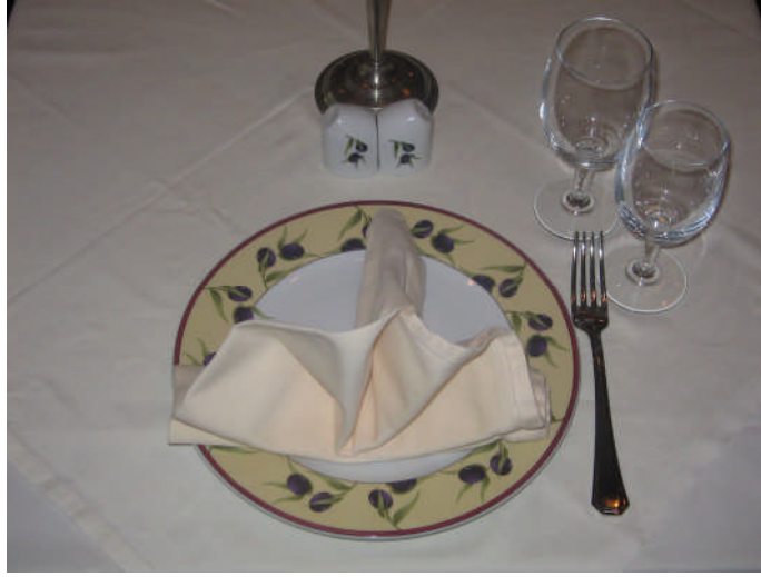
Resim 23: Ana yemekten sonra servis edilecek salata kuveri