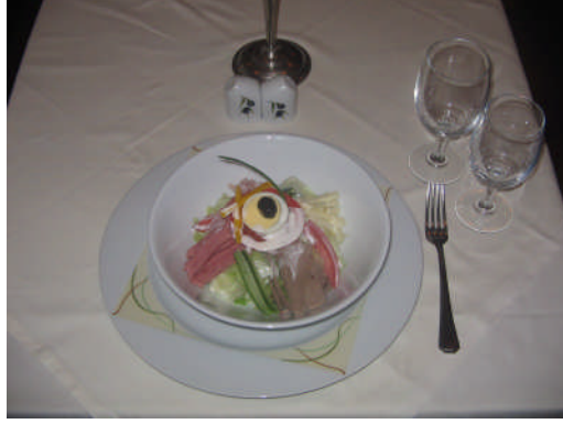
Resim 26: Ana yemekten sonra servis edilen salata kuveri