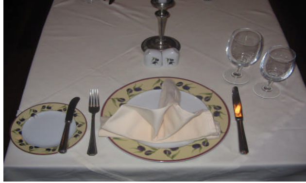
Resim 21: Antre olarak alınacak salata kuveri