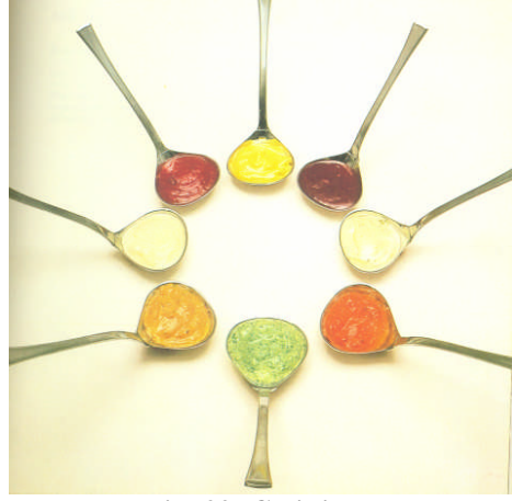
Resim 29: Çeşitli soslar