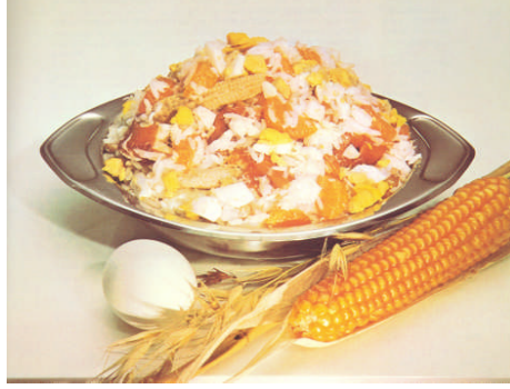
Resim 28: Yayla salatası

Malzemenin hepsini birlikte iyice karıştırıp bir şişeye koyunuz. Servis anında iyice çalkalayıp kullanınız. Not: ITIR baharatçılarda bulunur.