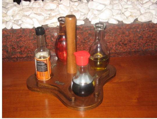
Resim 27: Salata sosları

Sos salatada lezzeti oluşturur. Salatanın beraberliği, anlamı sos tarafından sağlanır. Sos konmayan salata istenilen tadı vermeyebilir. Uluslar arası mutfaklarda kullanılan birçok salata sosu mevcuttur. Sosun temel birleşenlerinde bazı değişiklikler yaparak veya içine konulan baharat vb. maddelerin oranını artırarak ya da değiştirerek bir çok yeni sos türleri üretebiliriz. Sos özel salatalar ve istisnalar haricinde genellikle servisten hemen önce salataya ilave edilir.