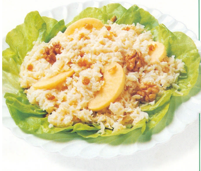
Resim 15: Waldorf salata

Salatanın dekoratif görünmesi için Lollorosso ve endivien yeşilliği, havuç ile garnitürleşebilir. Sos olarak French dressing veya kokteyl sos da kullanılabilir.