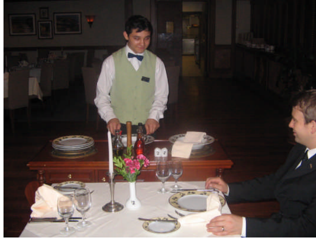
Resim 31: Salata arabası ile salata servisi servisi